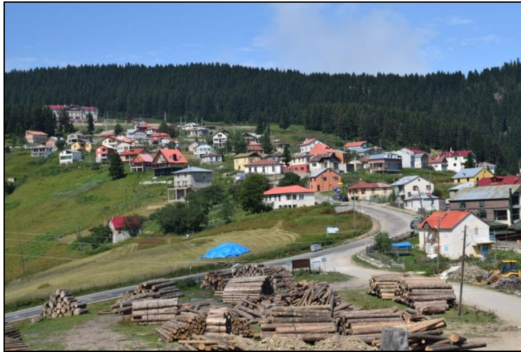
Fotoğraf 1. Giresun ilindeki en tanınmış yayla yerleşmelerinden biri olan ve 1991 yılında turizm merkezi olarak ilan edilen Kulakkaya Yaylası'ndan bir görünüm.