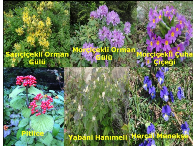
Fotoğraf 3. Kulakkaya Yaylası ve çevresinde çok sayıda çalı türü, otsu bitkiler ve çiçek türleri bulunmaktadır.