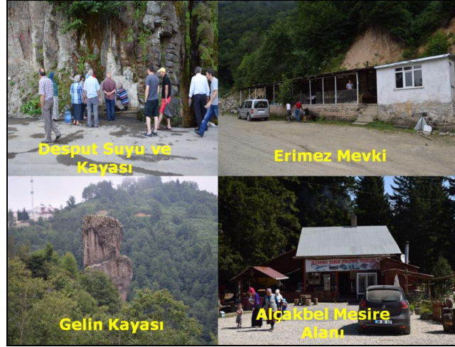
Fotoğraf 8. Kulakkaya Yayla yerleşmesinin yakınında bulunan Desput suyu ve kayası, Alçakbel mesire yeri ile yol üzerinde bulunan Gelin Kayası ve Erimez Mevki özellikle yaz aylarında oldukça ilgi görmektedir.

Bektaş Yaylası ve Karagöl Dağları’na günübirlik turlar da yapılabilmektedir. İlerleyen dönemde at safari ve kayak turizmi aktivitelerinin yapılmasına dönük çalışmalar da devam etmektedir.