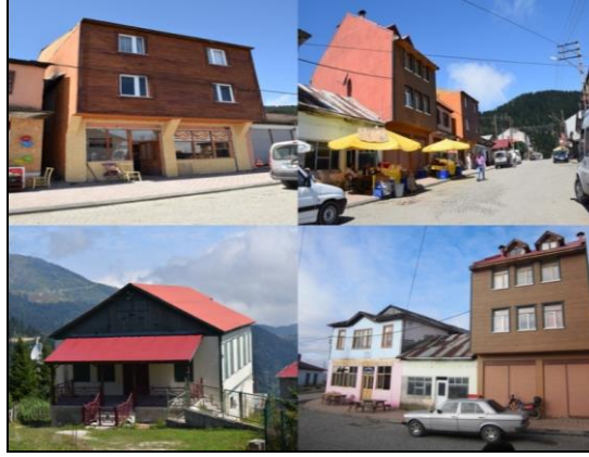
Fotoğraf 4. Kulakkaya yayla yerleşmesindeki çağdaş meskenlerden görüntüler.

uygun olmayan çağdaş binaların, yaylanın özgünlüğüne uygun hale getirilmesine yönelik çalışmalar devam etmektedir. Bu bağlamda Giresun Valiliği’nce çağdaş yayla evlerinin dış cephesinin ahşapla kaplanmasına dair alınan karar gereğince bazı çağdaş meskenlerin dış cephesi ahşapla kaplanmıştır (Fotoğraf 4).