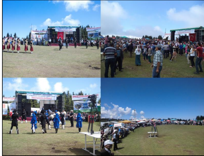
Fotoğraf 10. Kulakkaya – Ağaçbaşı Uluslararası Yayla Kültür ve Sanat Festivali'nden görüntümler.

aktivitelerinden birisi olan, her yıl temmuz ayının ilk pazar günü gerçekleştirilen Kulakkaya – Ağaçbaşı Uluslararası Yayla Kültür ve Sanat Festivali dir (Fotoğraf 10). Ancak son yıllarda Ramazan ayına rastlaması nedeniyle şenliklerin tarihleri değiştirilmektedir. Birincisi 2007 yılında düzenlenen şenliklerin 7. si 21-22 haziran 2014 tarihlerinde gerçekleştirilmiştir. Şenlikler esnasında horonlar oynanmakta, eğlence programları yapılmakta ve yöresel ürünlerin satıldığı alışverişler gerçekleştirilmektedir. Yöresel lezzetlerden tatma olanağının da bulunduğu şenlikler, hem il içinden gelen yöre halkının, hem de il dışından gelen Giresunlular ve ziyaretçilerin katılımıyla oldukça coşkulu geçmektedir. Bu tür şenlikler, yöre insanının birlik ve beraberlik duygusunu pekiştirmekte, gurbete göç etmiş yöre insanı için de bir kaynaşma vesilesi olmaktadır. Yerel yazılı ve görsel basın tarafından da ilgiyle takip edilen şenlikler, yayla sahasının bilinmesi ve adının duyurulması açısından dikkate değer bir tanıtım olanağı sunmaktadır.