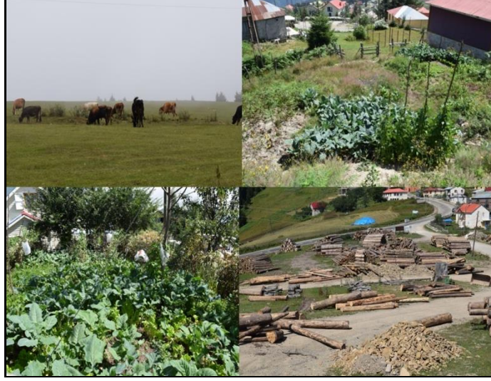
Fotoğraf 6. Kulakkaya Yaylası ve çevresinde yetiştiriciliği yapılan büyükbaş hayvanlar, çeşitli sebzelerin yetiştirildiği şenlik adı verilen bahçeler ile Kulakkaya Orman İşletme Şefliği’ne ait tomruk depolama alanından görünümüler.

Kulakkaya yayla yerleşmesinde bakkal, fırın, restoran, et lokantası gibi az sayıda işyeri bulunmaktadır (Fotoğraf 7). Yaz mevsiminde işyerleri aktif halde iken, kış mevsiminde sürekli aktif olan işyeri kalmamaktadır. Sadece önceden haber vermek şartıyla bazı işyerleri sadece o gün için geçici olarak konuklarına hizmet vermektedir. Diğer yayla yerleşmelerinde olduğu gibi özellikle yayla sezonunda buralara piknik yapmak ve gezmek için gelenlerin en çok uğradıkları mekanlar, et pişirilen lokanta ve kasap işlevini birlikte yürüten işyerleridir. Buradaki otlaklarda yetiştirilen büyük ve küçükbaş hayvanlardan elde edilen lezzetli köfte ve etler, ziyaretçilerin en çok ilgi gösterdiği çekiciliklerdendir. Ayrıca buraya yakın bir mesafede bulunan Yavuzkemaal Beldesi’nde elektrik, su, PTT gibi altyapı hizmetleri ile jandarma, kır lokantaları, bakkallar hizmet vermekte ve misafirlerin birçok ihtiyacına cevap verilebilmektedir. Yayla yerleşmesinde ikamet edenler, birçok ihtiyacını da Bektaş Yaylası, Yavuzkemaal Beldesi, Dereli ilçe merkezi ile Giresun Merkez’den karşılayabilmektedir. Yayla sakinleri Bektaş Yaylası’nda pazar günü kurulan alışveriş pazarı, Dereli ilçe merkezinde Perşembe günleri kurulan Pazar ile Giresun Merkez’deki pazarlarda ve satış yerlerinde, hem yöresel ürünleri pazarlamakta hem de ailelerin gereksinim duyduğu ihtiyaçları karşılamaktadırlar.