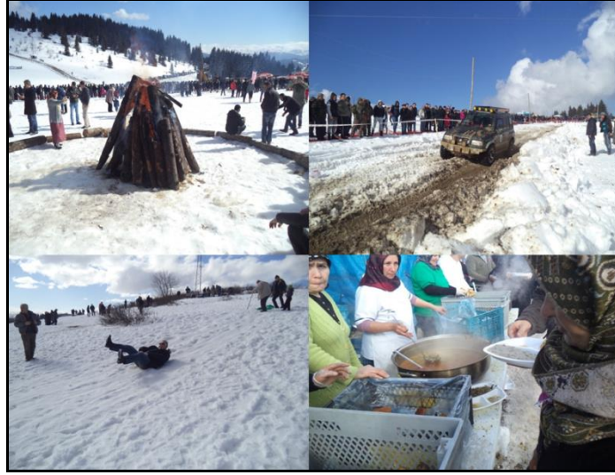
Fotoğraf 11. Kar festivalinde katılımcılar kayak keyfi yapmakta ve dağıtılan yöresel yemeklerden tadabilmekte, katılımcıların ısınması için ateş yakılmakta ve off road yarışları düzenlenmektedir (Fotoğraf: M. KILIÇ).

eğlenceli saatler geçiren katılımcılar, 20 dolayında özel jeep tipi aracın katıldığı off road yarışlarını da izleme şansını yakalamıştır ( http://www.giresun28haber.com/yavuzkernalde-kar-festivali-vardi.html-E.T:18.03.2015 ) (Fotoğraf 11).