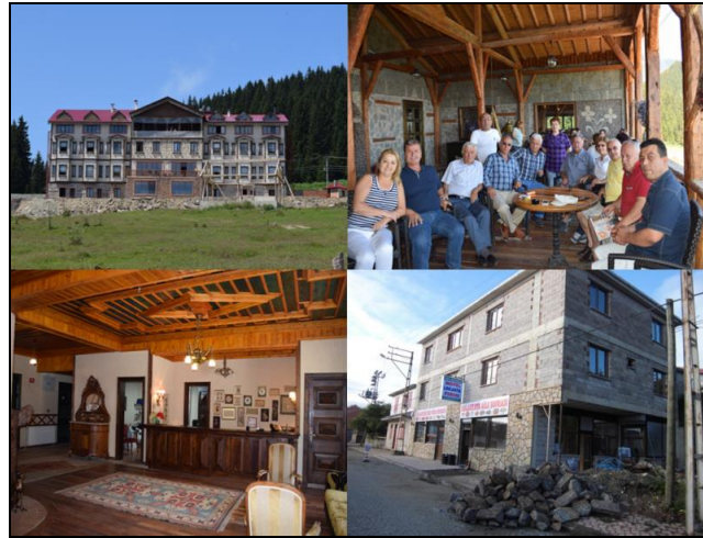
Fotoğraf 9. Kulakkaya yayla yerleşmesindeki konaklama tesislerinden görünüm.

Kulakkaya Yaylası’nda bir diğer turistik çekim unsuru, gerek yakın çevreden gerekse uzak mesafelerden insanların buraya akın etmesine ve kalabalık bir nüfusun kısa süreliğine de olsa toplanmasına yol açan, aynı zamanda yayla sahasının en önemli turistik