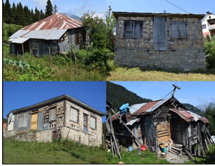
Fotoğraf 5. Kulakkaya yayla yerleşmesinde az sayıda da olsa varlığını sürdüren, ahşap ve taşın kullanıldığı geleneksel (ağaç karkas mesken) yayla evlerinden görünümeler.

Yayla ve yakın çevresindeki ekonomik faaliyetler, son dönemlerde değişikliğe uğramaktadır. Bektaş ve Kümbet yaylalarında olduğu gibi Kulakkaya Yaylası ve çevresindeki oba-yayla yerleşmelerinde bir yandan hayvancılık faaliyetlerinin yapıldığı ve çeşitli sebzelerin şenlik adı verilen evlerin etrafındaki bahçelerde yetiştirildiği, klasik anlamdaki yaylacılık faaliyeti sürdürülürken, son yıllarda tanınması ve artan sayıda ziyaretçinin de gelmeye başlamasıyla birlikte turizm ve rekreasyonel faaliyetler de gelişme göstermektedir. Nitekim yaylada konaklama tesislerinin inşa edilmesi ve günübirlikçiler için piknik alanların oluşturulması buna yönelik yatırımlardır. Buna ek olarak Giresun Orman İşletme Müdürlüğü'ne bağlı Kulakkaya Orman İşletme Şefliği'ne ait depolar ve işletme binaları da burada bulunmakta ve ormanlardan tomruk elde edilmektedir (Fotoğraf 6).