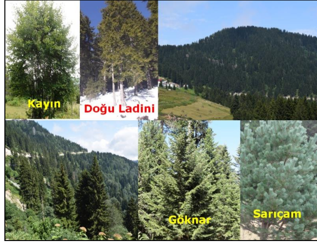
Fotoğraf 2. Kulakkaya Yaylası ve çevresinde doğu ladini ( Picea orientalis ) başta olmak üzere Doğu Karadeniz köknarları ( Abies nordmanniana ) ve sarıçamlar ( Pinus sylvestris ) ile orman altı florası olarak özellikle orman gülleri yayılış göstermektedir.

( Plantago lanceolata ), buğdaygiller ( Poaceae ), karanfilgiller ( Caryophyllaceae ), düğün çiçeği ( Ranunculus L. ), gül çiçeği ( Rosa L. ), kök boyası ( R. Tinctorum ), adi sıraca otu ( S. Nodosa ), sıyrırcık ( Daphne L. ), ısırgan ( Urtica L. ), mantar ( Fungi L. ), dağ mayası ( Ajuga Orientalis ), Meryem saçı ( Ajuga reptans ), su pençesi ( Alchemilla sintenisii ), hoş keçi sakalı ( Aruncus vulgaris ), dağlızca ( astrantia maxima subsp. Haradjianii ), koyungözü ( Bellis perennis ), bürük ( Calystegia silvatica ), yumurta kısıksı ( Crepis sancta subsp. obovate ), filiski ( Cyclamen parviflorum ), sırmağı ( Daphne pontica ), ayı mısırı ( digitalis ferruginea subsp. schischkinii ), güzel gözlük otu ( Euphrasia rostkoviana subsp. rostkoviana ), dağ çileği ( Fragaria vesca ), yapraklı yıldız ( Gagea foliosa ), sütlü güşad ( Gentiana asclepiadae ), Hemşin gentiyanı ( Gentiana verna subsp. Pontica ) gibi bitkilere rastlanmaktadır (Anonim, 2013b: 95-96; Giresun Orman İşletme Müdürlüğü verileri) (Fotoğraf 3).