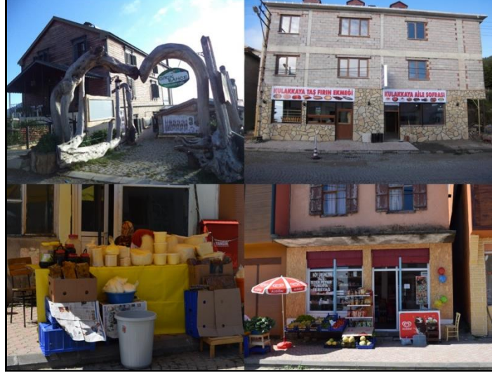
Fotoğraf 7. Kulakkaya yayla yerleşmesinde bireysel ihtiyaçların karşılanacağı fırın, lokanta ve restoranlar bulunmaktadır.

Kulakkaya Yaylası, Giresun'un en çok tanınan ve ziyaret edilen yaylalarından birisidir. Giresun şehir merkezinden Dereli ilçesine hareket eden araçlarla ulaşılan yayla sahası, her geçen yıl artan sayıda ziyaretçi tarafından ilgiyle gezilmektedir. Yol üzerinde bulunan Desput kayası ve suyu, doğal güzelliklere sahip Erimez mevki, Gelin Kayası ayrı birer ilgi odağıdır. Kulakkaya Alçakbel mevkiinde bulunan Orman içi Eğitim Tesisleri ve yakınındaki orman içi piknik alanında günübirlik rekreasyon imkanı bulunmakta, organize bir piknik sahası ve çocuk parkı mevcuttur (Fotoğraf 8). Ayrıca konuklar için Yavuzkema beldesinde de her türlü alışveriş hizmeti bulunmaktadır (Anonim, 2014: 52).