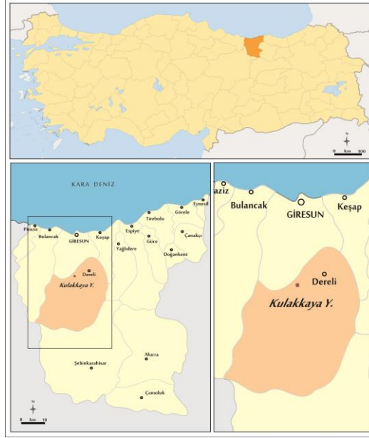
Harita 1. Kulakkaya Yaylası'nın Lokasyonu

Erimez Mevki üzerinden Kulakkaya Yaylası'na ulaşan güzergahtır. Bu yolun uzunluğu yaklaşık 47 km civarındadır. Bununla birlikte günümüzde bu güzergahın düzeltilmesi, genişletilmesi ve asfaltla kaplanması için çalışmalar devam etmektedir.