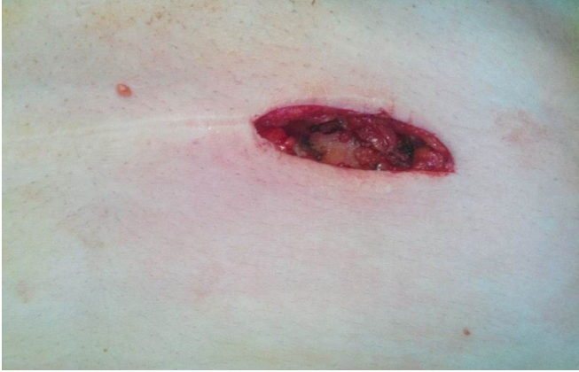
Şekil 1. İnsizyon hattında cilt altı yerleşim gösteren kitle