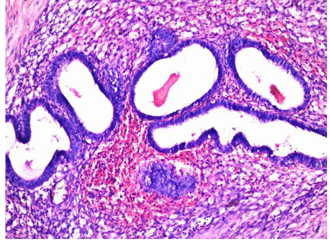
Şekil 3. Eksternal endometriozis patolojik görüntüsü H-E 40X

Nüks gelişebileceği için hastalar takip edilmelidir. Nüksler tekrar eksizyonla tedavi edilmelidir. İki yıllık takipte hastamızda nükse rastlamadık. Obstetrik ve jinekolojik operasyonlardan sonra kesi yerlerinde gelişebilecek