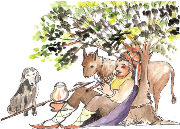
Şekil 2. Çobanın Eşyaları ve Yardımcıları

Çoban Kırklığı; Makastan daha kaba yün kırkmaya yarayan alettir. Adı; "Kırk kırk" sesinden gelir.