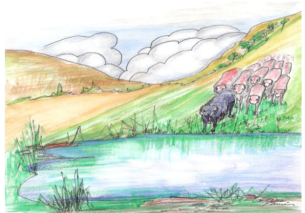
Şekil 3. Sürünün Sudan Geçmesi

Çoban Yardımcısı (davarı); genellikle bir çocuktur. Bu çocuk yardımcı, döl dökümü zamanında yeni dölleri köye götürür. Çobana haber götürür ve ondan haber getirir.