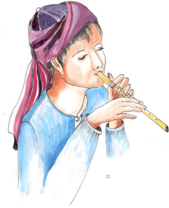
Şekil 4. Çoban ve Kavalı

Mengül; Köpeklerin boynuna takılan iğneli ve baklalı, oynayabilen demirdir. Boğuşan köpeklere takılır. Mengi (Bengi) demir demektir; sonsuzluk anlamı da vardır.