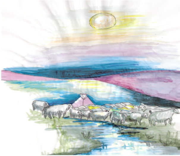
Şekil 5. Örüme Gelme

Yapağı; Bir koyundan çıkan yünü anlatır. Koyunun yünü bir bütün olarak kırılır. Post gibi çıkarılır. Türkçe sözlükte: İlbaharda kırılan koyunyünü olarak geçer.