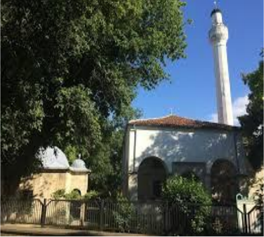
Pazvantođlu Osman Pařa Camii ( www.wikiwand.com.tr )