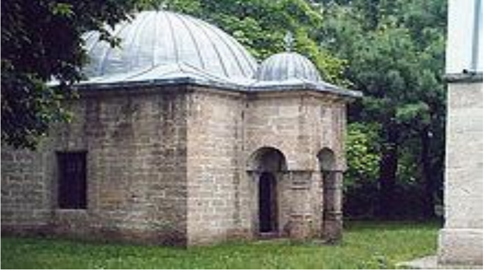
Pazvantođlu Osman Pařa Kütüphanesi