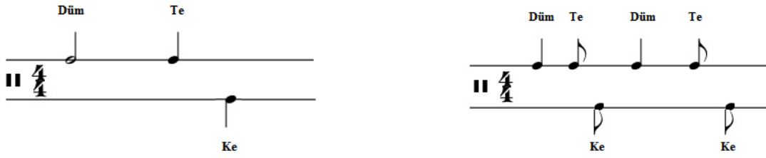
Şekil 2. Örnek 4/4'lük Usuller

Türkü üzerinde yapılan incelemelerde türkû notasının 2/4'lük olarak notaya aktarıldığı ancak türkû'nün genel karakteristiğinin 4/4'lük usul kalıbıyla uygunluk gösterdiği tespit edilmiştir. Ayrıca türkû'nün ses kayıtları ve notası üzerinde yapılan incelemelerde üçüncü ölçüden sonraki bir ölçünün notada yer almadığı (yazılmadığı) tespit edilmiştir. Bu durumun, özellikle bu türküyü daha önceden duymamış ve mevcut notaya sadık kalarak icra etmeye çalışan