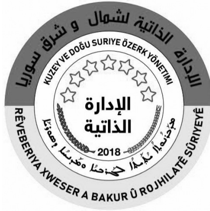
Ek-6: Dört dilde (Arapça, Kürtçe, Türkçe, Asurice) Özerklik Amblemi; El-İdâre'tül-Zâtiye / Özel İdare