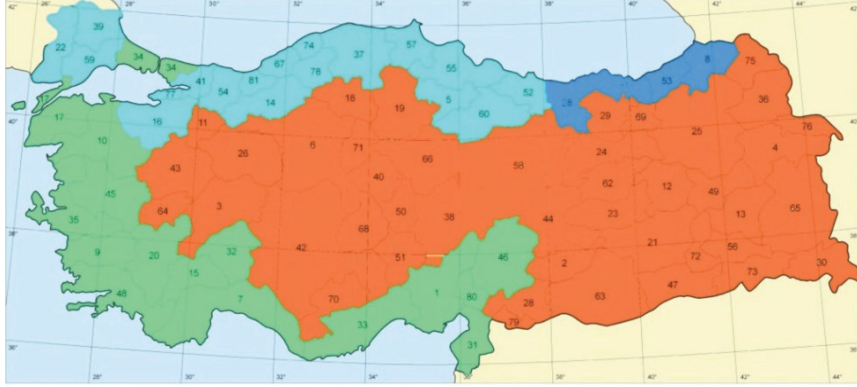
Şekil 1. Türkiye’de Fitocoğrafik Bölgeler

her üçü de farklı bölgelerimizde olmak kaydıyla görülür. Bu durum flora elemanlarını tekdüzelikten kurtarmaktadır (Şekil 1).