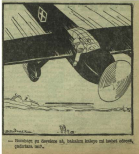
Görsel 5. Akşam , 24 Eylül 1940, s. 1.

“Mısır Yolunda” adlı karikatürün yayımlanmasından dört gün sonra İskenderiye ve Mersa Matruh'a yapılan ama çok da etkili olmayan İtalyan hava saldırılarını takiben Cemal Nadir, durumu Mısır çölü üzerine bombalar düşüren bir İtalyan uçağı resmettiği karikatürüyle okuyuculara sundu. 46 Sol alt köşesinde yıkık bir kale, sağ alt köşesinde bir grup çadır ve tam ortada yine iki tane birbirine bağlı devenin bulunduğu karikatürde, uçaktan aşağı sarkan ve eliyle develeri işaret eden bir pilot arkadaşına soru sorarken tasvir edilmektedir: “Bombayı şu develere at, bakalım kaleye mi isabet edecek, çadırlara mı?” (Görsel 4). İtalya’nın Mısır’a girer ırmez başlayan başarız askeri hamleleri bu ve benzeri görsellerle yoluyla kamuoyuna sürekli hatırlatılmıştır.