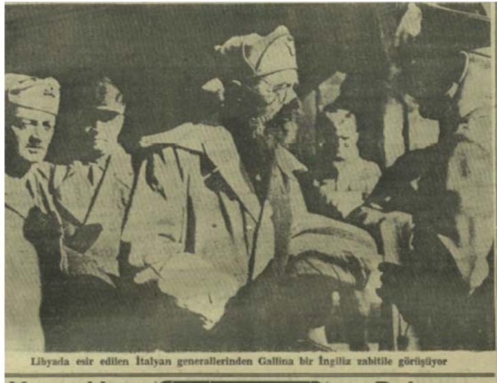
Görsel 2. Akşam , 13 Ocak 1941, s. 1

gazetelerin ilk sayfalarında sıklıkla ve yanyana kullanıldı. İtalyanlar’ın Mısır’daki varlığının ilk günlerinde gazetelerin birinci sayfalarında verilen haberlerde, Sollum ve Sidi Barrani’nin işgalinden kısa bir süre öncesi ve sonrasında, İtalyan ve İngiliz generallerinin fotoğrafları ve/veya elle çizilmiş portrelerine Kuzey Afrika’ya ait haritalar ve Süveyş Kanalı’nın birkaç fotoğrafı eşlik etti. İngiliz kuvvetlerinin askeri ve teknolojik üstünlüğünü vurgulamak için Cumhuriyet , sıklıkla Afrika kıyılarına yaklaşan İngiliz gemilerinin fotoğraflarını kullandı. Ocak ve Şubat 1941 tarihine gelindiğinde, teslim olan İtalyan subay ve askerlerinin fotoğrafları en çok kullanılan resimler arasındaydı (Görsel 2). İngiliz ordusuna bağlı farklı milletlerden gelen askerlerin günlük yaşam faaliyetlerini gösteren fotoğraflar da savaşla ilgili görseller arasında yer aldı. İtalyan yenilgisinden sonra Kuzey Afrika’daki terk edilmiş İtalyan şehirleri ve yapılarının fotoğrafları da çoğunlukla gazetelerin ilk sayfalarında okuyucularla buluştu.