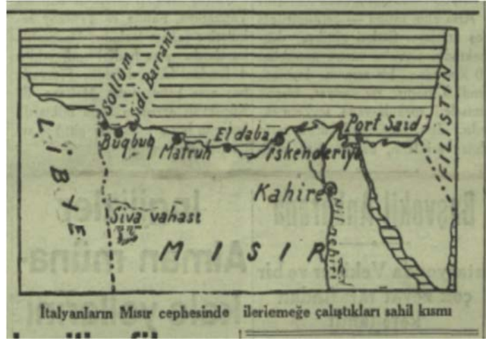
Görsel 1. Akşam , 21 Eylül 1940, s. 1

İtalya'nın Mısır'daki askeri hareketinin nihai amacı Libya'dan sonra kanalın kontrolünü ele geçirmek ve Doğu Akdeniz'de İtalyan hakimiyeti kurmaktı. Bu durum, neticede Türkiye'nin milli güvenliğini tehlikeye sokabilirdi. Bu doğrultuda gazeteler, Balkanlar ve Ege Denizi'ndeki İtalyan askeri varlığının bir sonucu olarak ortaya çıkmış olan tehditlerin yanı sıra, Kuzey Afrika'dan gelebilecek bu yeni tehlikeyi de sıklıkla vurguladı. Ayrıca, kendi topraklarında Almanlar'a karşı vermekte oldukları zorlu mücadeleye rağmen İngilizler'in Mısır ve Libya'da elde etmeyi başardığı üstünlüğe değinmeyi de ihmal etmedi.