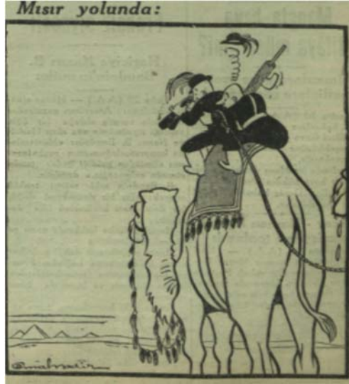
Görsel 3. Akşam , 21 Eylül 1940, s. 1.

Cemal Nadir Güler'in (1902-1947) Akşam gazetesi için İkinci Dünya Savaşı sırasında çizdiği karikatürler, bu kapsamda verilebilecek en iyi örnekler arasında yer almaktadır. Türkiye'de erken Cumhuriyet döneminin önde gelen ve en yetenekli karikatüristlerinden biri olan Güler, kariyerine sanat öğretmeni ve tabela ressamı olarak başladı ve 1929 yılından itibaren Akşam gazetesi için karikatürler hazırladı. “[D]önemin siyasi atmosferini içeren çizgilerini başarıyla yansıtan ve Amcabey ve Dalkavuk tiplemesine de sanatında hayli yer ver[en]” 44 Cemal Nadir, 21 Eylül 1940 tarihinde Akşam gazetesinin ilk sayfasının sağ alt köşesinde yayımlanan ve işgalin yakın zamanda İtalya için beklenen olumsuz sonuçlarına nükteli bir dille atıfta bulunan “Mısır Yolunda” adlı karikatüründe, çölün ortasında bir devenin üzerinde yol alan ve ufukta sadece dört piramit görebilen iki İtalyan nişancı askerini betimledi. 45 Karikatürde arka tarafta oturan ve hissettiği korku ve şaşkınlık yüzünden tüylü şapkası başından fırlamış olan asker, diğer arkadaşına “Ufkumuzda neler var?” diye sormaktadır. Dürbünle ufuğa bakan arkadaşının verdiği cevap ise: “Bir sürü mezar!”dır (Görsel 3). Aynı yüz hatlarına ve benzer traşlı kafalara sahip oldukları için birbirlerinden ayırt edilmeleri neredeyse imkansız olan bu iki adamın hemen arkasında, çöldeki sert iklim koşullarını okuyuculara hatırlatan susuz kalmış bir deve durmaktadır.