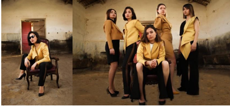
5b: Tasarım: Ecem Akkabak / Tema: Maskülenliğin Femeninliğe Dönüşümü / Mekân: Yeni Sofça Köyü At Çiftliği

Fotoğraf 5. Tasarım: Ecem Akkabak / Tema: Maskülenliğin Femeninliğe Dönüşümü