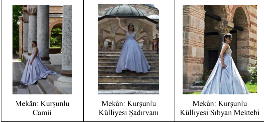
Mekân: Kurşunlu Camii

Moda Fotoğrafında, mekânın eski ve atıl durumda oluşuyla, tasarımın yeni ve dimdik ayakta olması durumu arasındaki zıtlık kullanılarak tasarımın öne çıkması amaçlanmış olabileceği düşünülmektedir. Bu zıtlığın, etkiyi artırmak ve ilgi uyandırmanın bir yolu olduğu söylenebilir.