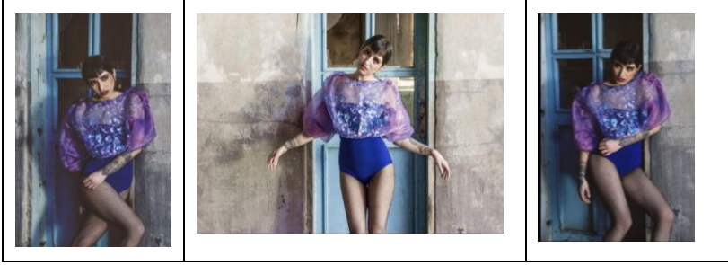
Fotoğraf 1: Tasarım: Ayça Aybacı / Tema: Milenyum Uzay / Mekân: Eskişehir Eski TCDD Lojman

Moda fotoğraflarında kullanılan mekânların yapılarına bakıldığında; Tülomsaş, 1894 yılında Anadolu-Osmanlı Kumpanyası adı ile Almanlar tarafından kurulmuştur. (Tülomsaş Tarihçe, 2020). Eskişehir CER Atölyesi’nin yapımına ise, temel ihtiyaçları karşılayacak atölyelerin inşaatı ile başlanmış, zamanla ihtiyaca göre yeni birimlerin eklenmesi ile büyüyen gelişmiştir (Ünal M., 2009:20). Ancak yapıların büyük bir kısmı hızlı trenin çalışmaya başlaması nedeniyle artık kullanılmamakta ve metruk durumdadırlar (“Arkitera, Eskişehir Demiryolu Binaları”, 2020).