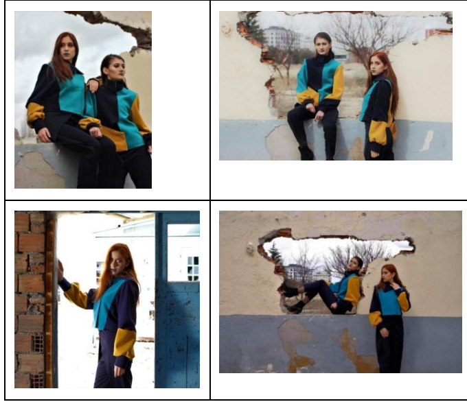
Fotoğraf 9: Tasarım: İpek Meltem Gürsoy tema: Yin- yang Mekân: TCDD Binası

Fotoğraf 9’da tasarımcı İpek Meltem Gürsoy’un mezuniyet projesi tasarımları gösterilmektedir. Tasarımcı teması ‘Yin-Yang’ olup, mekân olarak Eski TCDD binasını seçmiştir. Tasarımdaki mavi rengin mekândaki mavi boya ile moda fotoğrafına farklılık kattığı söylenebilir. Aynı zamanda yıkılan duvar önünde çekimi yapılan tasarımlar, arka planda canlılığını koruyan gökyüzü ve peyzaj görüntüleri ile zıtlık yaratmıştır.