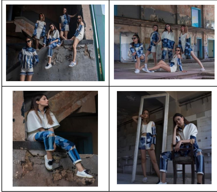
Fotoğraf 6: Tasarım: Eda Uslu / Tema: Kentsel Dönüşüm /Mekân: Eskişehir, Eski TCDD Lokomotif Bakım Atölyesi

Fotoğraf 5b’de ise Yeni Sofça Köyü At Çiftliği kullanılmıştır. Fotoğraf 5a’da dış mekân çekimi yapan tasarımcı, Fotoğraf 5b’de iç mekân çekimi gerçekleştirmiştir. At çiftliğinde duvar ve zemin renklerinden yararlanılarak moda fotoğrafı kompozisyonu oluşturulmuştur. Mekânın açık renk üst duvarları ve koyu renk olan alt duvar ve zeminlerinin, tasarımdaki üst giysilerin açık renk olması alt giysi parçalarının ise koyu renk olmasıyla ahenkli durumu moda fotoğrafına yansımıştır. Aynı zamanda fotoğrafta kullanılan koltuk aksesuarının, temayla ilişkili olarak seçildiği düşünülmektedir. Moda fotoğrafında mekânın eski ve kirli yapısı karşısında tasarımın yeniliği ve kadına güç katması ilişkilendirilmek istenmiştir denilebilir.