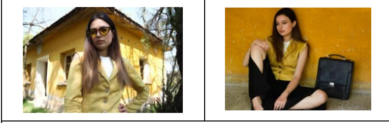
5a: Tasarım: Ecem Akkabak / Tema: Maskülenliğin Femeninliğe Dönüşümü / Mekân: Eskişehir, Odunpazarı, Yeni Sofça Köyü Okul Binası

bulunmaktadır ve Arasta Çarşısı'ndaki çeşme de onun birebir kopyasıdır. ("Kırım Üzerine Notlar 1", 2020)