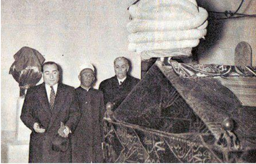
Adnan Menderes Turgut Reis'in mezarını ziyaret ederken 30

30 Ocak 1957 günü Başbakan Adnan Menderes, beraberindeki tüm Türk heyeti ve gazeteciler ile birlikte Trablusgarp'ta bulunan Turgut Reis Türbesi'ni ziyaret etmiştir. Trablusgarp bölgesi Osmanlı döneminde büyük Türk kalyonlarının hareket üslerinden biri olarak da bilinmektedir. Başbakan ve maiyeti Turgut Reis'in yanı sıra o bölgede defnedilmiş olan diğer leventlerin de mezarlarını ziyaret etmiştir.