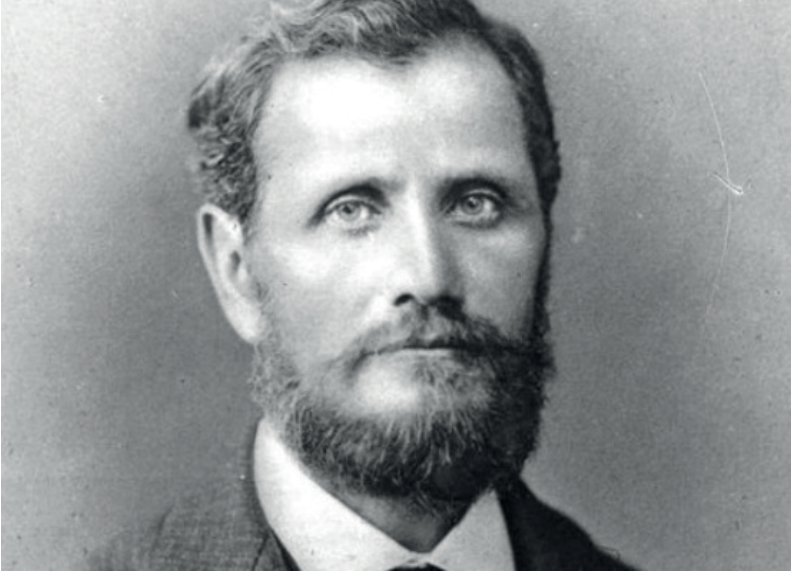
Resim 3 Ressam Stanislaw Chlebowski

Sarayda çalışan resamlara, bakır üzerine bazı padişahların portreleri de yaptırılmıştır. Osman Gazi'den II. Mahmud'a kadar Osmanlı sultanlarının nuhâs (bakır) üzerine yapılmış portreleri Serkurena Nuri Paşa'nın emriyle Hazine-i Hümâyûn'dan çıkartılarak Mabeyn-i Hümâyûn'a takdim edildikten sonra, Kapı Çuhadarı Nuri Bey vasıtasıyla Hazine-i Hümâyûn'a konulmuştur (5 Şubat 1873) 24 .