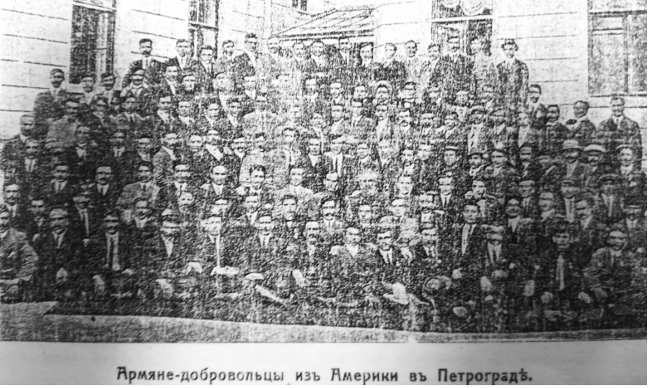
Армяне-добровольцы из Америки въ Петроградѣ.