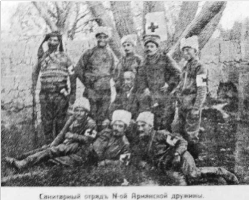
Санитарный отрядъ N-ой Армянской дружины.