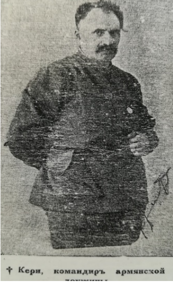
Resim 3: Keri

( Armyanskiy Vestnik , No: 19, 1916 s.3)