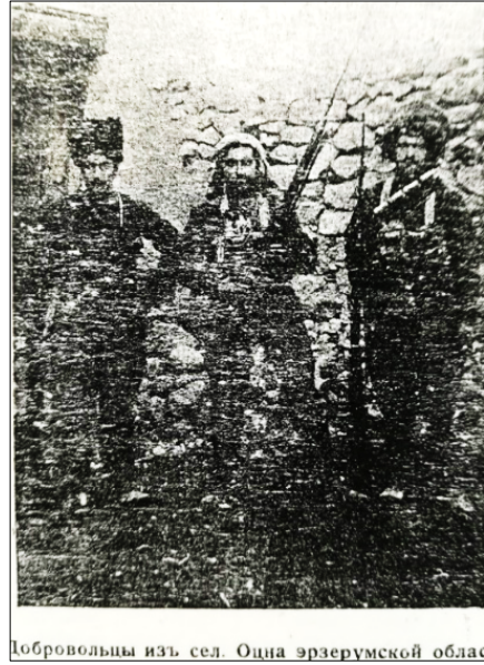
Resim 2: Erzurum Bölgesinde Ermeni Gönüllüler (Armyanskiy Vestnik, No: 18, 1916, s.5)