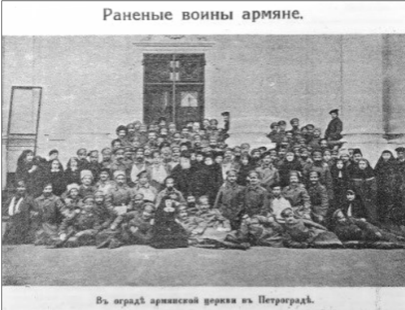
Resim 8: Savaşta Yaralanmış Ermeniler ( Armyanskiy Vestnik , No: 30, 1916, kapak)