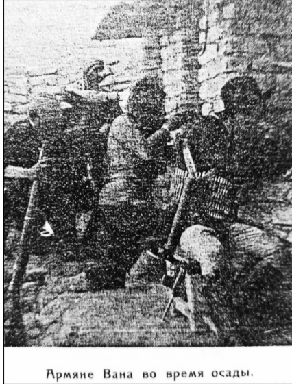
Resim 15: Van Ermenileri Kuşatmada ( Armyane i Voyna , No: 2-3, 1916, s. 41.)