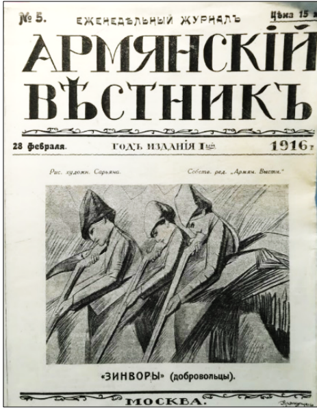
Resim 1: Armyanskiy Vestnik dergisinin Kapakı “Zinvorı” (Gönüllüler) (Armyanskiy Vestnik, No: 5, 1916, Kapak)

Rus Ermeni basınında basılan resimler de bir savaş propagandası olarak görülebilir. Değerlendirdiğimiz Ermeni basın örneklerinde hemen hemen her sayıda Ermeni Gönüllülere katılanlar, Ermeni gönüllüleri, Ermeni gönüllü birlikleri komutanları, Rus ordusunda görev yapan Ermeni subaylar, Ermeni isyan bölgelerinden gönderilen savaş resimleri gibi birçok resim yayımlanmaktaydı. Bu tür resimlere örnekler aşağıda verilmiştir: