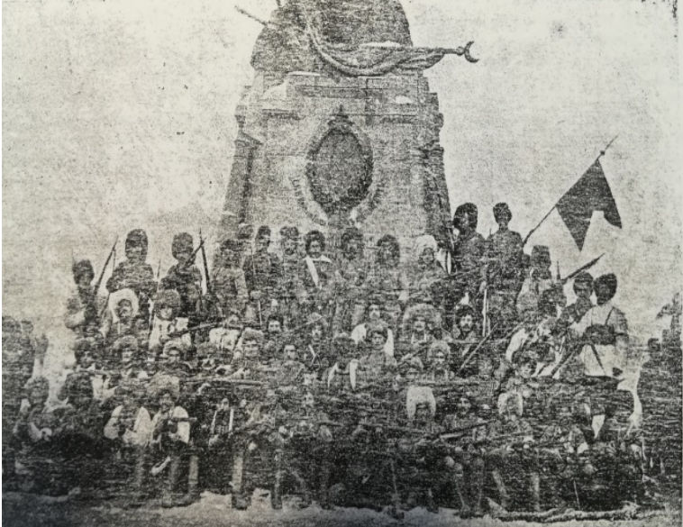
Resim 5: Keri'nin başında Olduğu Ermeni Gönüllü Birliği

(Resmin Altında Van savunmasının Kahramanı yazıyor) ( Armyanskiy Vestnik , No:19, 1916, s.3)