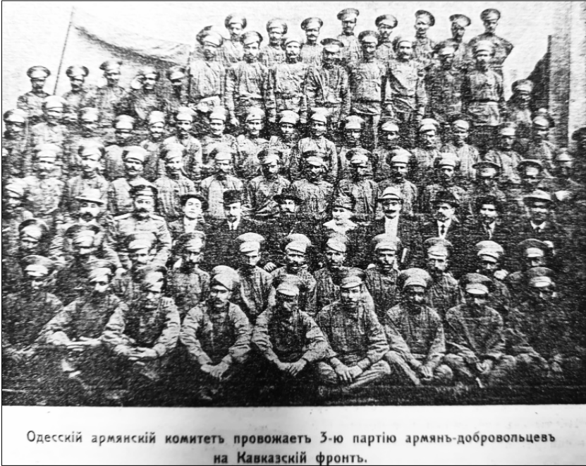
Resim 16: Odessa Ermeni Komitesinin Kafkas cephesine gönderdiği 3. Parti Ermeni Gönüllüleri ( Armyane i Voyna , No: 8, 1916, s. 119.)