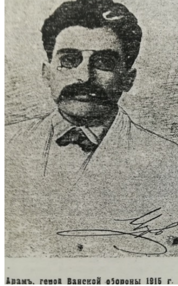
Resim 4: Van İsyanının Başında bulunan Aram

( Armyanskiy Vestnik , No: 19, 1916 s.3)