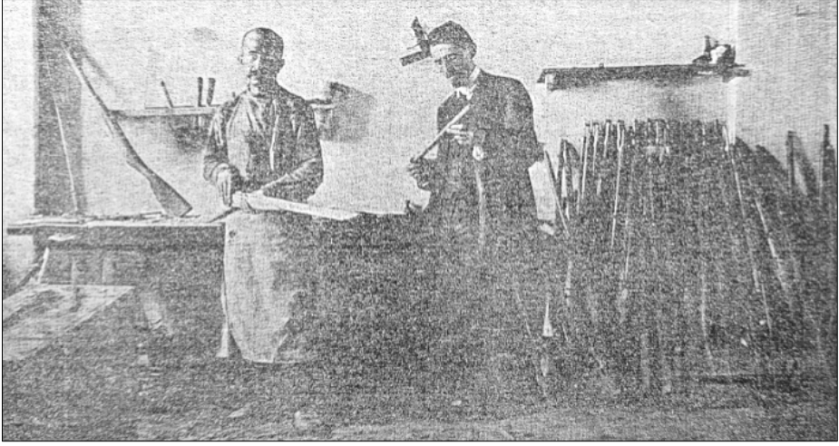
Resim 11: Ermeni Gönüllü birliğinin silah atölyesi ( Armyanskiy Vestnik , No: 10-11, 1917, s. 12)