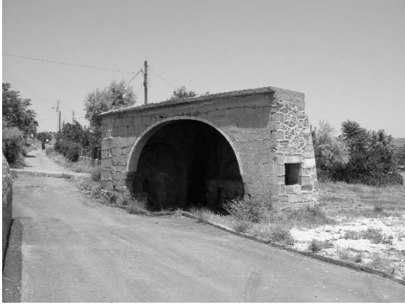
Resim 29- Harput Meydan Çesmesi.

rüyü bugün görmek mümkün olmamaktadır. Tescil fişindeki fotoğraftan tek kemer gözlü olduğu anlaşılan köprünün inşaa malzemesi kabayonu taş ve tuğladır. Köprünün, üzerindeki tabakanın kaldırılması suretiyle ortaya çıkarılması gerekmektedir.