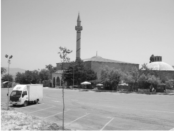
Resim 5-Harput Sara Hatun Camii'nin kuzeybatıdan genel görünüşü.

birim birer kubbeyle örtülmüştür. Harime kuzey duvarının ortasındaki dilimli kemerli açıklıktan girilmektedir. Harim, ortada dört sütunla taşınan bir kubbeyle, köşelerde çapraz tonozlarla, yanlarda ise beşik tonozlarla örtülüdür. Mihrap, çeyrek küre şekilli kavsarayla örtülü, yarım daire kesitli bir nişe sahiptir. İ. Sunguroğlu, Sara Hatun Camii'nin bir tarafında muvakkithane, bir diğer tarafında ise çeşme ve medresesinin bulunduğunu söylemektedir. Muvakkithane günümüze ulaşmamıştır. Çeşme, yapının kuzeydoğu köşesinde halen ayakta. Yapının doğusunda küçük tonozlu birimlerden oluşan bir yapı kalıntısı