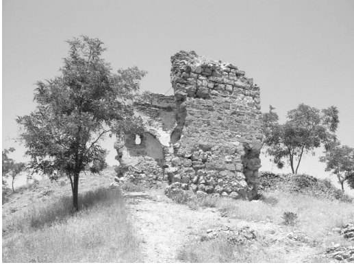
Resim 14-Harput Dabakhane Mescidi'nin güneyden genel görünüşü.

planlı bir yapı olduğu anlaşılmaktadır. Kubbe geçişleri tromplarla sağlanmıştır. Giriş açıklığına ait herhangi bir iz yoktur. Mihrap nişinin sadece doğu köşesine ait bir bölümü algılanabilmektedir. İçte duvarlar, sivri kemerli çökertmelerle hareketlendirilmiştir. Plan şeması ve örtüye ilişkin yeterli veri bulunmasına karşın, batı duvarı tamamen yıkılmış, kuzey cephesinde olması muhtemel girişten hiçbir iz kalmamıştır. Dolayısıyla yapının restitüsyonu güçtür. Konservasyon ve konsolidasyon çalışmaları yapılarak mevcut haliyle korunması gerekmektedir.