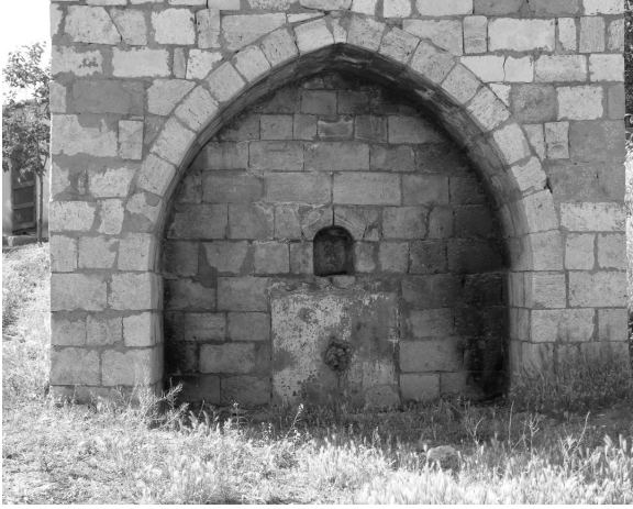
Resim 30- Harput Alaeddin Bey Çesmesi.

Çok sayıda uygarlığa ev sahipliği yapan, XIX. yüzyıl sonlarında 20 bine yakın nüfusla büyük bir kent niteliği taşıyan Harput'tan geriye kalanlar, ne yazık ki bunlardan ibarettir. Günümüze ulaşabilen yapıların neredeyse tümü, ya çeşitli müdahalelerle özgünlüğünü yitirmiş ya da bakımsız, harap ve ilgiye muhtaç durumdadırlar. Bazı yapıların özgün şekillerine ilişkin veri kalmamış olsa da, bir çok yapının kazı ve temizlik çalışmaları sonrasında hazırlanacak restitüsyon ve restorasyon projeleri ile ayağa kaldırılması mümkündür.