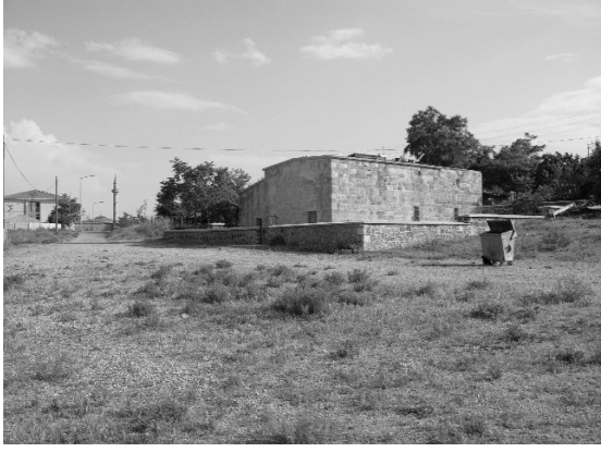
Resim 18- Harput Ahi Musa Mescit-Türbesi. Kuzeydoğudan genel görünüş.

kaplanmıştır. Onarımında mescit kısmının plan şemasına kısmen de olsa bağlı kalındığı, ancak türbe kısmında önemli değişiklikler yapıldığı anlaşılmaktadır. 1985 yılına ait rö-löve ve fotoğraflarda, türbenin batısında bir mekanın daha bulunduğu anlaşılmamasına karşın, onarımında yok edilmiştir. Kentin kuzeyinde, olasılıkla bir zaviye kapsamında yer alan