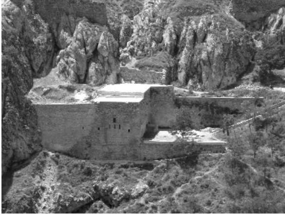
Resim 20-Harput Meryem Ana Kilisesi. Doğudan genel görünüş.

miş 3 kilise bulunmaktadır. İç Kale'nin doğu yamacına yaslanmış durumdaki Meryem Ana Kilisesi , Süryanilerin yaşadığı Norsis Mahallesi'ndeydi 42 . Yakubi ve Süryani Kilisesi gibi adlarla da bilinen yapı, kesme taş, kabayonu taş ve moloz taşlarla inşa edilmiştir (Resim 20). İ. Sunguroğlu tarafından yanlış okunan bir kitabe nedeniyle M.S. 179 yılına tarihlenen yapı, E. Danık tarafından Bizans dönemine, M.S. VI. yüzyıla tarihlendirilmektedir. 1179 yılında Artuklu Sultanı Fahreddin Karaarslan döneminde onarıldığı bilinen yapı, doğu-batı yönlü tek nefli bir bazilikadır. Naos, bema ve pastaforium hücreleri ayakta olan yapının kuzeye doğru devam eden, narteks mekanı günümüze ulaşmamıştır. Ancak yapının kuzeybatısında nartekse ait olması muhtemel tonoz izleri halen mevcuttur. Yapının yakın tarihlerde geçirdiği kötü bir onarım sonucunda üzeri betonla kaplanmıştır. Ayrıca kuzey cephesinin batı kesiminde yer alan giriş açıklığı, betonarme bir geçiş mekanıyla kapatılmıştır. Harput'ta günümüze ulaşabilen kısmen sağlam tek kilise konumundaki Meryem Ana Kilisesi'nin bu olumsuz ek ve kötü onarım izlerinden arındırılarak korunması gerekmektedir.