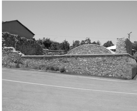
Resim 13- Harput Meydan Camii'nin güneyden genel görünüşü.

Kent merkezinde Sara Hatun Camii ve Cemşit Bey Hammamı'nın kuzeyinde yer alan Meydan Camii, çeşitli müdahalelerle özgünlüğünü büyük ölçüde yitirmiştir (Resim13) 32 . Örtüsü ve duvarları büyük ölçüde yıkılmış olan yapının batı duvarında kalan izlerden, enine sahnınlardan oluşan bir harime sahip olduğu anlaşılmaktadır.