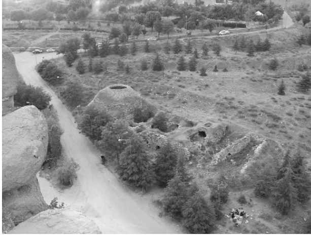
Resim 24- Harput Kale Hamamı'nın güneydoğudan genel görünüs.

Harput adeta bir çeşmeler diyarıdır. Bugün planlama alanında günümüze gelebilmiş 8 çeşme bulunmaktadır. Üç Lüleli Çeşme (Resim 28) ile Ulu Cami Çeşmesi'nin bakımlı ve sağlam durumda olmasına karşılık, Meydan Çeşmesi (Resim 29), Kurşunlu Cami Çeşmesi, Yarı Çavuş Çeşmesi ve Zeynep Çeşmesi çeşitli müdahalelerle özgünlüklerini yitirmişlerdir. Sara Hatun Çeşmesi, bakımsız ve harap durumdadır. Aladdin Bey Çeşmesi, yol yapım çalışmaları sırasında Hoca Hamamı'nın yanından taşınarak Ağa Camii'nin kuzeybatısına yeniden inşa edilmiştir (Resim 30). Planlama alanında kalan bu çeşmelerin yanı sıra, kentin çevresinde de çok sayıda çeşme bulunmaktadır. Koruma Amaçlı İmar Planı çalışmaları çerçevesinde bu çeşmeler tek tek tespit edilmiş ve tescile önerilmiştir.