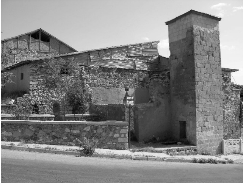
Resim 11- Harput Ahmet Bey Camii'nin kuzeyden görünüşü.

girişinde yer alan Ahmet Bey Camii 30 , bugün harap durumdadır. Adına 1523 tahririnde rastlanmazken ilk kez 1566 tahririnde rastlanan Ahmed Bey Mahallesi'nin bu cami çevresinde geliştiğini; dolayısıyla yapının bu tarihten bir süre öncesinde inşa edildiğini kabul etmek mümkündür. Kuzey cephesinin batı kesimindeki kare kesitli minare yapıyla çağdaş değildir (Resim 11). Yapı moloz taşlarla, minare ise düzgün kesme taşlarla inşa edilmiştir. Minarenin doğu yüzündeki giriş açıklığı ve basamakları sağlamdır. Gövde ve külah kısımları yıkılmıştır. Cami, uzunlamasına dikdörtgen planlı bir harim ve doğusunda yer alan sonradan hazireye dönüştürülmüş son cemaat yerinden oluşmaktadır. Harimin doğu ve batı duvarları üzerinde karşılıklı ikişer destek mevcuttur. İ. Sunguroğlu, yapının tonozla örtülü olduğunu ifade etmektedir. Dolayısıyla duvarlara bitişik destekleri, harimi örten tonozun destek kemerlerinin ayakları olarak kabul etmek mümkündür. Yapının en özgün unsuru, mihrabıdır. Kesme taşlarla inşa edilen mihrap, yarım daire kesitli bir nişe sahiptir. Niş, üç sıra mukarnasla bezeli bir kavsarayla örtülmüştür.