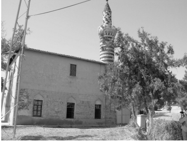
Resim 7-Harput Alacalı Mescit. Kuzey cephesi.

Mescit 'tir (Resim 7). Son Artuklu sultanlarından Nureddin Artuk Şah'ın oğlu Hızır Şah tarafından 1203-4 yılında inşa edildiği kabul edilen mescit, günümüzdeki şeklini XIX. yüz-