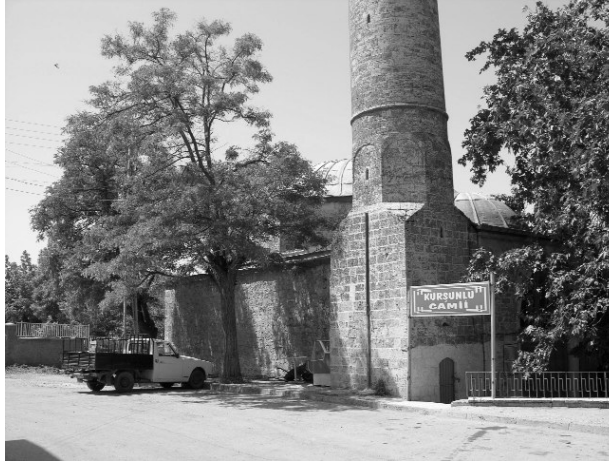
Resim 8-Harput Kurşunlu Cami. Kuzeydoğudan görünüşü.

Hoca Hamamı'nın doğusunda yer alan Kurşunlu Cami (1738-39) 28 Harput'ta gün-