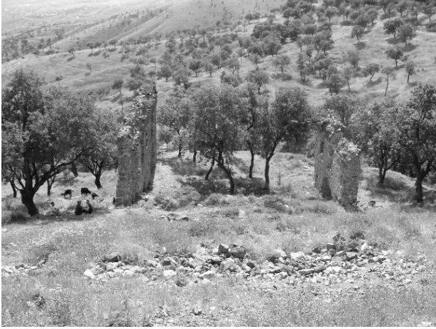
Resim 22- Harput Surp Agop Kilisesi. Doğudan genel görünüşü.

Harput'ta günümüze gelebilmiş 5 hamam vardır. Cemşit Bey Hamamı (Resim 23) 45 , Kale Hamamı (Resim 24) 46 , Yeni Hamam (Resim 25) 47 ve Hoca Hamamı (Resim 26) 48 , Anadolu Selçuklu döneminden Osmanlı döneminin sonuna dek pek çok Türk hamamında rastlanan “haçvari dört eyvanlı, köşe hücreli” birer sıcaklık mekanına sahip hamamlardandır.