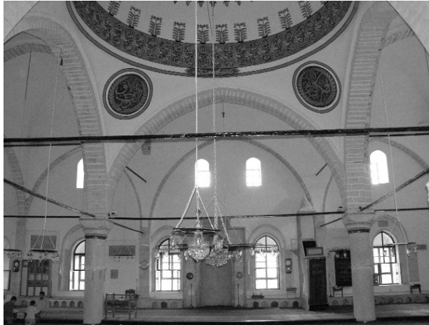
Resim 6-Harput Sara Hatun Camii. Harimden.

birim birer kubbeyle örtülmüştür. Harime kuzey duvarının ortasındaki dilimli kemerli açıklıktan girilmektedir. Harim, ortada dört sütunla taşınan bir kubbeyle, köşelerde çapraz tonozlarla, yanlarda ise beşik tonozlarla örtülüdür. Mihrap, çeyrek küre şekilli kavsarayla örtülü, yarım daire kesitli bir nişe sahiptir. İ. Sunguroğlu, Sara Hatun Camii'nin bir tarafında muvakkithane, bir diğer tarafında ise çeşme ve medresesinin bulunduğunu söylemektedir. Muvakkithane günümüze ulaşmamıştır. Çeşme, yapının kuzeydoğu köşesinde halen ayakta. Yapının doğusunda küçük tonozlu birimlerden oluşan bir yapı kalıntısı