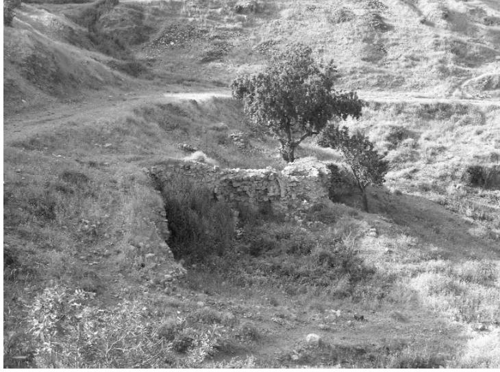
Resim 25- Harput Yeni Hamam. Güneyden genel görünüş.