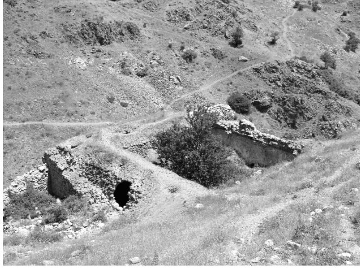
Resim 27- Harput Kızıl Hamam. Doğudan genel görünüş.