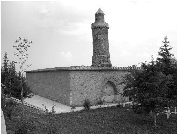
Resim 3- Harput Ulu Camii'nin kuzeybatıdan genel görünüşü.

Harput'ta günümüze ulaşabilmiş 9 cami ve mescit bulunmaktadır. Kentteki en erken tarihli cami, Fahrettin Karaaslan tarafından 1146-1156 yılları arasında inşa ettirildiği