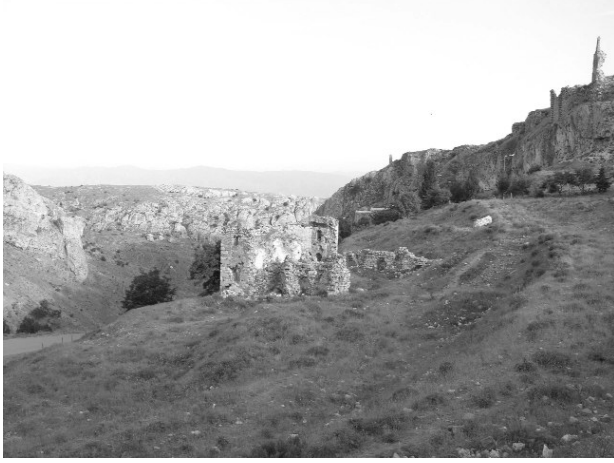
Resim 21-Kızıl Kilise. Kuzeybatıdan genel görünüşü.

günümüzde metruk ve bakımsız durumda bulunan yapı, konservasyon ve konsolidasyon çalışmaları ile koruma altına alınmalıdır.