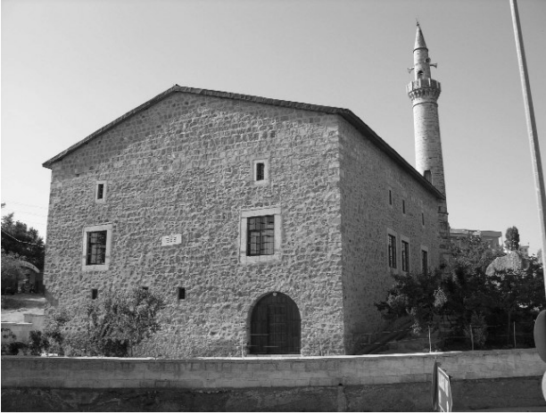
Resim 10- Harput Ağa Camii'nin güneydoğudan genel görünüşü.

Harput'taki bir diğer cami, Dağ Kapı yakınlarında, Murat Baba Türbesi'nin kuzeyinde yer alan ve Pervane Camii adıyla da bilinen Ağa Camii 'dir 29 . Harput Müzesi'ndeki kitabesinden 1559 yılında Pervane Ağa tarafından inşa ettirildiği öğrenilen yapının ilk in-