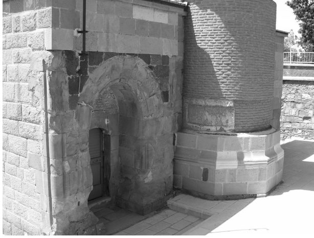
Resim 16- Harput Arap Baba Mescit-Türbesi. Kuzey cephesi.

678/1279-80 yılında, Selçuklu sultanı III. Gıyaseddin Keyhusrev döneminde Yusuf bin Arapşah bin Şaban tarafından inşa ettirildiği anlaşılmaktadır. Doğuda yer alan kare planlı ve kubbeye örtülü bir mescit ile batıda yer alan sivri tonozla örtülü türbeden oluşmaktadır (Resim 16,17). Türbe uzunlamasına dikdörtgen planlı ve aynalı tonozla örtülü bir mummyalık katı üzerinde yükselmektedir. Mescide, kuzey cephesinin doğu köşesindeki taçkapıdan girilmektedir. Taçkapının batısında