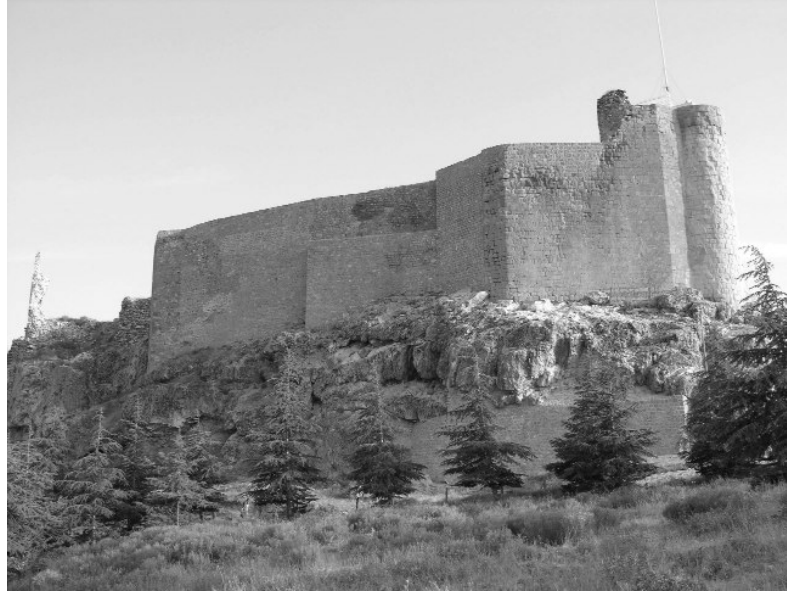
Resim 2- Harput İç Kale'nin kuzeydoğudan görünüşü.