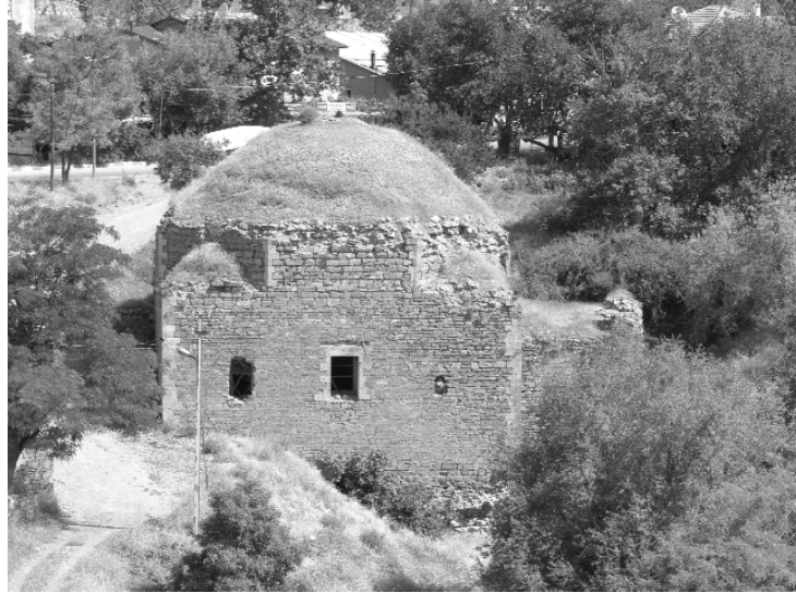
Resim 26- Harput Hoca Hamamı. güneyden genel görünüş.