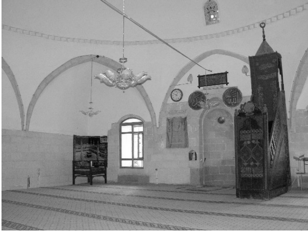
Resim 9- Harput Kursunlu Cami. Harimden.

anıldığı ve çevresinde çok sayıda medrese ve han bulunduğu öğrenilmektedir. Harput Hükümet Konağı'nın da Kurşunlu Cami'nin hemen güneyinde yer aldığı; 1930'lu yıllarda sağlam olan yapının, geçirdiği bir yangın sonrasında yıkıldığı bilinmektedir. Hükümet Konağı'nın zemin kat duvarlarının bir bölümü, bugün halen bu alanda yer alan Ekrem Özel İlköğretim Okulu'nun bahçe duvarlarının altında görülebilmektedir.