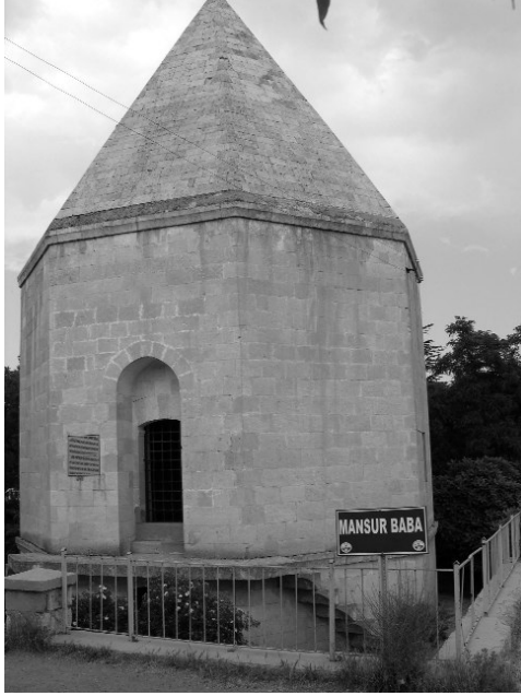
Resim 19-Harput Mansur Baba Türbesi. Giriş cephesi.

kaplanmıştır. Onarımında mescit kısmının plan şemasına kısmen de olsa bağlı kalındığı, ancak türbe kısmında önemli değişiklikler yapıldığı anlaşılmaktadır. 1985 yılına ait rö-löve ve fotoğraflarda, türbenin batısında bir mekanın daha bulunduğu anlaşılmamasına karşın, onarımında yok edilmiştir. Kentin kuzeyinde, olasılıkla bir zaviye kapsamında yer alan