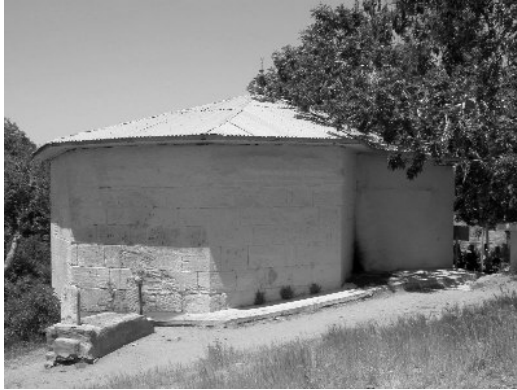
Resim 15-Harput Fatih Ahmet Baba Mescit-Türbesi. Doğu cephesi.

Harput'ta cami ve mescitlerin yanı sıra çok sayıda mescit-türbe ve türbe de bulunmaktadır. Kentin yaklaşık 2km doğusunda yer alan Fatih Ahmet Baba Mescit-Türbesi , sekizgen planlı bir türbe ile batısındaki uzunlamasına dikdörtgen planlı mescitten oluşmaktadır (Resim 15) 34 . Türbenin sadece alt katı günümüze ulaşmış, gövde ve yukarısı yıkılmış, üzeri basık bir kubbeyle örtülmüştür. Mescit, türbeye sonradan eklenmiştir. Türbe