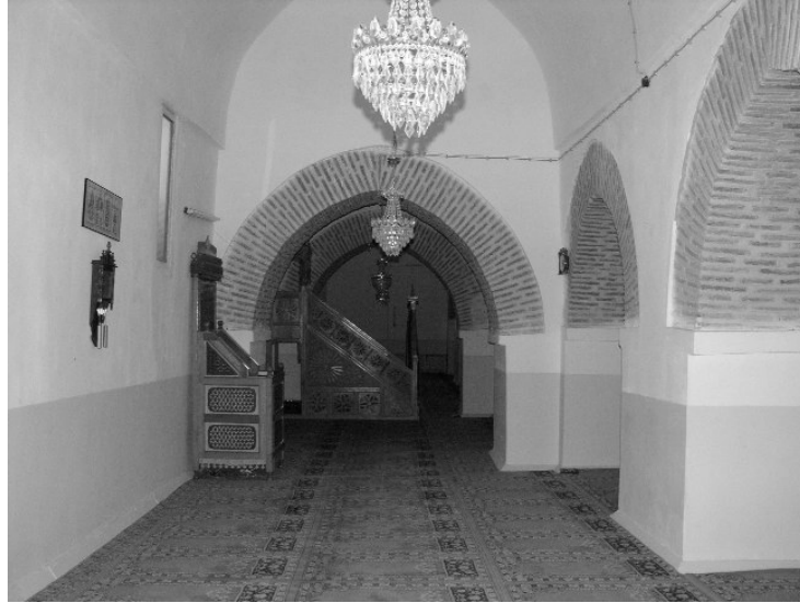
Resim 4- Harput Ulu Cami. Harimden.

Kent merkezinde, Cemşit Bey Hamamı'nın doğusunda, Meydan Camii ve Çeşmesi'nin kuzeybatısında yer alan Sara Hatun Camii de Ulu Cami gibi geçmişten günü-