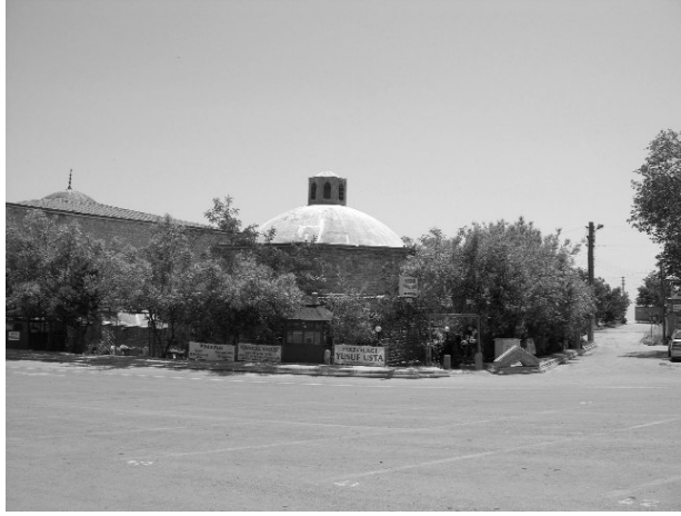
Resim 23-Harput Cemşit Bey Hamamı. Kuzeyden genel görünüs.

derzlerin özgün şekline dönüştürülmesi gerekmektedir. Diğer 4 hamam, bakımsız ve haraptir. Hoca Hamamı'nın sadece soyunmalık mekanı ayakta, diğer mekanları ise toprak altındadır. Kale Hamamı, Yeni Hamam ve Kızıl Hamam'ın ise mekanları büyük ölçüde