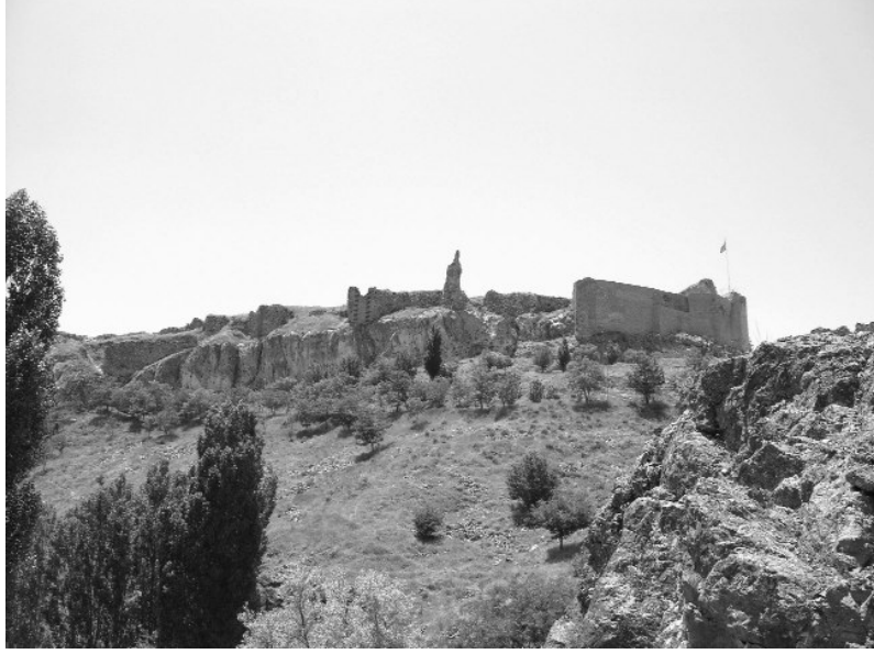
Resim 1- Harput İç Kale'nin doğudan genel görünüşü.