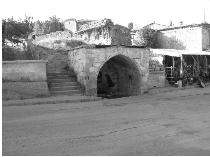
Resim 28- Harput Üç Lüleli Çesme.