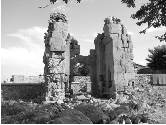
Resim 12- Harput Esadiye Camii taçkapısı.

minin sadece taçkapısıyla beden duvarlarının bir bölümü ayakta. Kesme taşlarla inşa edilen mukarnas kavsaralı taçkapı, sivri kemerli tonozla örtülü bir eyvanın dip duvarı üzerindedir (Resim 12). Eyvan yan duvarları üzerinde karşılıklı birer mihrabiye yer almaktadır. Uzunlamasına dikdörtgen planlı harimin mekan düzenlemesine ilişkin yeterli veri bulunmamasına karşılık, batı duvarındaki kemer ayakları ve Sunguroğlu'nun "üzerinin tonozla örtülü olduğu" şeklindeki ifadesinden hareketle mihraba dik sahnınlardan oluşan bazilikal planlı bir yapı olduğu tahmin edilebilmektedir. Harimin güney duvarı üzerinde iki mihrap nişi bulunmaktadır.