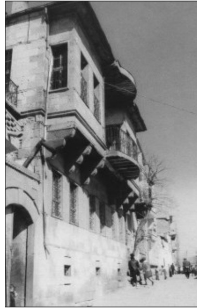
Res.12. Niğde Evinde Taş Payandalı Cumba Çıkmaları

3-Payandalı (göğüsleme, eliböğründe) Çıkmalara: Geleneksel Türk evinde en çok kullanılan ve hemen her yörede örneklerine sık rastlanan cumba çıkmasıdır (Resim: 10). Çıkmanın yükünü iki ya da daha