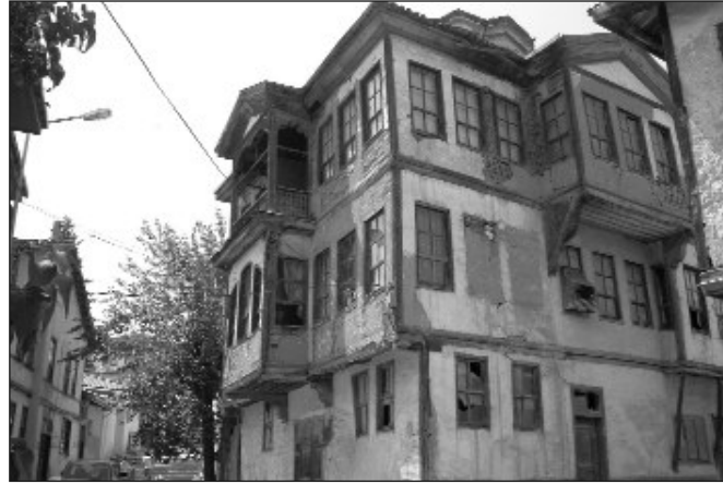
Res.2. Taraklı Fenerli Ev'de Çift Cepheli Sofa Cumbaları

cepheleri öne doğru çıkma yaparak cumba ile sonuçlandırılmıştır (Resim: 2). Anadolu’da “taht”, “seki” veya “köşk” 22 ismi verilen bu sofa çıkması, pahlanmış iki oda kapısının arasında kalan kısım, veyahut bir odanın geriye çekilmesiyle sofaya eklenen kısımdır. Bu kısım bazen tavanında da esas sofadan ayrılır 23 . İklimi sıcak olan bölgelerde bu çıkma daha çok ahşap konstrüksiyonlu “balkon” veya “gezemek (çardak, çiçeklik)” şeklinde düzenlenmiş olup, kemerlerle öne ve yanlara açılmaktadır. Çamaşır asmak veya yiyecek kurutmak için de kullanılan bu mekânlar hava ve güneş ışıklarını rahatça alabilmeleri için ahşap veya demir parmaklıklarla çevrilmiştir (Resim: 3). Üst kat veya orta kat seviyesinde, cephenin ortasında yer alan sofa cumbası, aynı zamanda alt katın ortasında yer alan ana giriş kapısı ile girişe anıtsallık kazandırmıştır.