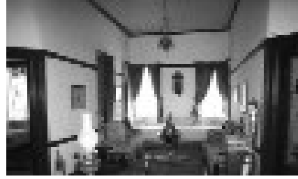
Res. 4. Silifke Atatürk Evi'nde Eyvan Sediri (H. Özözlü)

üzerinde kanaviçe işlemeli örtülerin olduğu katı yastık konulur. Üstleri beyaz kirlentlidir. Evin hanımı ve genç kızları bunlara tığ veya mekikle güzel danteller işlerler. Perdeler de böyledir ve temizliği, iç açıcılığı bakımından daima beyazdırlar. Bu sedirler evin vitrini konumunda olup, burada konuklar zevkle ağırlanır. Kış günlerinin komşu kabulleri toplantılar için renkli, temiz, güzel bir sohbet yeridir 25 . Sedir ölçüleriyle, pencere duvar ilişkisi çok iyi kurulmuştur. Sedirde oturan kollarını yastığa dayayıp dışarısını rahatlıkla seyrederek. Böylece odanın veya sofanın içindeki en etkili oturma ögesi olan sedir, bütünüyle dışarıya taşmıştır 26 (Resim: 4).