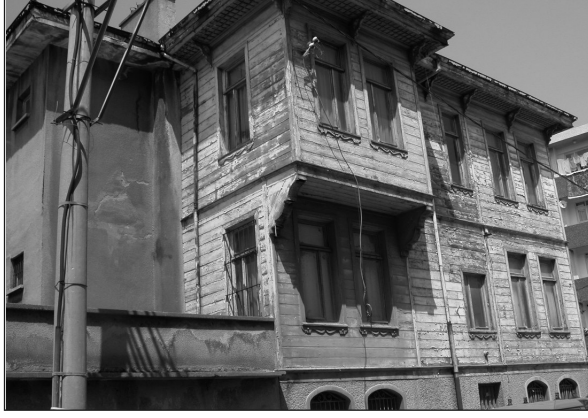
Res.1. Sakarya Alicanlar Evi'nde Baş Oda Cumbası

yapmaktadır. Cumbalar, bulunduğu odaya diğer odalardan daha fazla değer kazandırmıştır. Evin cumbalı odası bol manzaralı olması açısından, daha çok misafir kabul edilen ve evin reisinin oturduğu “baş oda” olarak kullanılmasına neden olmuştur (Resim: 1).