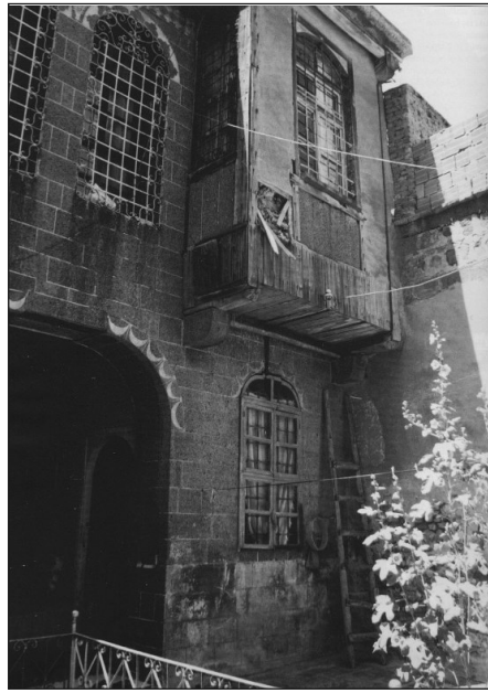
Res.10. Diyarbakır Evinde Bindirmeli Konsol Cumba Çıkması (O.C. Tuncer)