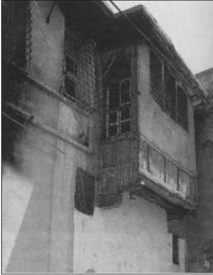
Res. 5. Diyarbakır Evinde Ahşap Kafesli Cumba Pencereleeri (O.C. Tuncer)