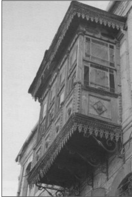
Res. 14. Uşak Simavlıoğlu Evi'nde Demir İşçilikli Cumba Çıkması (Y. Sayan)

Bu üç tipin dışında cumba çıkmasının sağlamlığını temin etmek, sokağa daha çok çıkmak veya taşıyıcı duvarların zayıf olması durumunda karmaşık çıkmaların kullanıldığı az da olsa görülmektedir 31 .