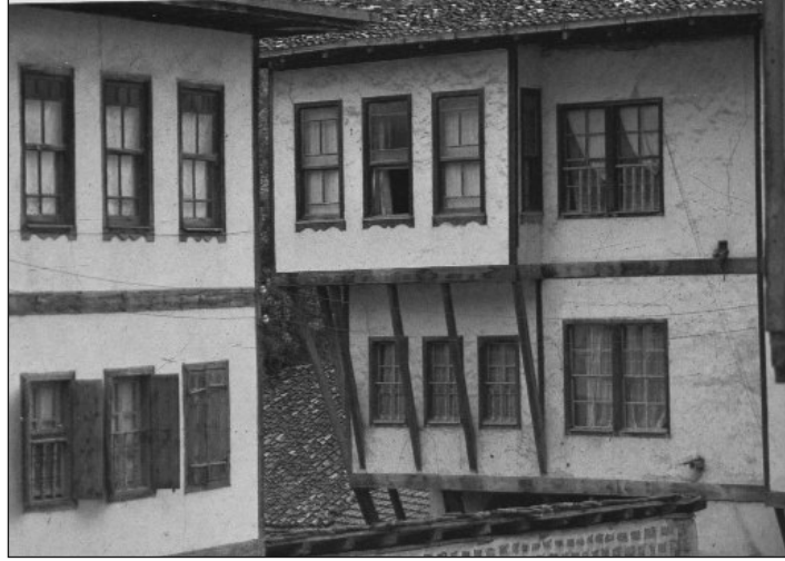
Res.13. Safranbolu Keçeciler Evi'nde Ahşap Payandalı Cumba Çıkması (R. Günay)