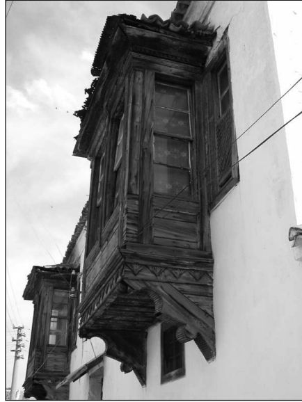
Res. 7. Muğla Evinde Ahşap Cumbalar