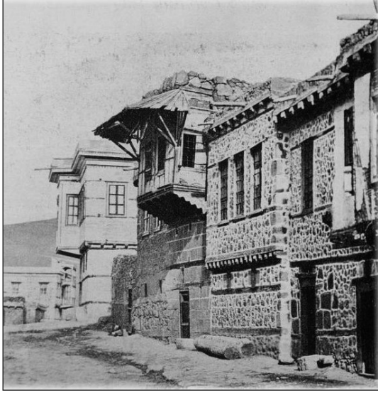
Res.11. Erzurum Evinde Payandalı (Göğüsleme, Eliböğründe) Cumba Çıkması

çok payanda ile taşıyan tiplerdir. Bazen sade payandalar (Resim: 11), bazen zarif kıvrımlı, ajurlu ahşap eliböğründeler şeklinde karşımıza çıkan bu tip çıkmalarda taş örneklerine de rastlanılır (Resim:12). Bunların dışında, özellikle XIX.yy sonu XX.yy. başı bazı cumbalarda çıkma altında demir malzemenin taşıyıcı konsollar olarak kullanıldığı örneklerine de rastlanılmaktadır. Bu demir süslemeler daha çok Osmanlı sanatında Batılılaşma sürecinde Barok ve Ampir dönemlerde sevilerek kullanılan “S”, “C” kıvrımlı bitki motifleri ile salt geometrik şekillerin uzatılması veya yayvanlaştırılması karakterlerine uygun özellikler göstermektedir (Resim: 13).