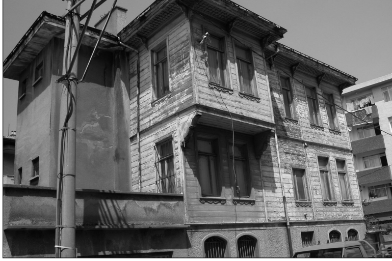
Res.8. Taraklı Hisar Evi'nde Basit Konsol Cumba Çıkması