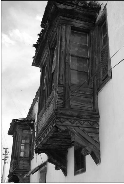
Res. 9. Muğla Evinde Bağdadi Konsollara Oturan Cumba Çıkmaları