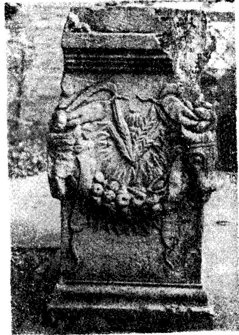
Res. 14 b— Ephesos (Selçuk) Müzesi'ndeki 1728 env. no.lu sunak (Kat. no. 4)