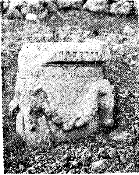
Res. 10— Knidos'da bulunmuş olan sunak (Kat. no. 28)