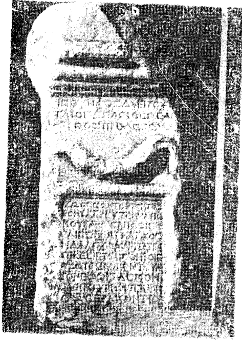
Res. 25— Denizli Müzesi'nde bulunan Emircik kökenli sunak (Kat no. 11)