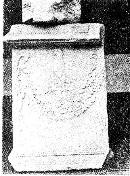
Res. 13— Bergama Müzesi'nde bulunan sunak (Kat. no. 3)