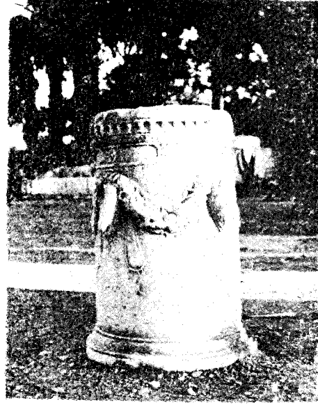
Res. 19— Bodrum'da bulunan sunak (Kat. no. 19)