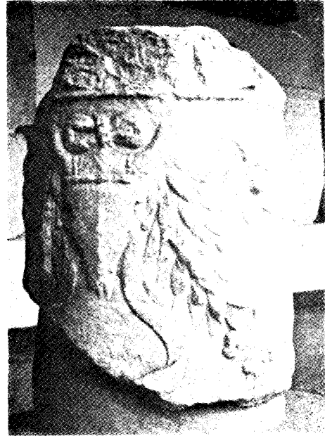
Res. 3— Bergama Müzesi'ndeki yuvarlak tabanlı sunak (Kat. no. 15)