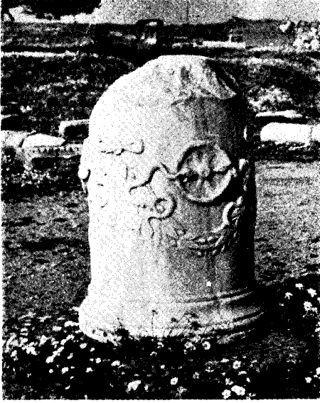
Res. 8— Bergama, Asklepieion'un girişinde bulunan sunak (Kat. no. 17)