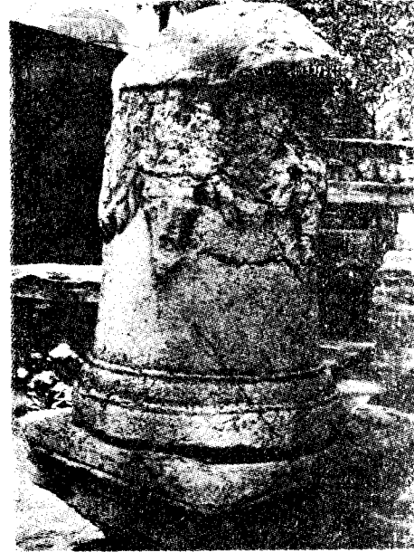
Res. 21— Manisa Müzesi'nde bulunan 243 env. no.lu sunak (Kat. no. 24).