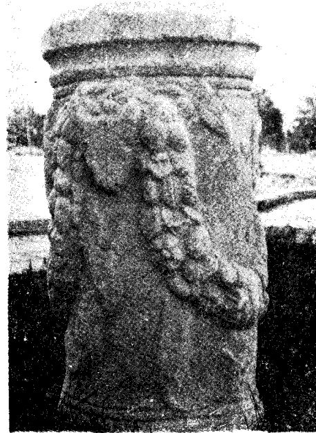
Res. 24 b— Denizli Müzesi'nde bulunan sunak (Kat. no. 23)