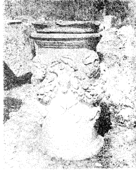
Res. 15-- Aphrodisias (Geyre)'de bulunan sunak (Kat. no. 13)