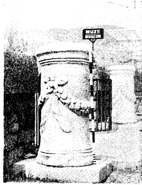
Res. 23— Denizli Müzesi'nde bulunan sunak (Kat. no. 22)