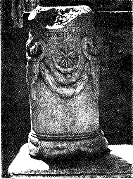
Res. 2 b— Manisa Müzesi'ndeki 244 env. no.lu sunak (Kat. no. 25)