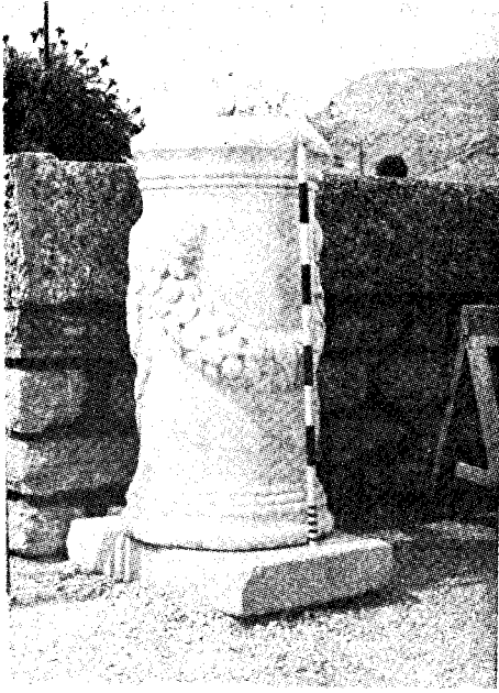
Res. 4— Denizli Müzesi'ndeki yuvarlak tabanlı sunak (Kat. no. 21)