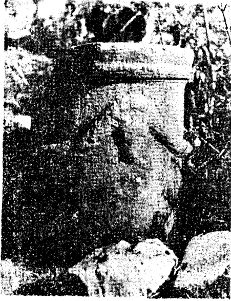
Res. 18— Kedreai (Sedre veya Şehir adası) da bulunan sunak (Kat. no. 27)