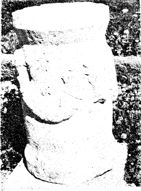
Res. 20— Afyonkarahisar Müzesi'nde bulunan sunak (Kat. no. 12)