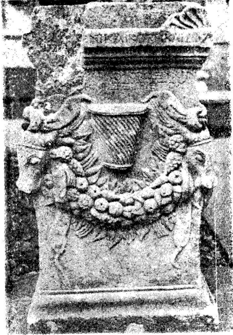
Res. 14 a— Ephesos (Selçuk) Müzesi'ndeki 1728 env. no.lu sunak (Kat. no. 4)