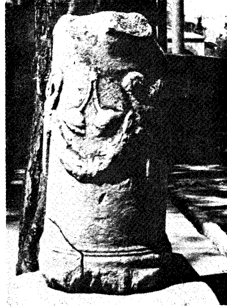
Res. 2 a— Manisa Müzesi'ndeki 244 env. no.lu sunak (Kat. no. 25)