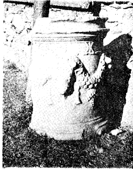
Res. 11— Datça'da bulunan sunak (Kat. no. 20)