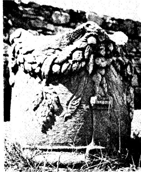
Res. 7— Stratonike'de bulunmuş olan yuvarlak tabanlı sunak (Kat. no. 33)