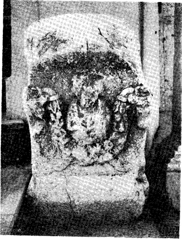
Res. 27— Isparta Müzesi'ndeki 91282 env. no.lu sunak (Kat. no. 38)