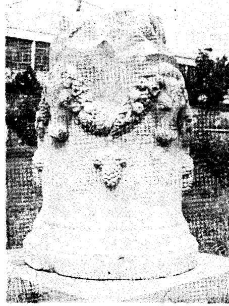
Res. 9— Aydın Müzesi'ndeki sunak (Kat. no. 12)