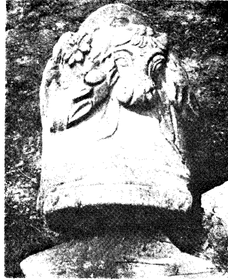
Res. 5— Manisa Müzesi'ndeki 145 env. no.lu sunak (Kat. no. 30)