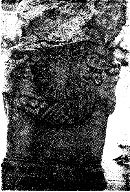
Res. 14 c-- Ephesos (Selçuk) Müzesi'ndeki 1728 env. no.lu sunak (Kat. no. 4).