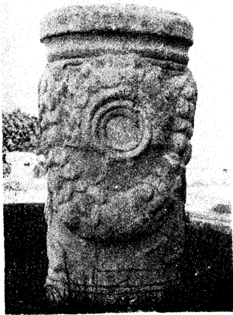
Res. 24 a— Denizli Müzesi'nde bulunan sunak (Kat. no. 23)