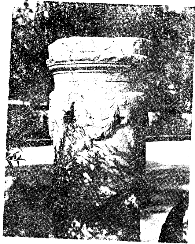
Res. 26— Fethiye Müzesi'ndeki Boukranion ve Gi- land'lı sunak (Kat. no. 37)