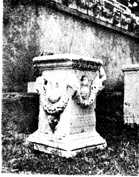
Res. 16— İzmir (Kapılar) Müzesi'ndeki sunak (Kat. no. 6)