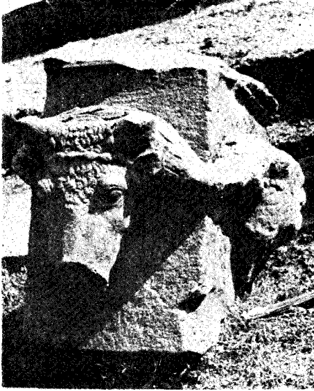
Res. 6— Klaros, İkinci Tapınak ın yakınında bulunmakta olan sunak (Kat. no. 7)