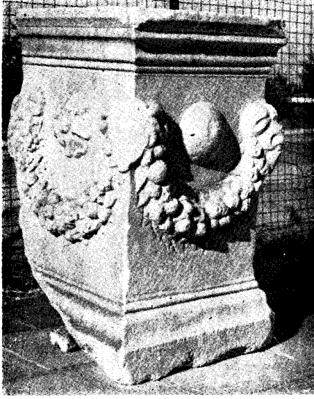
Res. 1— Denizli Müzesi'ndeki kare ta- banlı sunak (Kat. no. 5)