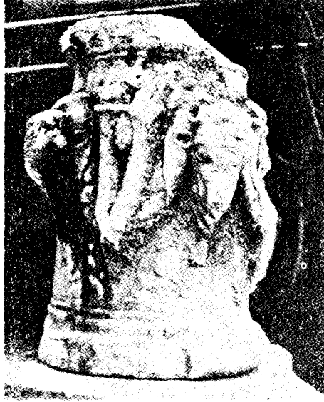
Res. 22— Bodrum'da bulunan sunak (Kat. no. 18)