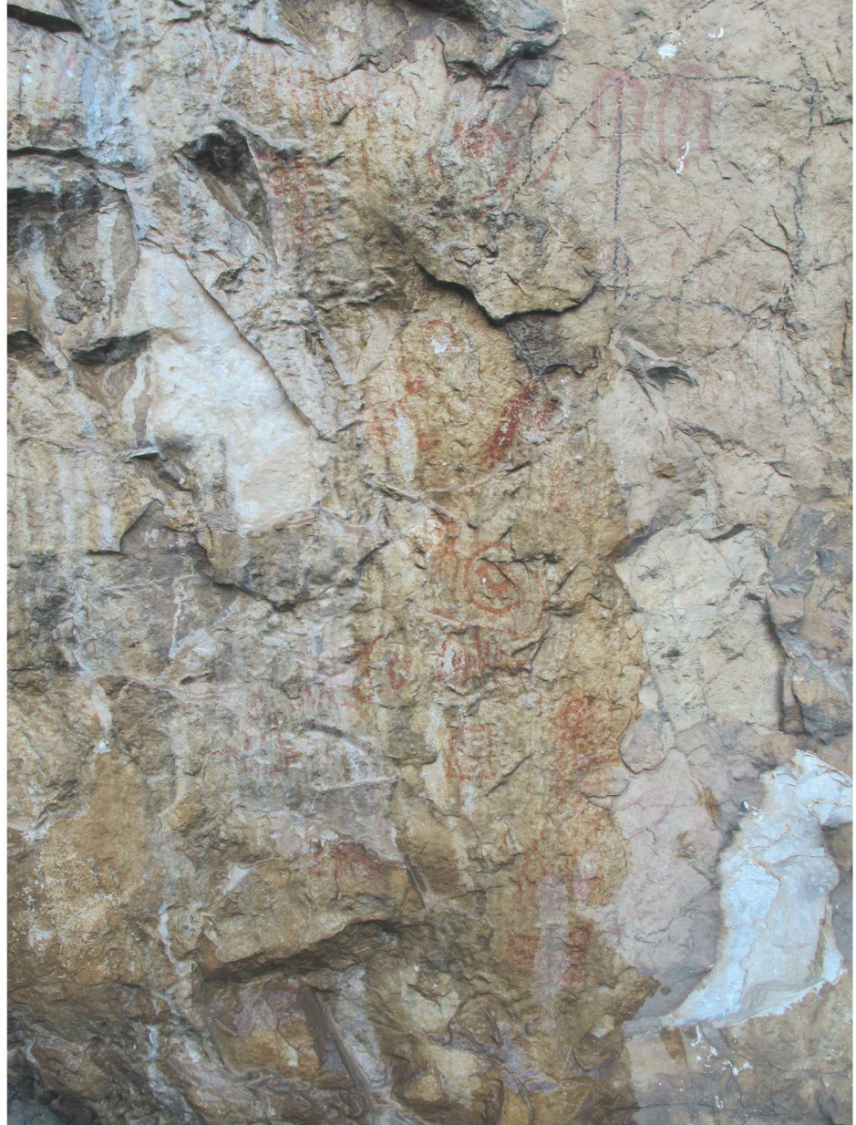
Res. 17. Tavabaşı Aşağı Mağara Cephesindeki 5 Numaralı Resim Kümesi: Soyut Resimler / Abstract Figures in Group 5 on the Façade of Lower Cave.

rastlanılır ve bu betimlemeler genel olarak soyut ve fantastik anlatımlar olarak yorumlanmaktadır. Tavabaşı kaya resimleri içerisinde sıkça tasvir edilen bir başka soyut figür, düz bir çizginin karşılıklı iki tarafına kısa çizgiler atılarak oluşturulan “tarak” formuna benzer motiftir. 3, 4, 5 ve 7 numaralı resim kümeleri içerisinde tercih edilen bu motif çoğunlukla bağımsız olarak tasvir edilmiş olmasına rağmen, beşinci küme içerisinde olduğu gibi spiral betimlemeleriyle bağlantılı olarak da kullanılmıştır. Farklı kümeler içerisinde bu motifin yatay, çapraz ya da dikey konumlarda yerleştirilmiş olması da dikkat çekicidir. Özellikle yedinci küme içerisinde yer alan örnek diğer benzerlerinden boyutu ve