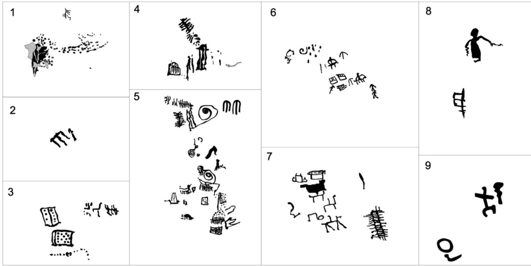
Res. 8. Tavabaşı Aşağı Mağara Cephesindeki Kaya Resimleri (Dokuz resim kümesi halinde) / Drawings of the Motifs on the Façade of Lower Cave (in nine figure groups).