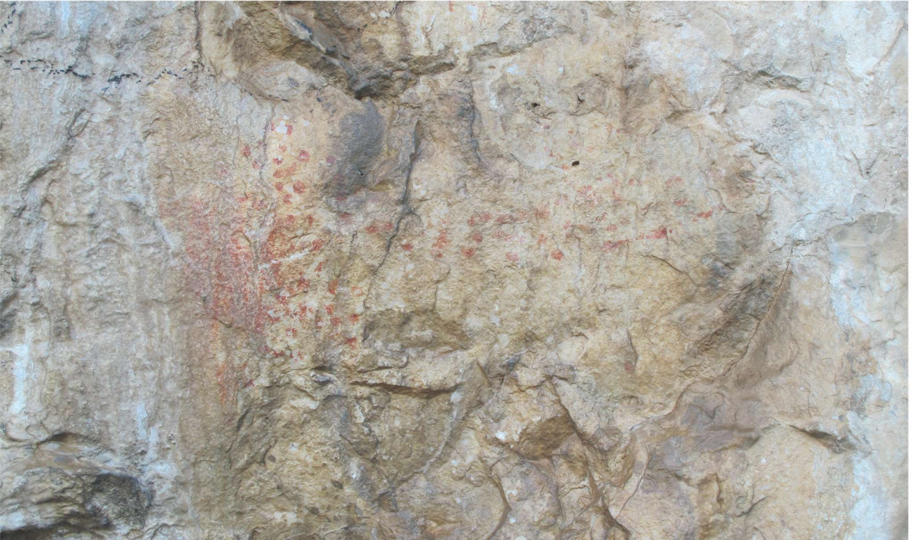
Res. 14. Tavabaşı Aşağı Mağara Cephesindeki 1 Numaralı Resim Kümesi: Doğal Peyzaj Anlatımı / Landscape Narrative in Group 1 on the Façade of Lower Cave.