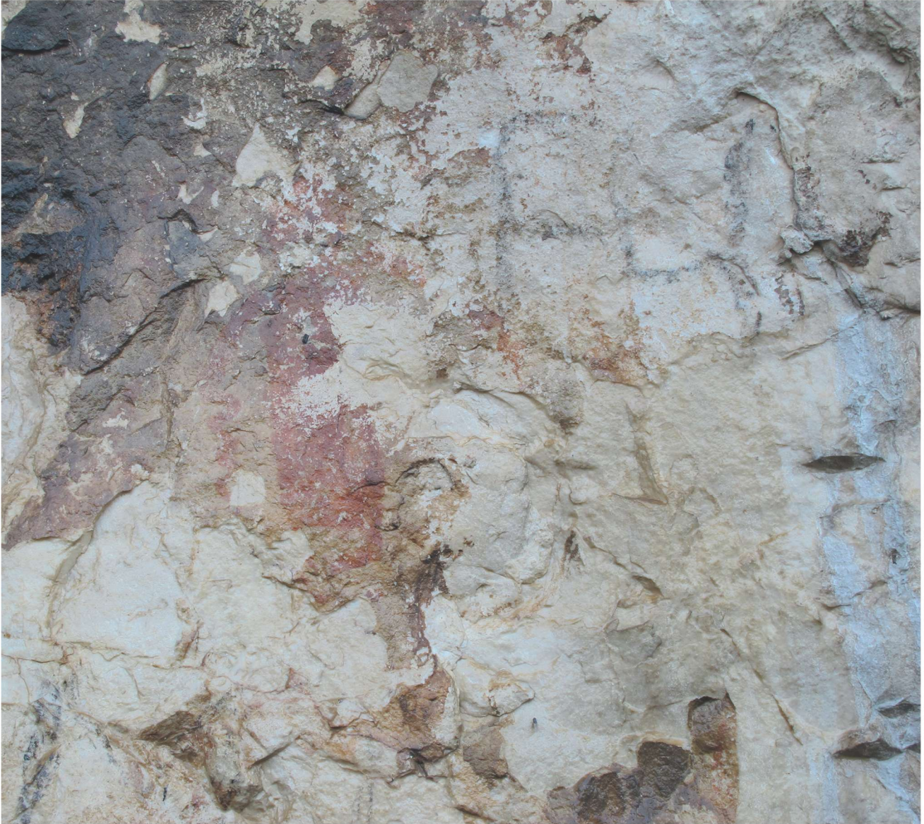
Res. 10. Tavabaşı Aşağı Mağara Cephesindeki 8. Resim Kümesi: Yalnız İnsan Tasvirleri / Human Figures in Group 8 on the Façade of Lower Cave.