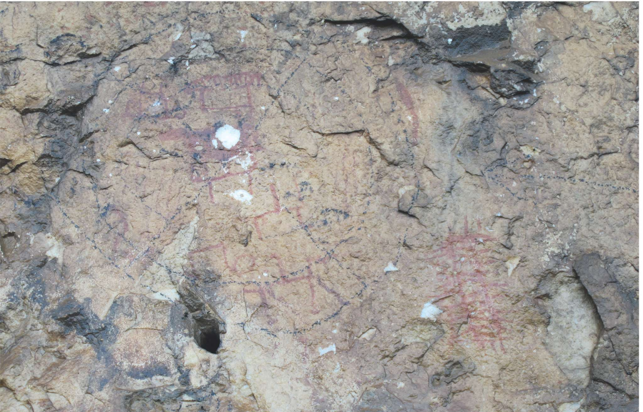
Res. 12. Tavabaşı Aşağı Mağara Cephesindeki 7. Resim Kümesi: Grup Halinde İnsan Tasvirleri ve Hayvan Figürleri / Human and Animal Figures in Groups in Group 7 on the Façade of Lower Cave.