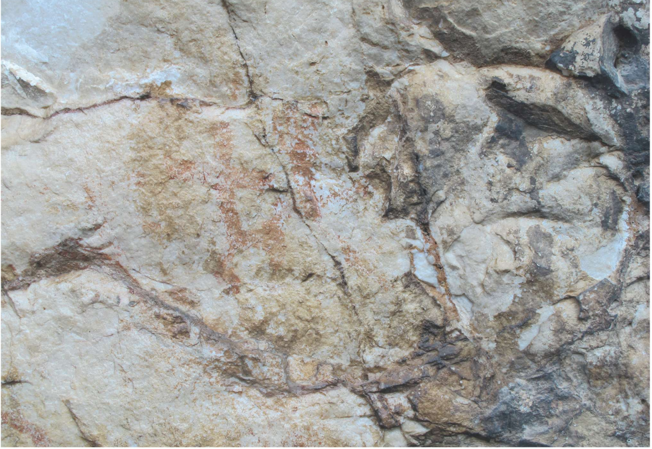
Res. 13. Tavabaşı Aşağı Mağara Cephesindeki 9. Resim Kümesi: Yalnız İnsan Tasvirleri / Human Figures in Group 9 on the Façade of Lower Cave.

Sekiz numaralı küme içerisinde yer alan ve yüksek tutulmuş boyutuyla diğerlerinden ayrılan figür belirgin kafa yapısı, iri betimlenmiş gövdesi, yanlara açılan yay biçimli kolları ve ellerinde tuttuğu spiral formlu sembollerle (yılan?) diğer insan betimlemelerinden ayrılmaktadır (Res. 10). Erkek anlatımları olarak yorumlanan diğer resimlerden belirgin biçimde ayrılan bu figürün bir kadın betimlemesi olması olasılığı yüksektir. Ayrıca figürün boyutunun diğer örneklerden daha büyük tutulması ve konum olarak da resim kompozisyonunun en sağında yer alarak diğer anlatımlara yönlendirilmesi tanrısal bir karakterde olmasıyla açıklanabilir. Diğer yandan özellikle altıncı kümeden sonra betimlenmiş insan ve insan-hayvan anlatımlarının bu figüre doğru yönlendirilmiş olmaları da oldukça dikkat çekicidir.