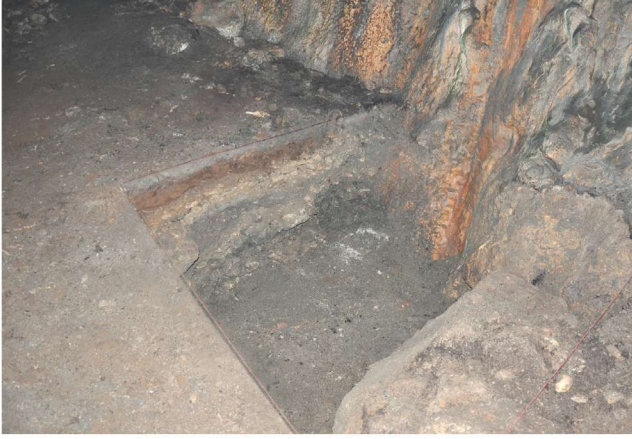
Res. 4. Tavabaşı Aşağı Mağara İçinde Açılan 2,5 x 2 m Boyutlarındaki Sondaj Çukuru / Trial Trench Measuring 2,5 m x 2 m Opened in Lower Cave at Tavabaşı.

300-350 yıl kadar iskan gördüğü söylenebilir. Değişik tabakalarda gözlemlenen seramikler içerisinde yüzeye yakın tabakalarda az miktarda Neolitik Dönem, Bronz Çağı ve Demir Çağından Bizans Dönemine kadar farklı dönemleri temsil eden çanak çömlek parçaları gözlemlenmiştir. Mağara girişinin hemen üst kısmındaki fresko parçaları da Bizans Dönemi'ne tarihlenmektedir.