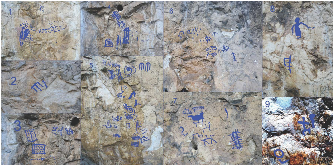
Res. 9. Tavabaşı Aşağı Mağara Cephesindeki Kaya Resimlerinin Renklendirilmiş Hali / Computer-Based Coloring of Rock Paintings on the Façade of Lower Cave.