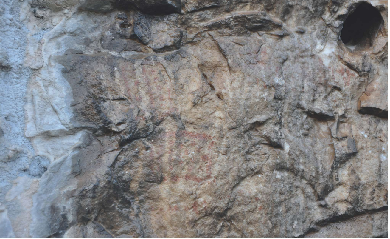
Res. 15. Tavabaşı Aşağı Mağara Cephesindeki 3 Numaralı Resim Kümesi: Mimari Betimlemeler / Architectural Narrative in Group 3 on the Façade of Lower Cave.