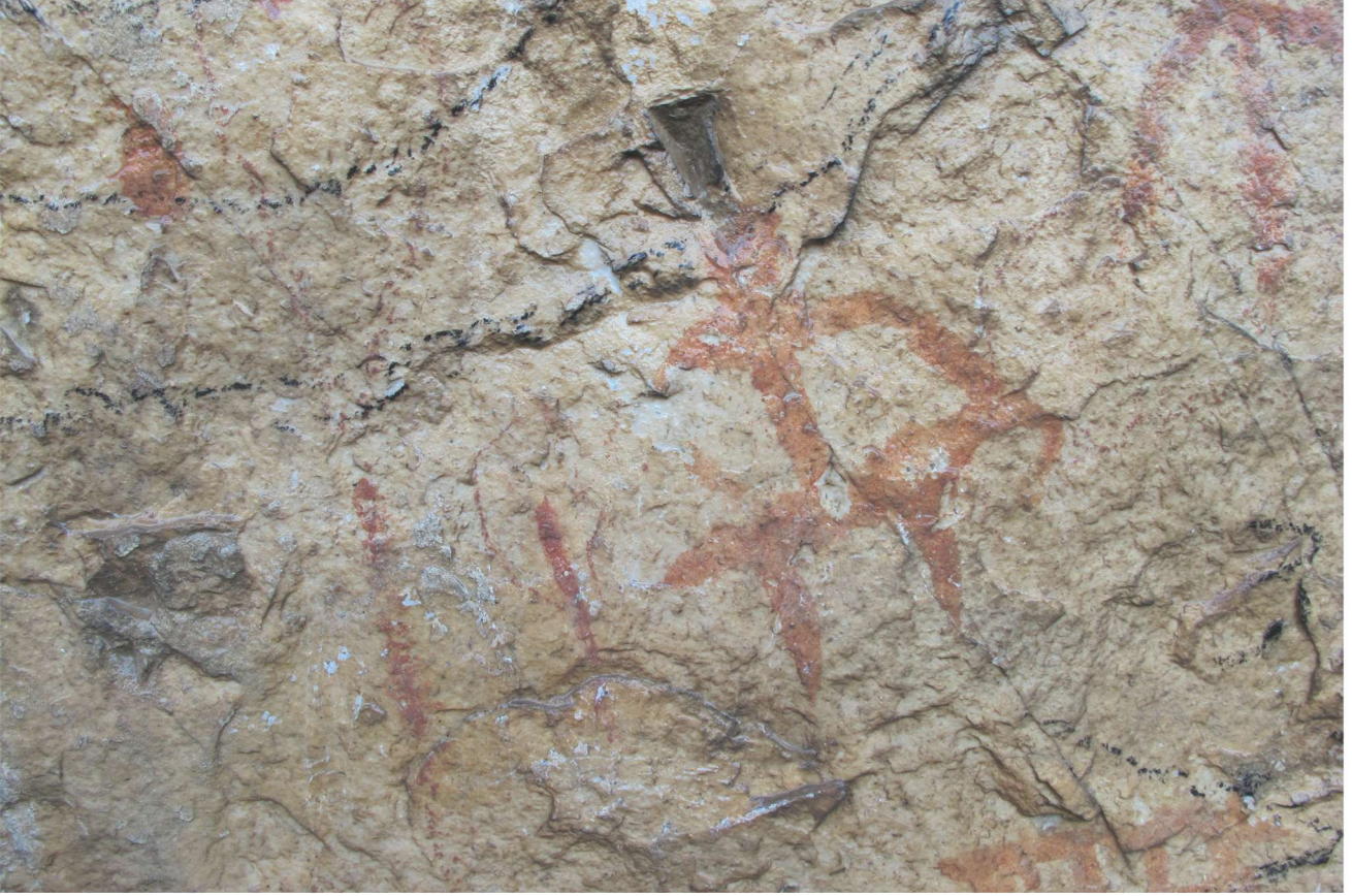
Res. 11. Tavabaşı Aşağı Mağara Cephesindeki 6 Numaralı Resim Kümesinde İnsan Figürü / Human Figure in Group 6 on the Façade of Lower Cave.