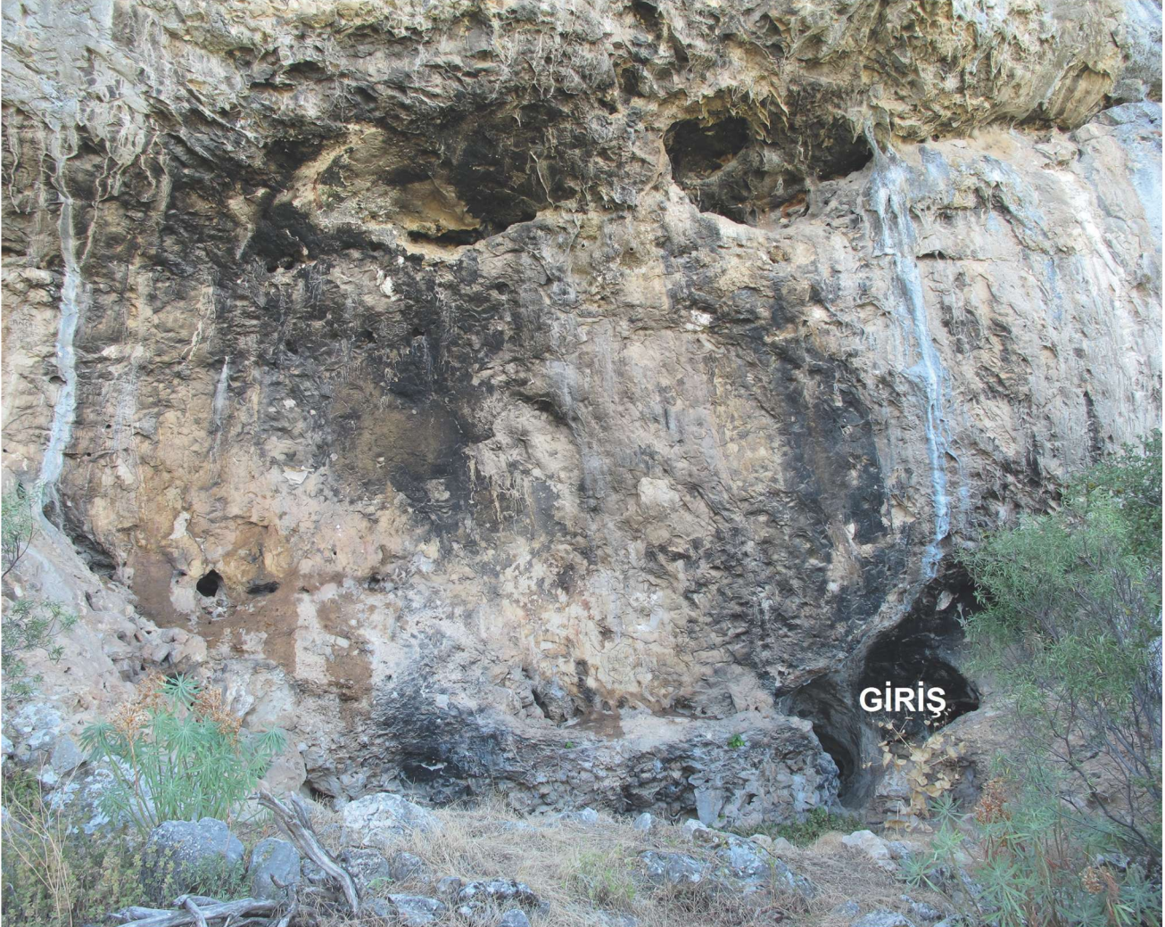
Res. 6. Tavabaşı Aşağı Mağara Girişi ve Aşınmış Düz Yüzeğe Sahip Ön Cephesi / Façade of the Lower Cave with Rock Paintings at Tavabaşı.

dığı alanlarda gri gibi daha açık tonların da kullanıldığı tahmin edilmektedir. Tahribata rağmen genel hatlarıyla takip edilebilir durumdaki kaya resimleri içerik olarak kısmen de olsa çözümlenebilmesine olanak sağlamıştır (Res. 7-9). Kaya yüzeyine yerleştirilme durumları göz önünde bulundurularak dokuz farklı küme içerisinde değerlendirilen kaya resimleri başlangıç grubundan itibaren sırasıyla doğal peyzaj, mekan, soyut anlatımlar, insan ve hayvan anlatımlarını içermektedir. Ayrıca ikonografik olarak anlaşılır durumda olan bu konuların yanında tam olarak tanımlanamayan soyut ve düzensiz çizgisel anlatımlar da bu kümeler içerisinde yer almaktadır. Söz konusu resimsel anlatımlar içerisinde bir konu birlikteliği saptamak güçtür. Ancak özellikle altıncı kümeden sonra başlayan insan betimlemelerinin olduğu alanların mekan ve hayvan figürleri ile birlikte resmedilişi göz önünde bulundurulduğunda, bu tasvirlerin günlük yaşama dair bazı anlatımları içerdiğini söylemek mümkündür. Ayrıca sekizinci resim kümesi içerisindeki sahnenin en sonunda yer alan, boyut ve biçem olarak diğer insan resimlerinden rahatlıkla ayrılabilen figürün de tanrısal bir karakteri temsil edebileceği düşünülmektedir (Res. 10).