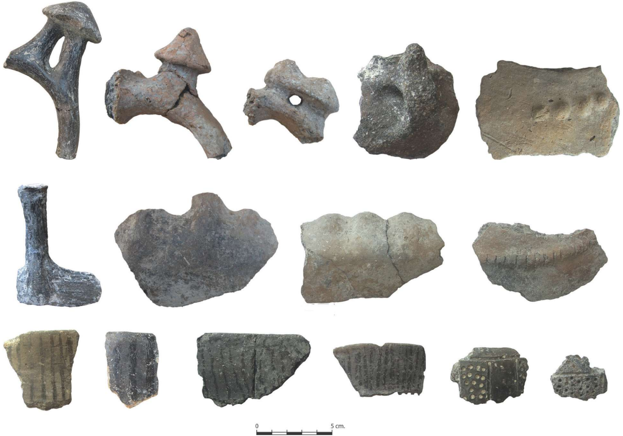
Res. 5. Tavabaşı Aşağı Mağara Orta Kalkolitik Dönem Seramik Buluntuları / Middle Chalcolithic potsherds from Lower Cave at Tavabaşı.

Demir Çağ öncesi Likya kültür tarihi için büyük önem arz eden Tavabaşı mağaraları Batı Anadolu arkeolojisinin en az bilinen dönemlerinden biri olan Orta Kalkolitik Dönem yerleşim izlerini de barındırmaktadır. Güneybatı Anadolu'da söz konusu Orta Kalkolitik Dönem yalnızca Karain Mağarası ile Elmalı ovasında Aşağı Bağbaşı ve Kızılbilbel gibi yerleşimlerden bilinmektedir 7 . Özellikle Aşağı Mağara'nın kesitlerinden alınan radyokarbon örnekleri de bu dönemin aydınlatılması için önemli veriler sunmaktadır. Mağara içerisinde tespit edilen prehistorik çanak çömlek arasında Orta Kalkolitik Döneme tarihlenen örnekler yüksek bir orandadır (Res. 5). Bilindiği üzere Batı Anadolu'da az bilinen Orta Kalkolitik Dönem, Göller Bölgesi Hacılar çok renkli seramik geleneği ile tanımlanan nitelikli Erken Kalkolitik kültür ile daha çok Beycesultan erken evreleriyle özdeş tutulan ve genellikle koyu renkli seramik geleneği ile temsil edilen Geç Kalkolitik kültür arasındaki geçiş dönemidir. Elmalı Ovasında belirlenen söz konusu Orta Kalkolitik Dönem ile ilgili bilgilere Tavabaşı Aşağı Mağara'nın katkısı sağlaması bu bakımdan önemlidir. Genellikle kısa dönemli iskanlar ile karakterize edilen Orta Kalkolitik Dönem yerleşim tipleri arasında Tavabaşı örneğinde olduğu gibi mağara tipi yerleşimlerin yer alması da ayrıca ilgi çekicidir.