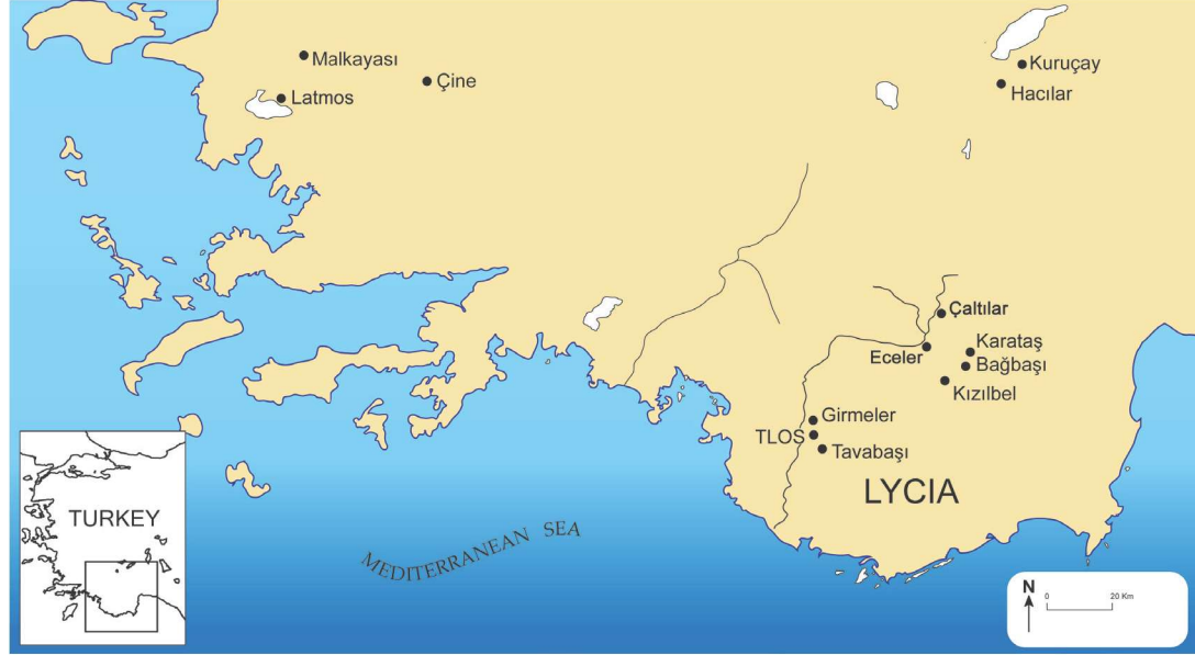
Res. 1. Likya Bölgesi Prehistorik Yerleşim Alanları / Map Showing Major Prehistoric Sites in South-West Anatolia.

Tlos arkeolojik kazıları kapsamında kentin territoryasında da bölgenin antik çağ kültürlerine yönelik önemli araştırmalar gerçekleştirilmiştir. Tlos'un Geç Tunç Çağı Hitit kaynaklarında Tlawa olarak adı geçen bir kaç kentten birisi olması bu araştırmaların altında yatan ana nedenlerden birisi olmuştur. Tlos çevresinde olası MÖ 2. Binyıl buluntulara ait izleri tespit etmeyi amaçlayan çalışmalar esnasında bölgenin Tunç Çağı, Kalkolitik ve Neolitik Dönemlerine ait önemli verilere ulaşılmıştır. Bu yerleşimlerden en önemlisi hiç şüphesiz Erken Neolitik Dönemden Bronz Çağına kadar iskan izleri sunan Girmeler Mağarası önündeki bugün tahrip olmuş höyük yerleşimi kalıntılarıdır 2 . Tlos kazı ekibi tarafından gerçekleştirilen yüzey araştırmalarında ortaya çıkan en dikkat çekici keşiflerden birisi de Arsaköy yakınlarında Tavabaşı Mevkii'ndeki iki mağaradır 3 . Bunlardan Aşağı Mağara'ya girişi sağlayan küçük açıklığın üzerinde ve solunda aşınmış düz yüzey üzerinde kırmızı boya ile yapılmış farklı biçimlerde geometrik motifler, süslemeler, insan figürleri ve tanımlanamayan figürler dikkat çekmektedir. Üslup bakımından burada karşımıza çıkan kırmızı boyalı figürlerin çok yakın benzerlerini kuzeybatıda Latmos Dağlarında bulunan birçok kaya resimlerinden bilmekteyiz. Şimdiye kadar Latmos Dağları kaya resimlerinin Batı Anadolu kaya resim sanatının tek tanığı olarak kabul edilmekteydi. Tavabaşı Aşağı Mağara artık