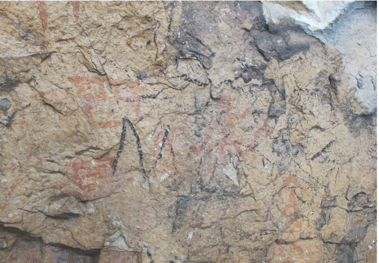
Res. 16. Tavabaşı Aşağı Mağara Cephesindeki 6 Numaralı Resim Kümesi: Mimari Betimlemeler / Architectural Narrative in Group 6 on the Façade of Lower Cave.