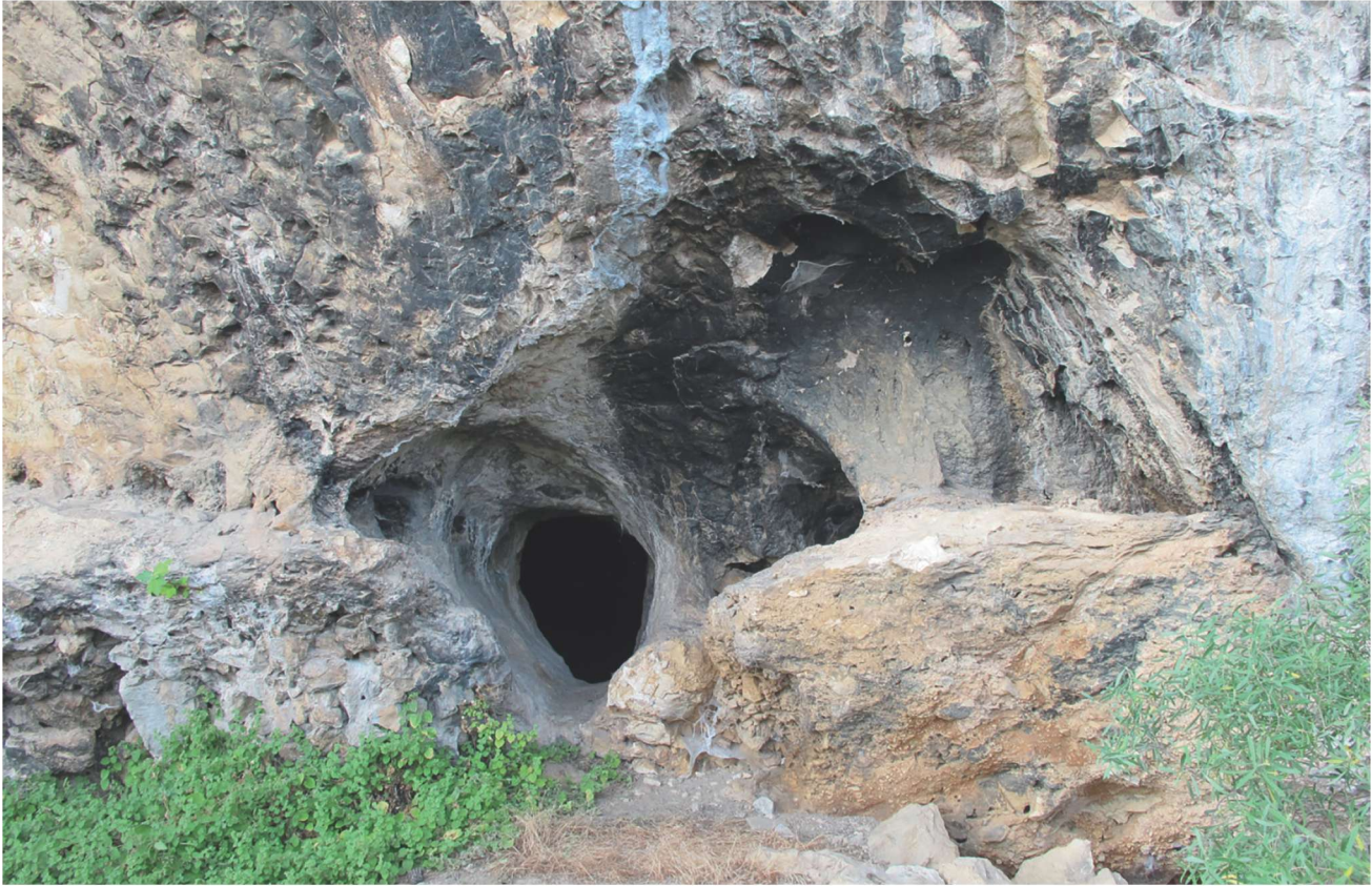
Res. 3. Tavabaşı Aşağı Mağara girişi / Entry of Lower Cave at Tavabaşı.

Aşağı Mağara ise Yukarı Mağara'ya göre kayalık yüzeyin bir alt kodunda yer almaktadır (Res. 3). Yukarı Mağara'ya göre daha küçük ve 9 metre uzunluğunda ve 6 metre genişliğinde tek bir odadan oluşan Aşağı Mağara'ya 1,2 x 0,6 m ölçülerinde küçük bir açıklıktan girilmektedir. Mağaranın zemininde kaçak kazıcıların açtığı çukurda yapılan tespit ve belgeleme çalışmaları esnasında farklı yerleşim katmanlarına ulaşılmıştır (Res. 4). Yüzeyden yaklaşık olarak 1,5 m derinlikte ana kayaya ulaşan açmanın kaya üzerindeki 0,6 m kalınlığında kültür tabakasında yoğun miktarda Orta Kalkolitik döneme ait buluntular ortaya çıkarılmıştır. Söz konusu yerleşim tabakası alt ve üstten genellikle karbon birikimi ile diğerlerinden ayrılmıştır. Söz konusu Orta Kalkolitik dönem tabakasından alınan iki örneğin radyokarbon tarihlemesi sonucu bu tabakanın MÖ 4838 ve 4459 arası yaklaşık