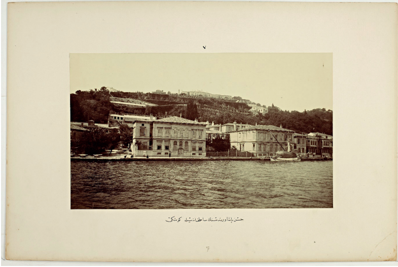
Resim 2 Hasan Paşa Veresesinin Sâhilhânesi ve Köşkü 170

Nâile Sultan'ın ikametine mahsus olmak üzere Kuruçeşme'deki sâhilhânenin bedelinin Maliye tarafından, Hazine-i Hâssa tahsisatından ayrılması bildirilmiştir. Daha önce Zekiye ve Nâime sultanlara verilen ikametler ayarında bir düzenleme yapılmıştır 171 . Bahriye Nâzırı sâbık Hasan Paşa merhûmun veresesine ait olup, Nâile Sultan adına satın alınan Kuruçeşme'deki sâhilhâne ve arkasındaki köşk için 11.000 Osmanlı Lirası ödenmiştir 172 . Nâile Sultan Köşkü'nün ehven bir şekilde döşenmesi için acele davranılması istenmiştir. Kırk oda, salon ve koridordan oluşan köşk için tasarrufa riayet edecek şekilde harcama yapılması vurgulanmıştır 173 .