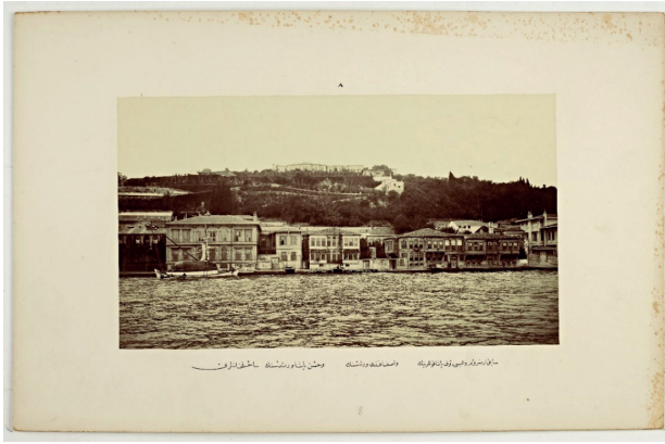
Resim 4 Hasan Paşa Veresesinin Sâhilhâne 182

Yalının Ortaköy tarafında bulunan selamlık binası ile harem binası arasında rıhtıma demir korkuluklarla bir bahçe açılmakta idi 178 . Haremın üst katında dokuz oda; alt katında ise taşlık bölümünde beş oda mevcuttu. Bahçeye bakan diğer dairenin üst katında salon; bu dairenin orta kat planında dört oda ile bir hamam, alt katında ise dört oda yer almakta idi 179 . Harem binası yüksek duvarlarla rıhtımdan ayrılmıştır. Yuvarlak biçimli binada deniz hamamı olduğu da düşünülmektedir. Yapının cephelerinde dikdörtgen biçimli; deniz cephesinin merkez kısımlarında ise yuvarlak kemerli pencereler tasarlanmıştır 180 . Arkadaki bahçede bulunan diğer bölüme geçiş köprü ile sağlanmıştır. Binaların altındaki mahzenler ve bahçenin köşesindeki ahır da bu plan içerisine dahil edilmektedir 181 .