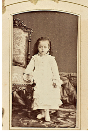
Resim 1 Naile Sultan 27

Annesi Dilpesend Kadınefendi'yi 18 on yedi yaşına kadar görebilen Nâile Sultan'ın adı 19 Hânedan Defteri 'ne Abdülhamid-i sâninin 9 Ocak 1884 tarihinde doğmuş kızı olarak kayıtlıdır 20 . Sultan II. Abdülhamid'in tahta çıktıktan sonra yaklaşık yedi ay kadar Dolmabahçe Sarayı'nda ikamet ettiği düşünüldüğünde, Nâile Sultan'ın Yıldız Sarayı'nda doğduğunu söyleyebiliriz. Pek güzel olduğundan bahsedilen Nâile Sultan 21 padişahın çocukları arasında yedinci, kızları içerisinde dördüncü sıradadır 22 . Sultan dünyaya geldiğinde ona, istediği şeye muvaffak olan, muzaffer 23 anlamlarına gelen, Nâile ismi verilmiştir. Yeni doğan sultanefendiye, Padişah Abdülmecid'in kızlarından olup genç yaşta vefat eden halasının ismi uygun görülmüştür. Abdülhamid'in kızı Nâile Sultan'a düşkün olduğu bilgisine dönem hatıratından ulaşılmaktadır 24 . Nâile Sultan'ın piyanist, arpist ve viyolensalist olduğu söylenirken, müzik hocasının Lombardi Bey olduğu paylaşılmaktadır 25 . Şâdiye Sultan, kardeşi Nâile Sultan'la birlikte tiyatro temsillerini izlediklerini anlatmaktadır. Sultan II. Abdülhamid'in kendi locasında takip ettiği programlarda, kızları Nâile ve Şâdiye Sultanlar hemen yanındaki locadan etkinliklere iştirak etmişlerdir 26 .