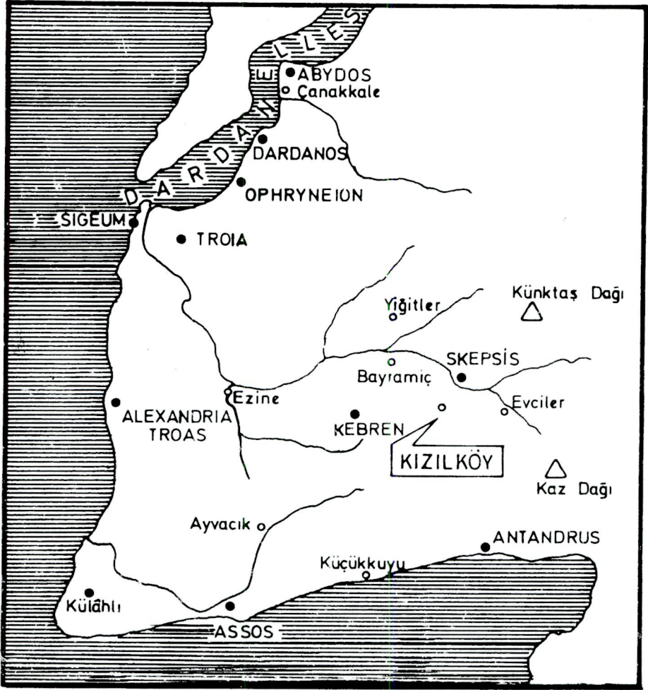
ÇİZİM I. KIZILKÖY ve yöresi