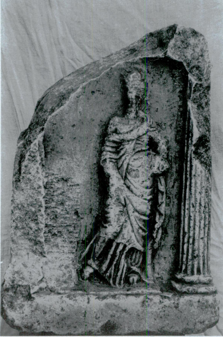
Res. 1 — Kızılıky Steli n-yz.