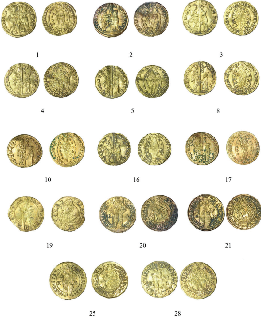
Resim 3: Avrupa Devletleri Sikkeleri