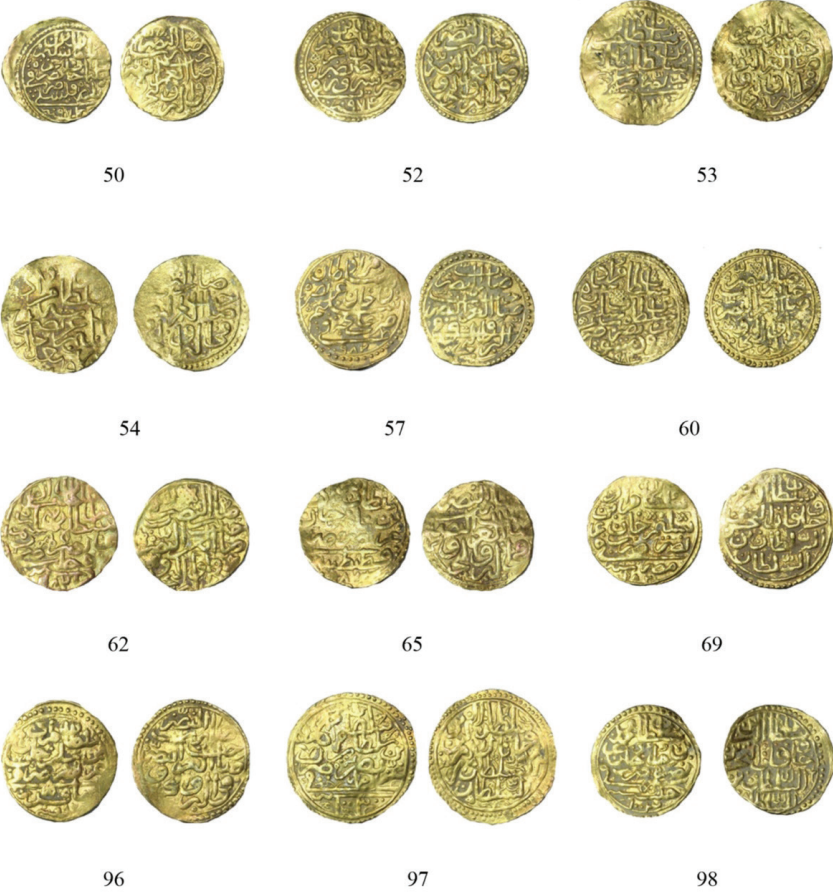
Resim 2: Osmanlı Sikkeleri