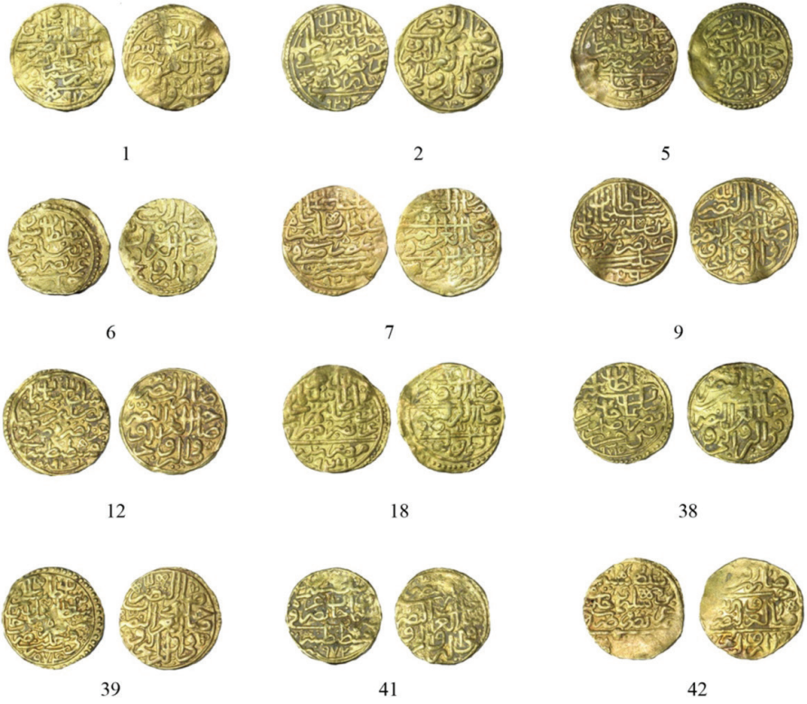
Resim 1: Osmanlı Sikkeleri