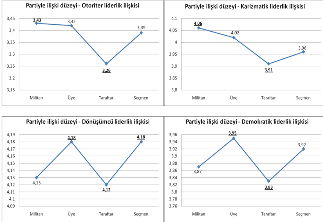
Şekil 1. Görüşülenlerin Yakın Oldukları Siyasi Partiyle İlişki Düzeyi ile Liderlik Beklentileri Arasındaki İlişki

Yakın olunan siyasi partiyle ilişki ile liderlik özelliklerine ilişkin beklenti ortalaması ilişkisine bakıldığında, görüşülenlerin yakın oldukları siyasi partilerle ilişki düzeylerinin liderlik beklentilerine etki ettiği görülmektedir.