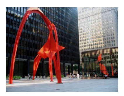
Şekil 21. Alexander Calder, "Flamingo", 1974

1960 yıllarında Calder artık mobil heykel çalışmayı bırakmış ve daha büyük ölçekli çalışmalar yapmaya yönelmiştir. Artık hem Latin Amerika'da ve Avrupa'da ün kazanacağı, "stabil" diye adlandırdığı anıt heykellerini ortaya çıkarmaya başlamıştır.