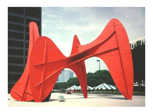
Şekil 22. Alexander Calder, 1974

Calder stabillerini mobillerde olduğu gibi narin malzemelerle yapmış onları mekânlarla uyum içinde olacak şekilde tasarlamıştır(şekil 21-22). Etkili bir kontrastlık yaratmaları için heykellerinde koyu kırmızı kullanmaya ağırlık vermiştir. Biyolojik ve dinamik biçimli bu tasarımlarıyla Calder, çevre mimarisine geometrik sertlikler yerleştirmiştir(Racon:1967).