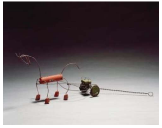
Şekil 13-14: Alexander Calder, Oyuncak Tasarımları, 1926