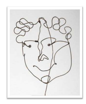
Şekil 6: Crotti, Marcel Duchamp"ın Portresi, 1915, tel, porselen Şekil 7: Alexander Calder, Carl Zigrosser"in Portresi, 1928, tel

Sanatçı portre yapmak istediğinde yalnızca çalıştığı öznenin özelliklerini değil, ayrıca kısmiliğini de yakalama konusunda oldukça yeteneklidir. Çizgisel çalışmalarda bir başka etkilendiği sanatçı Paul Klee olmuştur (şekil 8). Klee"nin tek çizgiyle yaptığı çizimleri dikkat çekecek derecede Calder"in tel karikatürleriyle benzerlik taşımaktadır(Guerreno,1994).