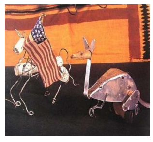
Şekil 17-18: Alexander Calder, Sirk

1926"dan 1930"a kadar Calder eserleri için yeni malzemeler, yeni teknikler ve mekanik hareketler araştırmıştır. Yerinde saymak yerine sürekli sanatsal anlamda gelişmeyi önemseyen sanatçı kendini yenilemek için sürekli araştırmış, örnek almış, kendi potansiyelini keşfetmiştir. Soyut sanatçı Mondrian"ın yalın geometrik soyutlamalarından ve Miro"nun biyomorfik sürrealizm etkili eserlerinden etkilenmis ve bu ikisini birleştiren üç boyutlu eserler üretmiştir. Mondrian'ın geometrik formlarından ve ana renklerinden yararlanmıştır. Bu sekilde sanatçı artık soyut stile geçmiş, soyut yapılarında geometrik elemanları kullanmıştır. Gezegenlerin yapısından etkilenerek oval şekillerde çıkardığı soyut formlarla vine hareketi unutmamıs, heykellerde devinimi her zaman sağlamıştır (Cantz: 1993). Bu türden çalışmalarına mobil heykeller ismini vermiştir.