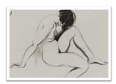
Şekil 1: Boardman Robinson, Çizgisel Çalışma Şekil 2: Alexander Calder, Oturan Nü Çalışma, 1924

Sanatçının burada gördüğümüz tek çizgiden oluşan çalışmaları ve karikatüre olan tutkusu ileride yapacağı tel heykellerine ve sirk ögelerine temel oluşturmuştur. Özellikle okulda çizim konusunda kendisini geliştiren sanatçı bunu mizah konularıyla birleştirerek farklı çalışmalar ortaya koymuştur. Sanatçının sınıf arkadaşı olan Clay Spohn'un Calder'in mizaha olan tutkusu konusunda aşağıda yer alan sözleri, onun sanat hayatı boyunca aslında mizah içeriğini tercih ettiğini de ortaya koymaktadır.