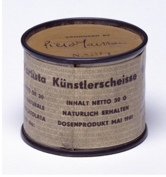
Şekil 3. Piero Manzoni, Sanatçının Dışkısı, 1961 [3]

Sanatçı duygularını ifade ederken belli kurallara bağlı kalarak, toplumun beğenisine göre bir ürün yapmak yerine duygularını kendi iç dünyasını yansıtacak biçimde ifade etmeyi amaçlamaktadır. Dünyayı birebir aktarmanın dışında, kendi duygularıyla dünyayı algıladığı biçimde anlatmak istemektedir. Rüyalarını, sezgilerini, duygularını seçtiği malzemeler ile ifade etmektedir. Sanatçının duyguları ön plandadır ve her şeyden önemlidir. Ancak onları ifade ettiği sürece rahatlar. Sanatçının duygularını hayal gücüyle birleştirerek onu özgürce dışa vurması sadece sanatçının özgür olmasıyla mümkündür. Baudelaire için sanatçı, “iğrenç olan bir şeyi, sanatsal ifade gücüyle güzelliğe dönüştürür; bu da sanatın -ya da sanatçının- şaşılması ayrıcalıklarından biridir” [4].