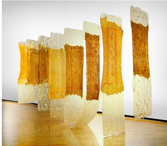
Şekil 4. Eva Hesse, Contingent, 1969 [5]

Bir sanat eserinin derin etkisi kendisini yaratan sanatçının kişiliğinde bulunur. Bir eserin alımı ve değeri sanatçının kendi algıladığı dünya ve değerinden doğar. Bir yapıt yaratıcısının yaşantı ve duygularını üzerinde durularak anlaşılabilir.