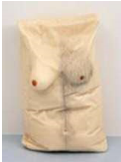
Şekil 6. Robert Gober, Untitled 1990 Balmumu, insan kılı, 61.6 x 43.2 x 27.9 cm.

Sanatçının iç ve dış dünyası, kişiliği, psikolojisi ve biyografik geçmişi sanatçının ürettiği eserlerle sıkı bir bağ içerisinde olduğu söylenebilir. Gober'in de ürettiği yapıtlarla Ruhsal ve deneysel çözümleme yöntemiyle duygularını sanatsal biçimde ifade ederken gündelik hayat nesnelere sanat malzemesi olarak kullanarak yapıtlarındaki denge-oran, biçimsel düzen, renkler ve çizgilerin duygusal değerini kendi kimliğiyle birleştirerek yapıtlarına nasıl yansıttığı gözlenebilir.