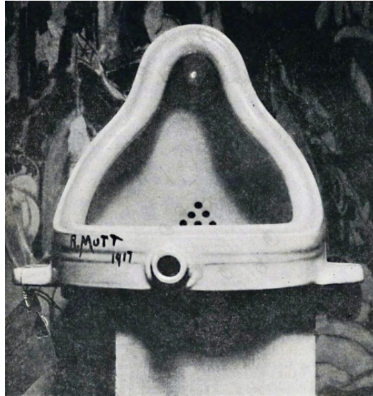
řekil 1. Marcel Duchamp, Çeřme (Fountain), (1917) [1]

Yařadığı dönemin sanat ve nesnesinin sınırlarını sorgulayan Marcel Duchamp "Pisuar" ile estetik sanat anlayışına karřı çıkarak sanatın göz hazzına deęil zihne hizmet eden bir konsepte çekmeyi amaçladığı söylenebilir. Sergi salonuna gönderdiği "Pisuar" (řekil 1) ile sanat yapıtının zanaattan öte fikirselle önemini belirtmek istemesi bakımından bir dönüm noktasının bařlangıcı sayılabilir. "Bu pisuarı Bay Mutt'ın elleriyle yapıp yapmadığınıın önemi yoktur. O bu nesneyi seçmiştir. Hayattan sıradan bir nesne almış, onu yeni bir bakış açısı ve bařlık altında iřlevinden soyutlayacak řekilde yerleřtirmiřtir-o nesne için yeni bir düşünce yaratmıřtır" [1].