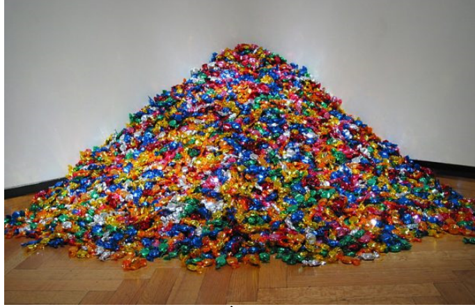
Şekil 7. Felix Gonzalez –Torres, İsimless, Ross' un Portresini, 1991 [8]

Bilimsel temeller üzerine kurulan duygusal etkiler ile bir yapıtın estetik değeri, sadece eserin kendisinin nesnel niteliğine dayandırmanın dışında insanda uyandırdığı duygu durumlarına da dayanır. Gonzalez' de bu yapıtıyla izleyicisine içinde bulunduğu ruh halini ve kendi benliğinde açılan yaraları yani kendi mesajını iletmıştır.