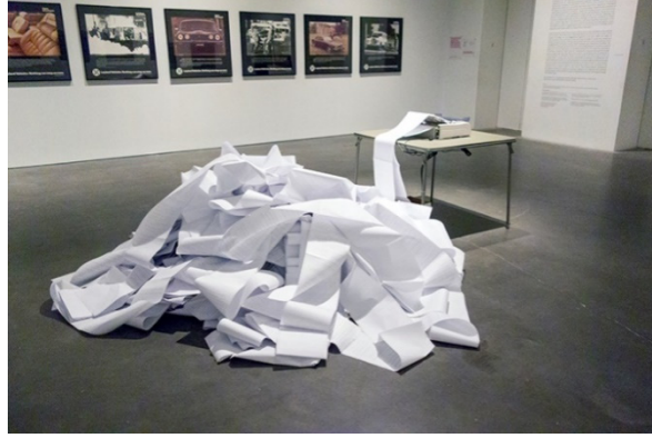
Şekil 5. Hans Haacke, Haberler, 1969/2008. RSS haber beslemesi, kâğıt ve yazıcı [6]

Hakke seçtiği malzemeyi bir yandan ilk anlamı olan asıl kullanım amacından fazla uzaklaştırmadan yaratıcı bir biçimde farklı bir bakış açısıyla zihinde nesnenin anlamını başkalaştırarak sanat yapıtına dönüştürmüştür. Gündelik hayat nesnesinin sanatsal bağlamda kullanılması hem malzemenin yabancılaştırılarak bir teknik geliştirmek olarak görülür hem de alımlayıcının da şoka uğratılması niyeti de söz konusudur.