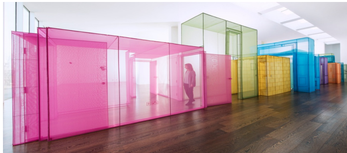
Şekil 8. Do Ho Suh, Passage/s, 2017 [10]

Sanatçı yapıt üretirken biçim üzerinden bir dizge ile duygularının yanında anlam üretir. Biçim anlamı sürekli biçimde anlaşılabilir kılmayı ve yorumlamayı da gerektirir. Ortaya çıkan sanat yapıtını ötekilerden ayıran duygusal bir yaşantı nesnesi, ona bireyselliği, özgünlüğü ve iç bütünlüğü olma özelliği kazandıran tüm öğeler biçim ile ilgilidir. Sanatta çoğu zaman biçimin kavranması daha güçtür. Bunun yanında yapıtın estetik olarak kabul görülmesi de biçim ile ilgilidir. Yapıtın her bir birimi diğer birimlerle ve yapıtın bütünüyle bir ilişki içindedir. Artık sıradan ve günlük olan nesnelere sanatçının ifade biçiminin duygularıyla birlikteliğinin somutlaşmış halidir.