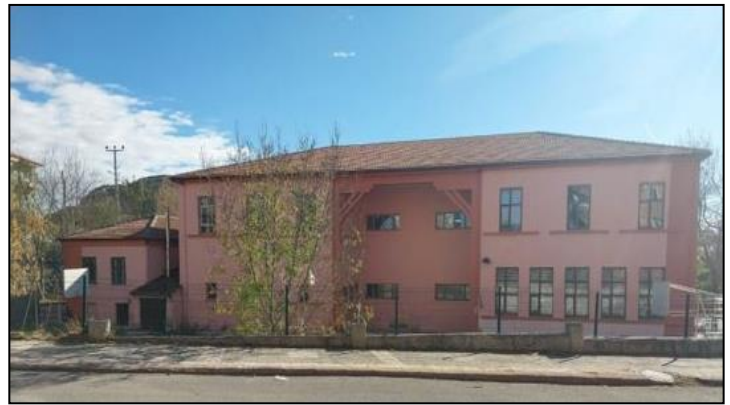
ŞEKİL 6. Aksaray Gazi İlkokulu Kuzey-Batı Cephe Görünümü