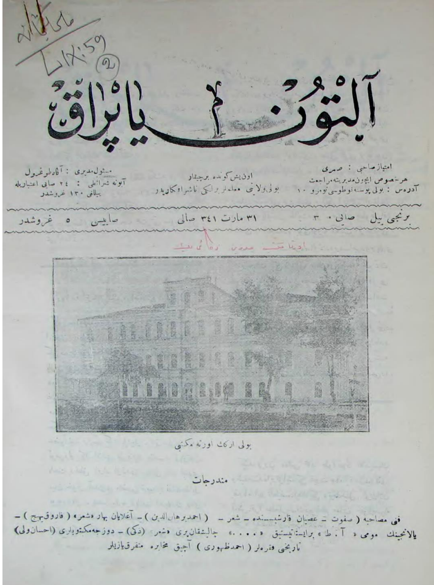
Fotoğraf, “Bolu Erkek Orta Mektebi”, nu. 3 (31 Mart 1341 / 31 Mart 1925), İç Kapak A.