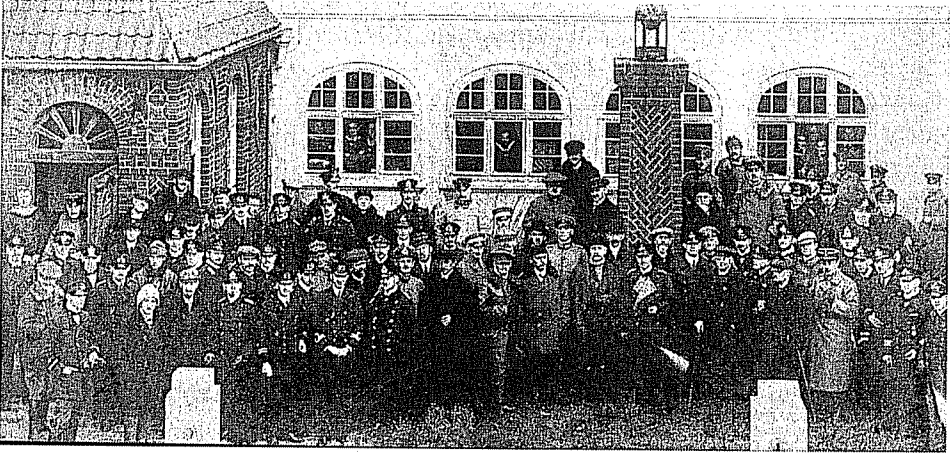
Resim 1: 1915 yılında Almanya'ya denizaltıcılık stajına gönderilen Türk subayları, Alman eğitmen ve diđer müttefik ülke personeliyle birlikte. Polat vd. 2003, 193.

29 Aralık 1916'da Almanya Dışışleri Bakanlıđı'nda gündeme getirilmiş, ancak milyarlarca marka mal olacak böyle bir projeye sıcak bakmama kararı alınmıştır. Alman Hükümeti alınan karar geređince güceneceđini düşündüđü Cemal Paşa'yı, 1917 yılı Ocak ayı içerisinde Almanya'ya davet etmeye karar vermiştir 20 . Bu davet üzerine, 25 Ağustos 1917'de Almanya'ya giden Cemal Paşa, 29 Ağustos 1917'de Alman Deniz Kuvvetleri Müsteşarı Oramiral Capel ile bir görüşme yapmıştır 21 . Bu görüşme sonucunda, Osmanlı Donanması 95 Milyon Mark karşılığında ve savaş sonrasına bırakılmak kaydıyla Goben, Breslau, S 56, S 60, S 62, V 77-80, G 89-90, G 92-93 destroyerleri ile U 82, U 84, U 86, UB 62, UB 63, UC 63-65 denizaltılarını satın alacaktır. Ancak Birinci Dünya Savaşı'nın her iki ortak tarafından mağlubiyetle sona ermesi bu planı boşa çıkarmıştır 22 .