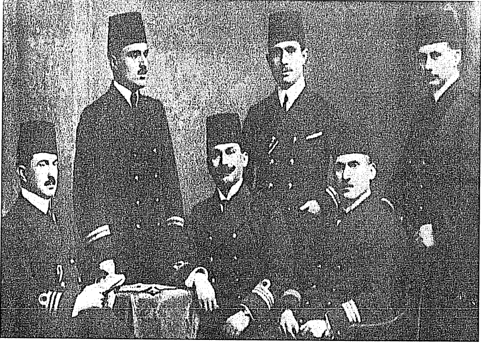
Resim 2: 5 Şubat 1915'ten itibaren Almanya'da Vulcan isimli denizaltıda verilen Nüve Denizaltıcılık Kursu'na katılan Türk Deniz Subayları. Polat vd. 2003, 192.

Almanya'dan satın alınacağı hesap edilen yeni denizaltılar için yetişmiş eleman ihtiyacı doğmuştu. Bu çerçevede 1914-1918 yılları arası yüzlerce Osmanlı denizcisi için denizaltı eğitim seferberliği başlatılmıştır 23 .