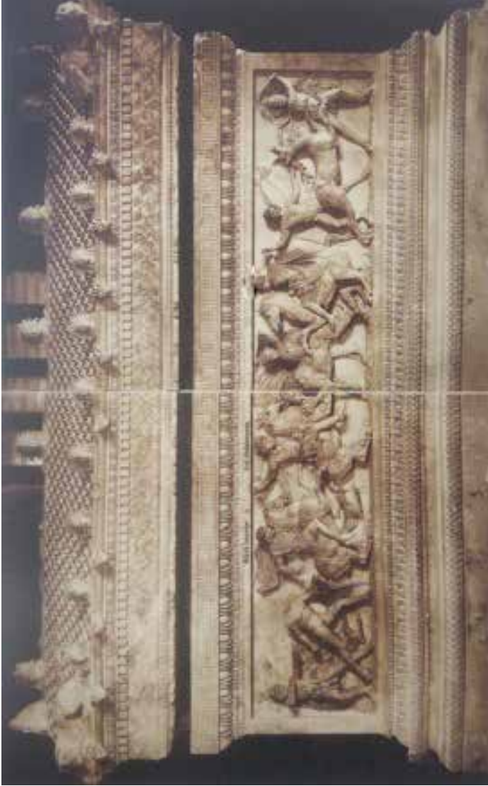
İskender Lahti Büyük Yüz: Aslan ve Geyik Avı ( Nezih Başgelen, İstanbul Arkeoloji Müzesi İskender Lahti, s. 10-11 )