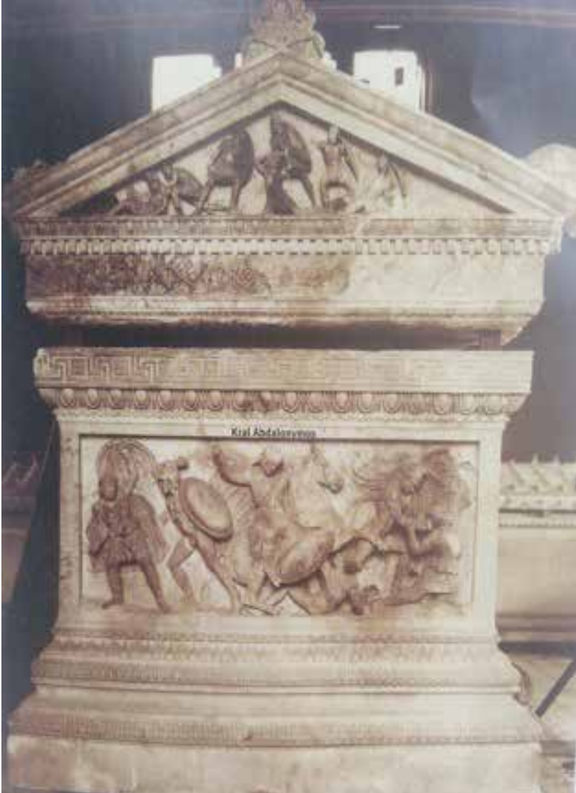
İskender Lahdi Küçük Yüz: Makedonyalılar ve Persliler Arasındaki Savaş Alınlığı: Makedonyalılar Savaş Sahnesi ( Nezih Başgelen, İstanbul Arkeoloji Müzesi İskender Lahti, s. 14 )