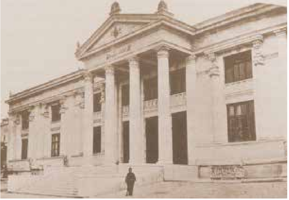
Lahitler Müzesi/Müze-i Hümayun (1891) (Wendy M. K. Shaw, Osmanlı Müzeciliği , s. 220)

Sanayi-i Nefise Mektebi Fenn-i Mimari hocası olan Vallaury tarafından çizilen müzenin giriş kapısı antik bir tapınak cephesine benzetilmiştir. Bu benzerliği ile Sayda kazılarında çıkan ve İskender Lahdi ile birlikte getirilen Ağlayan Kadınlar Lahdi 'nden esinlendiği söylenir 27 .