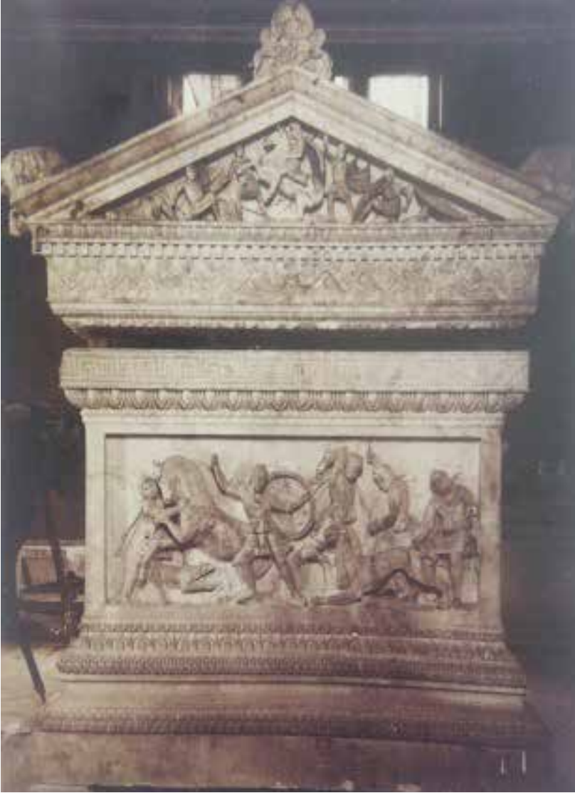
İskender Lahdi Küçük Yüz: Av Manzarası Alınığı: Makedonyalılar ve Persliler Arasındaki Savaş Sahnesi ( Nezih Başgelen, İstanbul Arkeoloji Müzesi İskender Lahti, s. 14 )