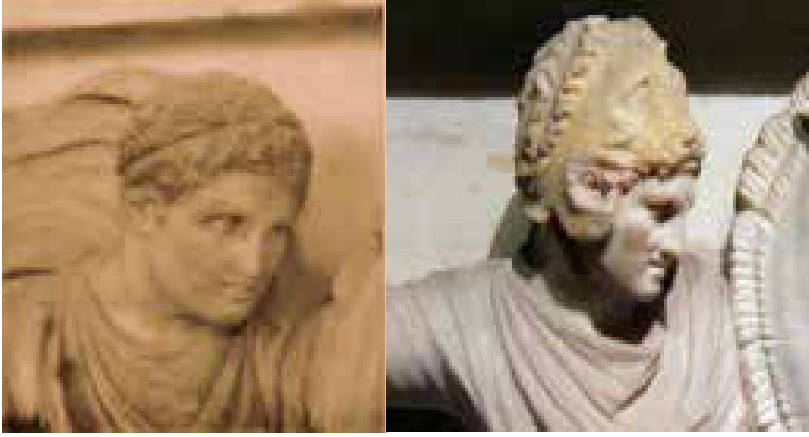
Büyük yüz Av Manzarası'nda İskender Portresi / Büyük yüz Savaş Sahnesi'nde İskender Portresi ( Adolphe Thalasso, Les Arts Revue, s. 21 )

Hatta büyük yüzdeki av manzarasının İskender'i burada başında krallara mahsus bir şerit ile tanınır. Bu simada olduğu gibi savaş sahnesindeki büyük yüzde görülen ve kim olduğu başındaki aslan postuyla onaylanmış ve belirlenmiş bulunan İskender'e bunun benzerliği olmasaydı, İskender'in yerine bırakmış olduğu kumandanlardan biri olduğu iddia edilebilirdi.