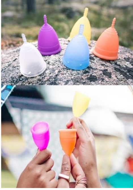
Şekil 1. Menstrüel kap

Hemşireler, kadın sağlığını etkileyen menstrüel hijyen yönetiminde önemli rollere sahiptir. Hemşirelerin bu konudaki yenilikleri takip etmeleri, yeniliklerin kadın sağlığına etkilerini ortaya koyan araştırmalar yapmaları ve elde edilen sonuçlarla bu yenilikleri hizmetlerine eklemeleri oldukça önemlidir. Bu doğrultuda derlemede; bir yenilik olarak düşünülen ve Türkiye’de oldukça az bilinen ve uygulanan bir ürün olan menstrüel kabın yapısı, nasıl kullanıldığı, dünden bugüne kullanım durumu ve bu konuyla ilgili yapılan çalışmalar, menstrüel kabın avantaj ve dezavantajları ile bu konuda hemşirenin rolleri ele alınmıştır.