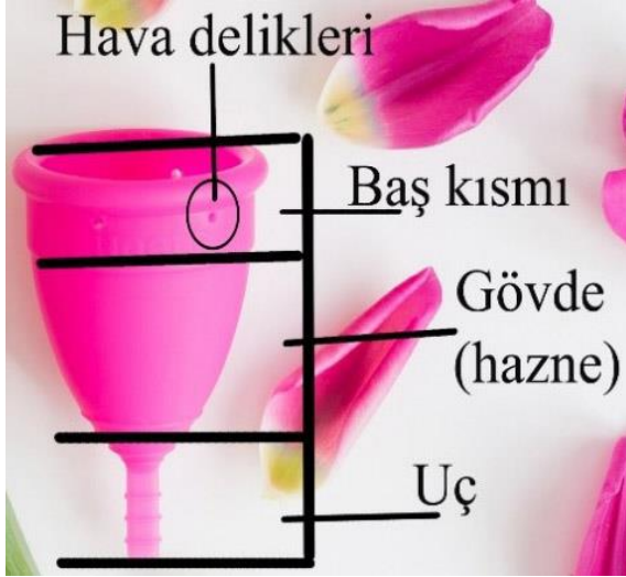
Şekil 2. Menstrüel Kap Bölümleri