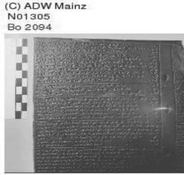
Resim 3: Hitit Kanunları.

§ 13 (33) Eğer bir kimse özgür bir kişinin burnu(nu) şiddetle ısırır, 1 mina gümüş versin.