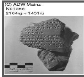
Resim 2: Hitit Kanunları.

Yukarıdaki sayı tablosunda her bir çivi işareti bir rakama işaret etmektedir. Birden ona kadar olan sayılar dikey çivilerle, 10 ve onun katları ise yatay çiviler ve yatay ve dikey çivilerin birleşiminden oluşan bir sistemle ifade edilmiştir.