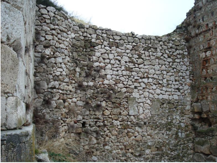
Foto. 23- Eğirdir Kalesi. Sur duvarının doğu yüzündeki muhdes duvar.