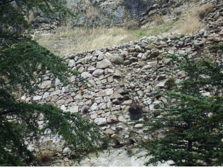
Foto. 21- Eğirdir Kalesi. Kalenin üst kesiminde ve güney-doğu yönündeki teraslar üzerinde mevcut sur kalıntıları.