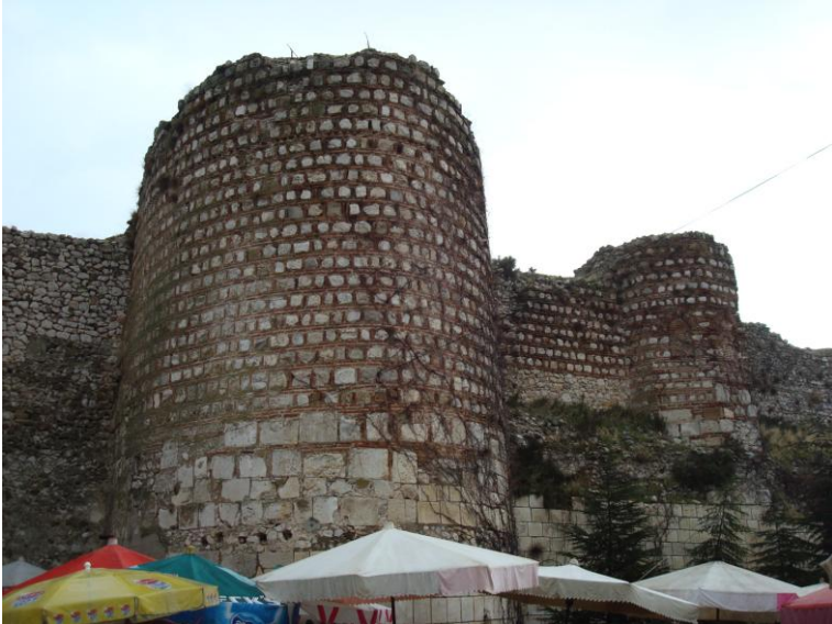
Foto.4- Eğirdir Kalesi. Silindirik Burç.