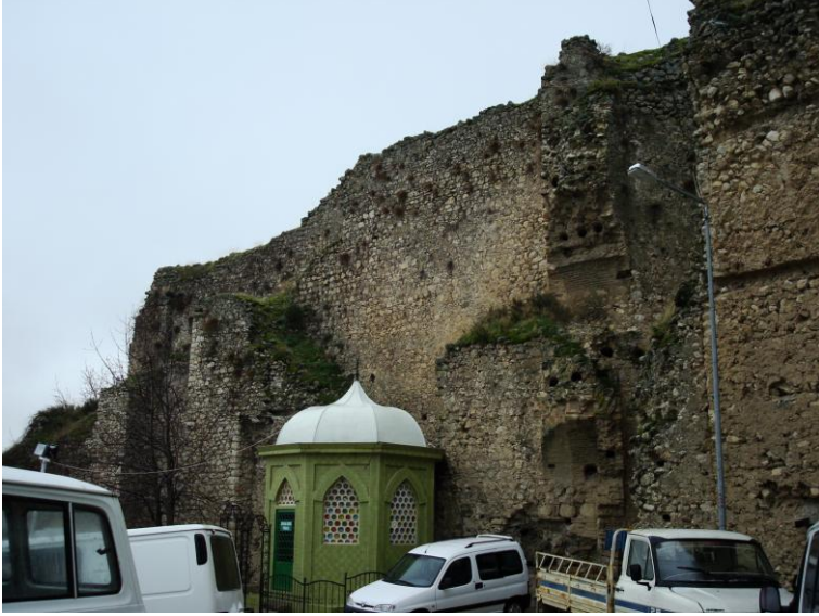
Foto.9- Eğirdir Kalesi. Sur duvarının doğu yüzü.