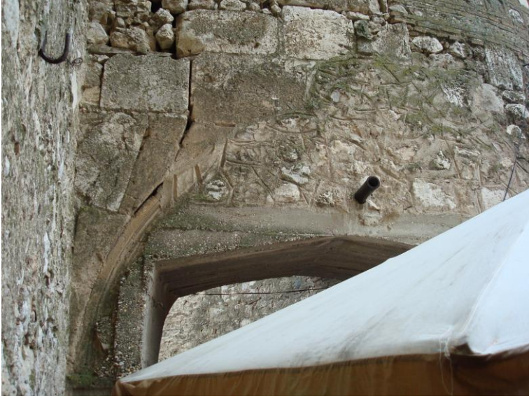
Foto. 17- Eğirdir Kalesi. Bugünkü kale kapısındaki muhdes müdahale.