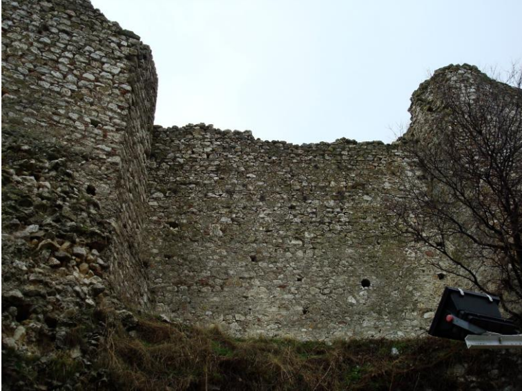
Foto. 20- Eğirdir Kalesi. Kalenin üst kesimindeki sur duvarı.