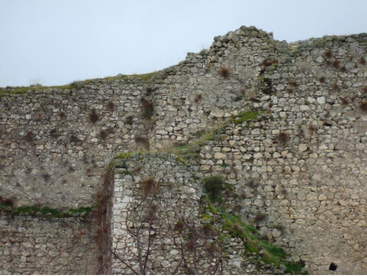
Foto. 22- Eğirdir Kalesi. Sur duvarının doğu yüzündeki merdivenler.