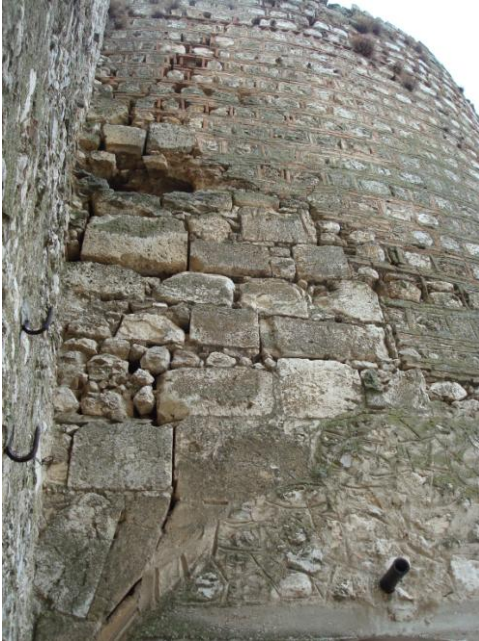
Foto. 18- Eğirdir Kalesi. Bugünkü kale kapısındaki muhdes müdahale.