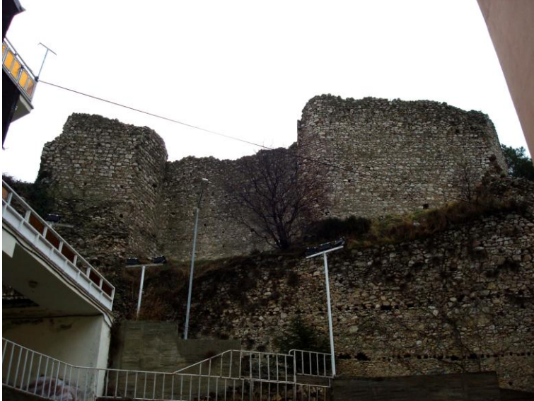
Foto.8- Eğirdir Kalesi. Kuzey yönünde uzanan sur duvarı ve burçlar.