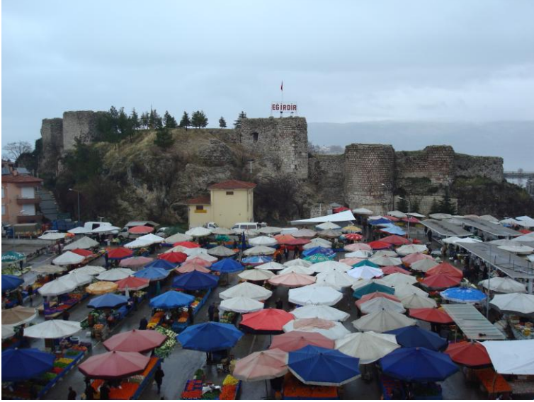
Foto.1- Eğirdir Kalesi. Hükümet Meydanı'ndan.