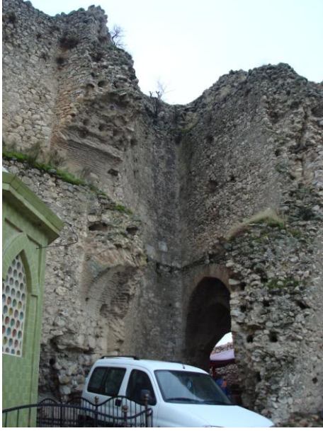
Foto.11- Eğirdir Kalesi'nin şimdiki kapısı ve yıkılmış asma katlar.