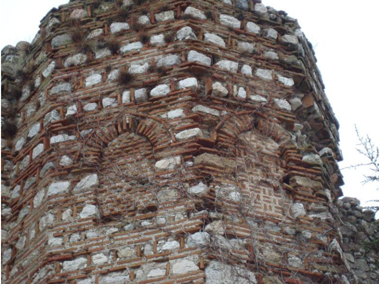
Foto. 16- Eğirdir Kalesi. Beşgen planlı burç üzerindeki sonradan kapatılmış pencereler