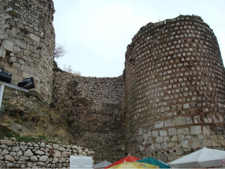
Foto.6- Eğirdir Kalesi. Moloztaş örgülü muhdes duvar.