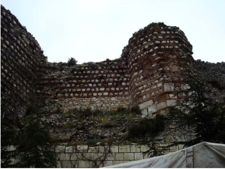
Foto.3- Eğirdir Kalesi. Beşgen planlı burç.