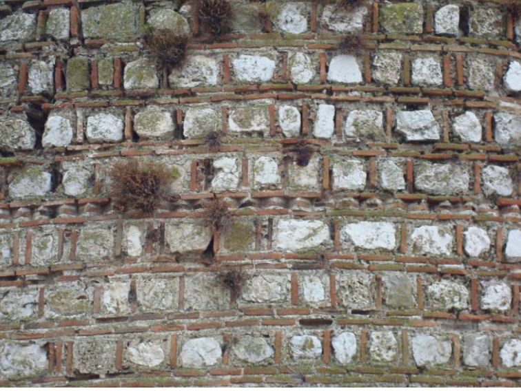
Foto.5- Eğirdir Kalesi. Almasıık duvar tekniđi.