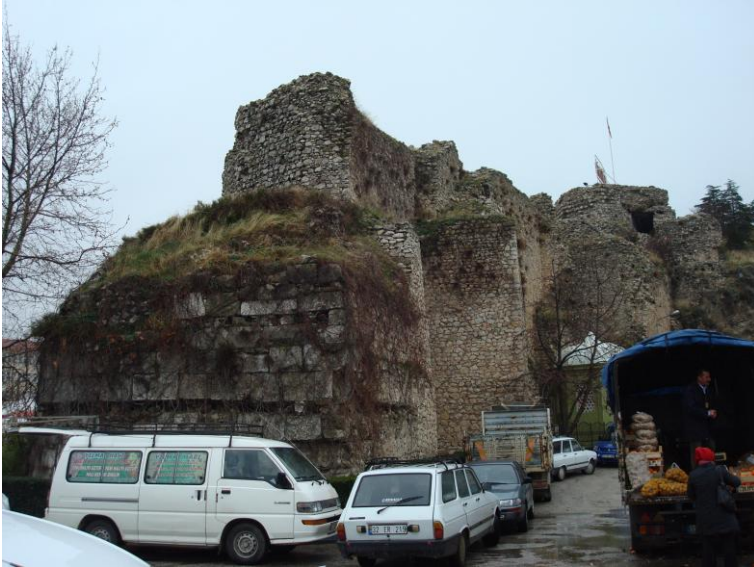
Foto.2- Eğirdir Kalesi. Güney köşesindeki poligon burç.