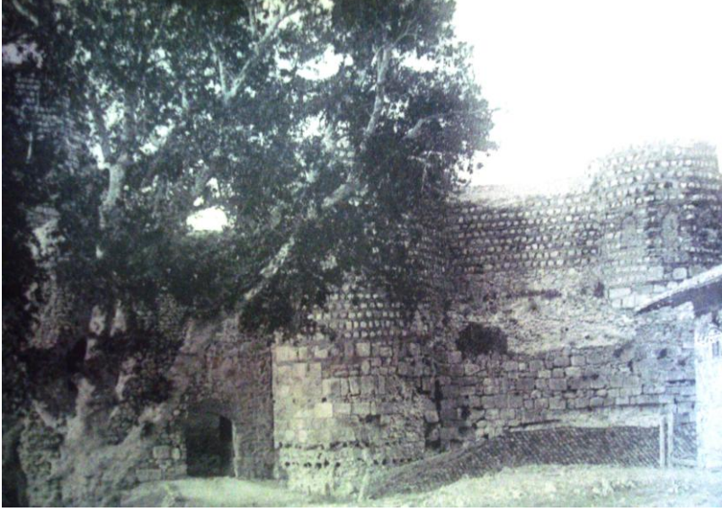
Foto. 19- Eğirdir Kalesi. 19. Yüzyıl sonlarında kale kapısı (F. Sarre'den)