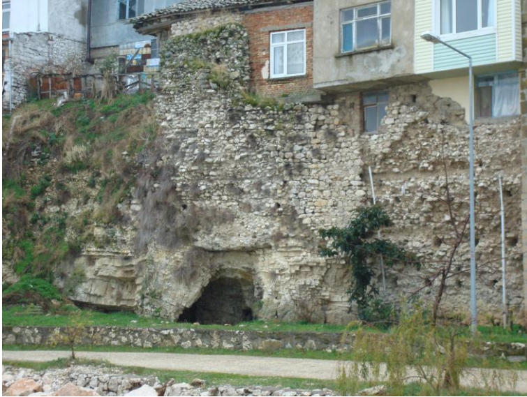
Foto. 12- Eğirdir Kalesi. Eski kenti çevreleyen surların günümüze ulaşan kalıntıları.