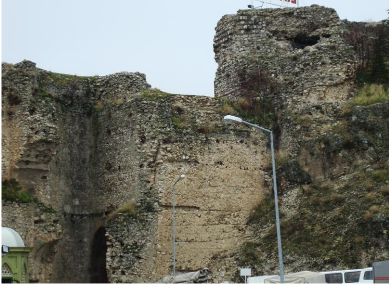
Foto. 24- Eğirdir Kalesi. Sur duvarının doğu yüzünde kapatılan eski kapının yerine inşa edilen muhdes duvar.