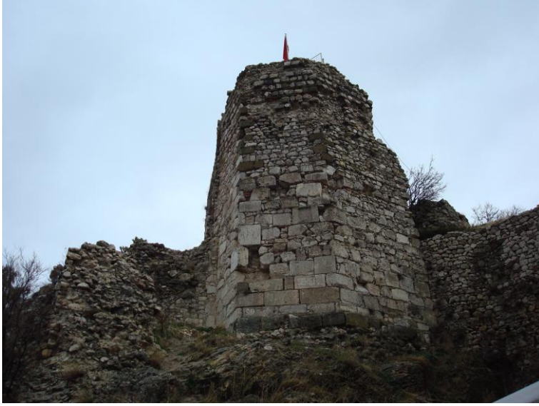
Foto.7- Eğirdir Kalesi. Çokgen planlı burç.