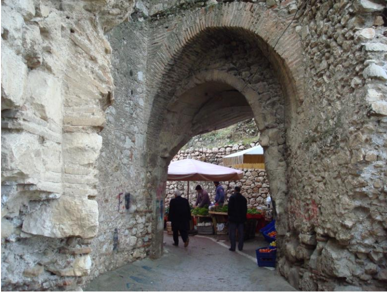
Foto.10- Eğirdir Kalesi'nin şimdiki kapısı.