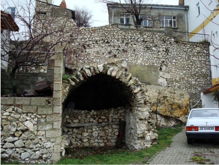
Foto. 14- Eğirdir Kalesi. Kayıkhanesi işlevi görmüş olması muhtemel tonozlu yapı kalıntısı.