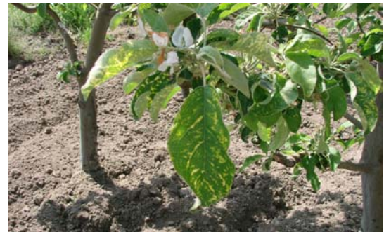
Şekil 1-Elma mozaik virüsü'nün elmadaki sistemik mozaik şeklindeki belirtisi

2008-2009 yıllarında Ukrayna-Kiev' de gerçekleştirilen sörveylerde 18 adet elma, 3 adet gül, 2 Berberis thunbergii , 3 gürgen, 1 fındık olmak üzere toplam 27 adet bitki örneği toplanmıştır. Bitki örneklerinin üzerlerindeki hakim belirti sistemik mozaik şeklinde olup hastalığın elmalardaki belirtisi Şekil 1'de gösterilmektedir. Ukrayna'da enfeksiyon yöresel elma çeşitlerinde (Pgonagolol (L1T2-2), Champion (L5T2-7), Vrushka (L4T2-1)) tespit edilmesine karşılık, Türkiye'de ise entansif üretim bölgelerinden oluşan araştırma bölgesinde sadece son yıllarında ekim alanı hızla gelişen Granny Smith elma çeşidinde saptanmıştır. Daha önce yapılan bir çalışmada, ülkemizdeki farklı elma çeşitlerinde var olduğu bildirilmesine karşılık (Akbaş & İlhan 2005), bu çalışmada sadece G. Smith çeşidinde mevcut ve yaygın olduğu belirlenmiştir. Araştırma bölgesinde ekimi yapılan diğer elma türlerinde (Starking, Golden Delicious ve Fuji) hastalık belirtilerine rastlanmamış ve bunlardan örnekleme yapılmamıştır. Hastalık ayrıca tüm Karadeniz bölgesi boyunca yer alan fındık ekim alanlarında mevcuttur.