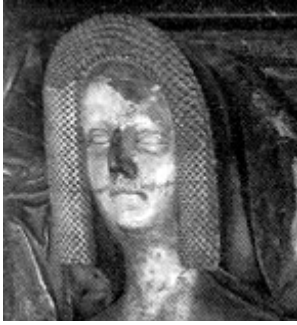
Omuza kadar inen peçe ve başlık