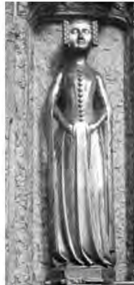
Önü düğmeli Elbise

Psalter. L. www.medievaltailor.com/clas%20hadouts/14thClothing1:22.06.2011.