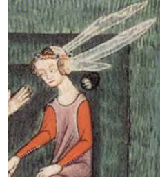
Boynuz denilen başlık

Psalter. L. www.medievaltailor.com/clas%20 hadouts/14thcClothing1 :22.06.2011.