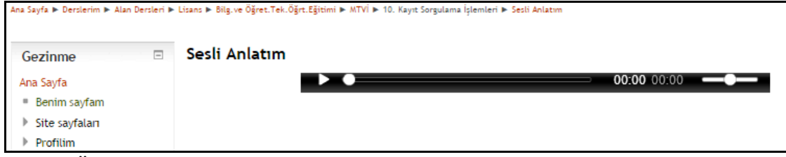
Şekil 5. Örnek sesli konu anlatımı