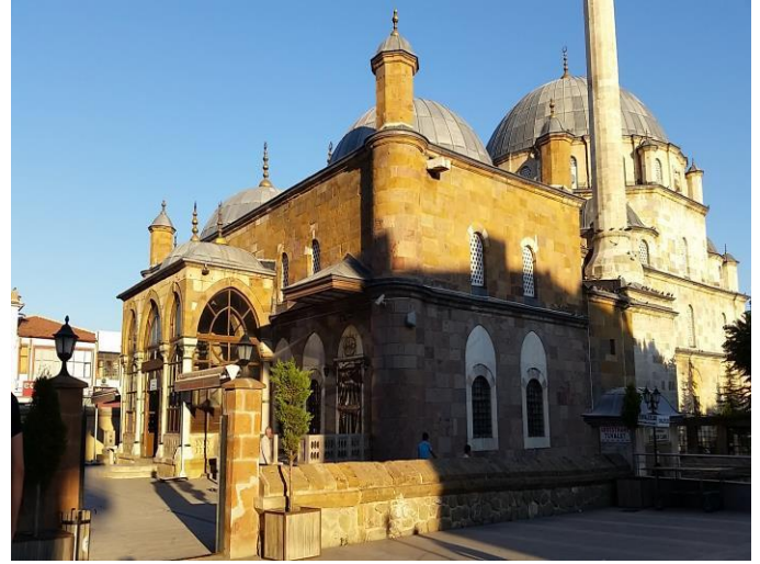
Şekil 2. Çapanoğlu Cami

Bu eserlerden Saat Kulesi (Şekil 1) ve Çapanoğlu Cami (Şekil 2) en çok ziyaret edilen yerlerdendir. Yozgat şehrinde turizm alanlarının yeteri kadar tanıtımının yapılmamış olması ziyaretçi sayısının da yetersiz sayıda olmasına neden olmaktadır.