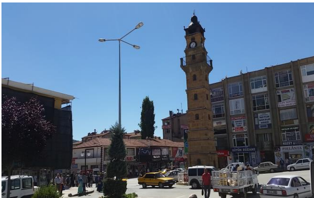
Şekil 1. Yozgat Saat Kulesi

Bunlar dışında kentteki birçok höyük, kent merkezine 3 km. uzaklıktaki Çeşka Kalesi, Sarıkaya ilçesindeki Roma Hamamı, Merkez ilçeye bağlı Şahmuratlı köyündeki Kerkenes Antik Şehri kentin başlıca kültür turizmi mekânlarındandır. Bunlar dışında kent merkezinde çok sayıda tarihi sivil mimari eser bulunmaktadır (Yozgat Belediyesi, 2008).