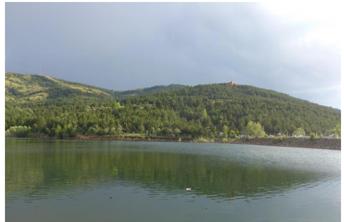
Şekil 3. Çamlık Milli Parkı

Çamlık Milli Parkı, turizm bakımından en önemli merkezlerden biri olup kentin rekreasyonel ihtiyacını karşılaması açısından önemlidir (Akarsu, 2007). Çamlık Milli Parkı'nın korunması ve bugünkü ticari ve kamu hizmetlerinin yoğun olarak görüldüğü turizm aktiviteleri ile geliştirilmesi, Yozgat'taki turizm istihdamının artması ve şehrin geleceği bakımından önemlidir.