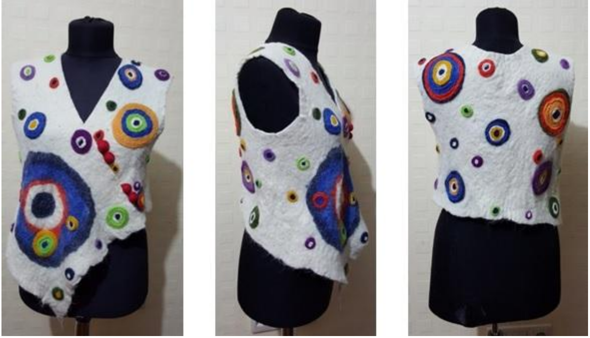
Nazar teması ile hazırlanan giysi tasarımı