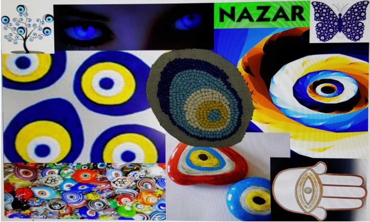
Şekil 1. Hikâye panosu

Nazar boncuğunun canlı renkleri tasarımlara ilham vermiştir. Türk kültüründe önemli bir yere sahip olan keçenin ayrıca küçük boncuklarla oluşturulan nazar boncuğu motiflerinin kot kumaşla kombine edilerek tasarımlarda kullanılmasına karar verilmiştir. Kullanılması düşünülen materyallerin özellikleri göz önünde bulundurularak yelek tasarımları hazırlanmıştır.