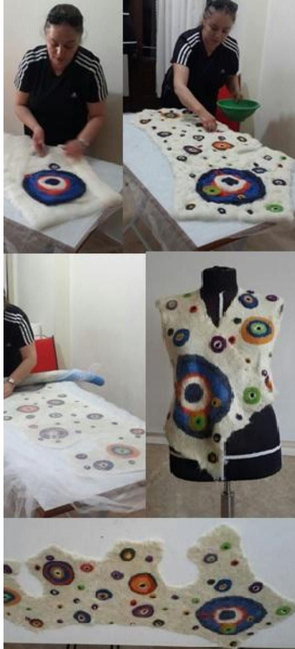
Üretim sürecinden görüntüler

Yeleğin omuzları elde kaynaştırma dikişi ile tutturulmuştur. Yeleğimizin kapaması için keçeden toplar hazırlanarak düğme olarak kullanılmıştır.