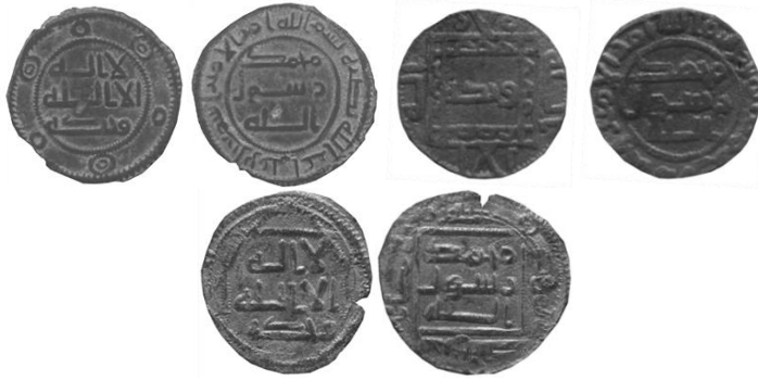
4. Grup 5. Grup 6. Grup