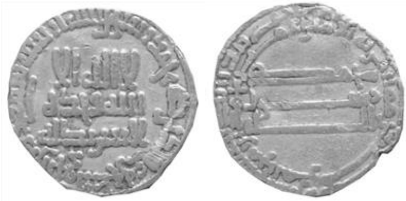
Fotoğraf 4: Abbâsî Halifesi Ebû Musa Muhammed el-Emin'in Sikkesi (Envanter No: 6433)