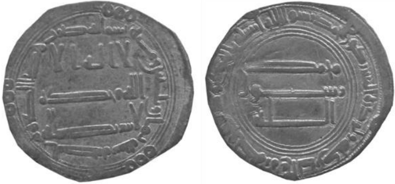
Fotoğraf 5: Abbâsî Halifesi Ebû Cafer Abdullah el Mansur'un Sikkesi (Envanter No: 19)