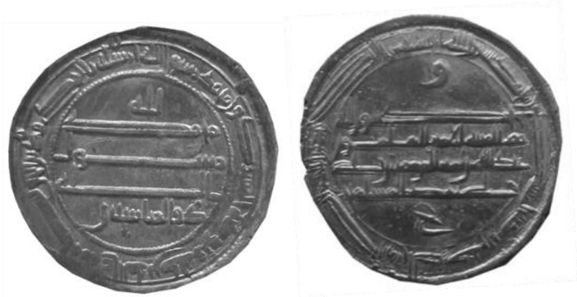
Fotoğraf 7- Abbâsî Halifesi Ebû Cafer Abdullah el-Me'mûn'un Sikkesi (Envanter no: 25)

Sikkelerin arka yüz yazılarının başlangıcında "Allah" ibaresi veya "vav" harfi görülmektedir.