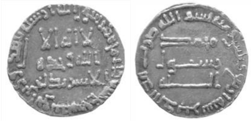
Fotoğraf 3: Abbâsî Halifesi Ebû'l Abbâs el-Seffâh'ın Sikkesi (Envanter No: 105. grup)