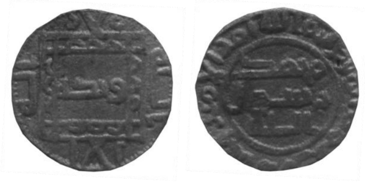
Fotoğraf 13- Abbâsî Valilerinden Hişâm bin Amr'ın Sikkesi (Envanter no: 2666)