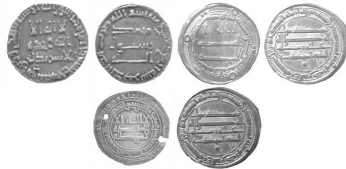
1. Grup 2. Grup 3. Grup

Bunlar; Yazılı kompozisyonlar, Tam Daire Konturlu Tek Sıra Çevre Yazılı Kompozisyonlar, Tam Daire Konturlu Ön Yüzü Çift Sıra Çevre Yazılı Kompozisyonlar, Tam Daire Konturlu Arka Yüzü Tek Sıra Çevre Yazılı Kompozisyonlar, Dikdörtgen Çerçevesi Tek Sıra Çevre Yazılı Kompozisyonlar ve Sekizgen Çerçevesi Tek Sıra Çevre Yazılı Kompozisyonlardır.