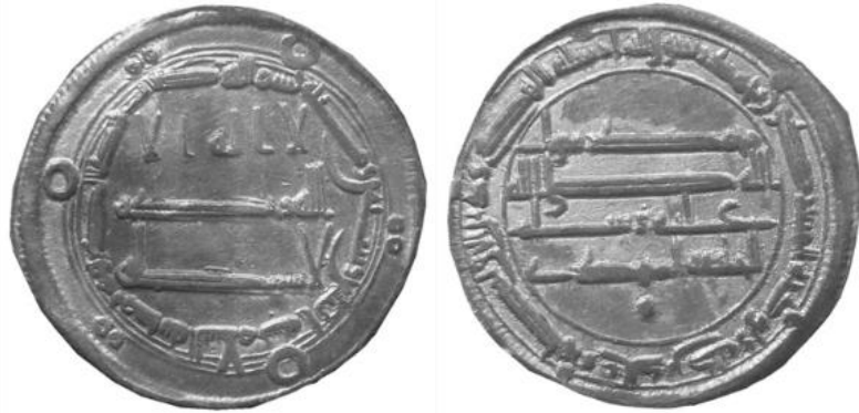
Fotoğraf 6- Abbâsî Halifesi Ebû Abdullah Muhammed el-Mehdi'nin Sikkesi (Envanter no: 17)

Bu noktalı sikkeler el-Mehdi döneminde kesilmiştir 9 .