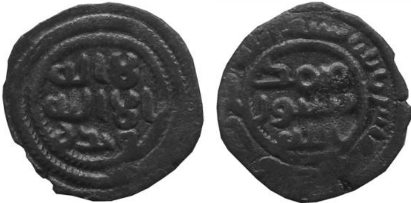
Fotoğraf 11- Abbâsî Halifesi Ebû Cafer Harun el-Reşid'in Sikkesi (Envanter no: 222)