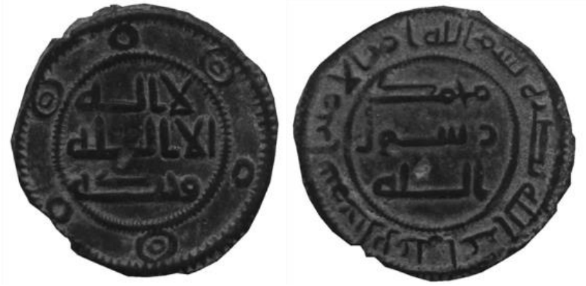
Fotoğraf 10- Abbâsî valilerinden İsmail bin Ali'nin Sikkesi (Envanter no: 2381)