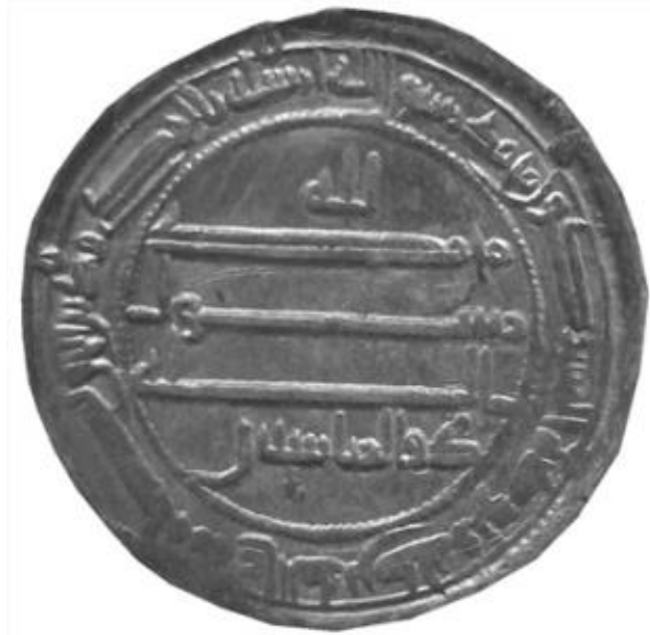
Besmele Bahçesi/Kûfi (A.Alparslan'dan)