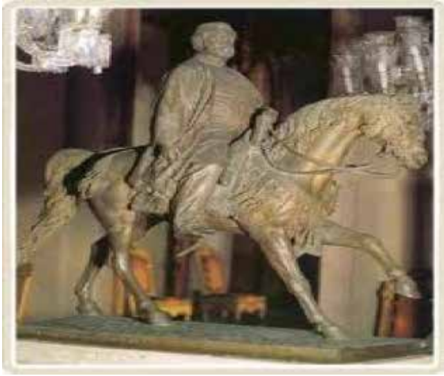
(Sultan Abdülaziz'in Beyberbeyi Müzesi'ndeki Heykeli) 37