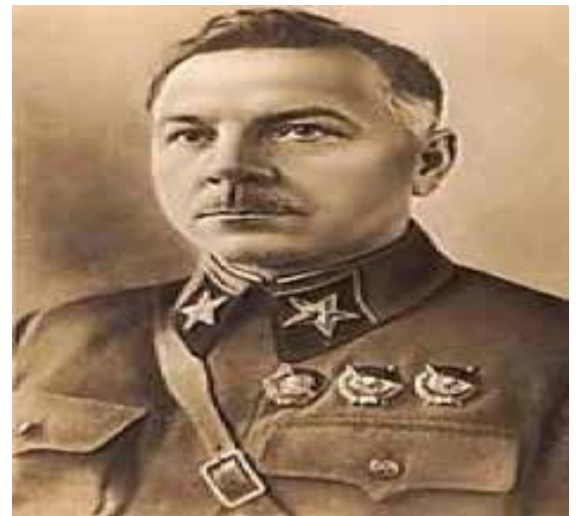
Türkiye Cumhuriyeti'nin kuruluşunun 10.yıl kutlamalarına davet edilen Taksim Anıtı'nda olduğu iddia edilen general Kliment Efremoviç Voroshilov (ortada) ilk kez 1933 yılında Ankara'ya gelmiştir. (Rusya Federasyonu Ankara Büyükelçiliği Sitesi-01.04.2016)