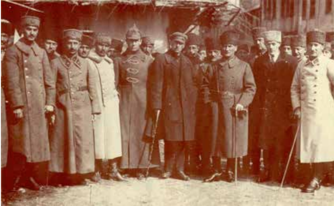
Fotoğraf. (Büyük Taarruz'dan önce Konya civarında yapılan teftiş gezisi sırasında Mustafa Kemal, İsmet İnönü, Rusya büyükelçisi S.Aralov, askeri ataşe K.Zvonarev ve Azerbaycan Büyükelçisi. Abilov, 23 Mart 1922 ).

Taksim'de yaptırılan Cumhuriyet Anıtı, Atatürk döneminde meydana getirilen anıtların içinde en önemlisidir. Taksim Cumhuriyet Anıtı ve Taksim Meydanı sadece Cumhuriyet dönemi İstanbul'unun değil, yeni Türkiye'nin sembolü haline gelmiştir. Anıtın yapımına 1925 yılında başlanmış ve 1928 yılında anıtın yapımı tamamlanmıştır. İtalyan heykeltıraş Pietro Canonica'ya yaptırılan anıt, iki genç Türk; Hadi (Bara) Bey ve Sabiha (Bengütaş) Hanım'ın yardımlarıyla tamamlanmıştır. 8 Ağustos 1928'de de 30 bin İstanbullu'nun katılımıyla TBMM Başkanı Kazım Özalp tarafından açılmıştır.