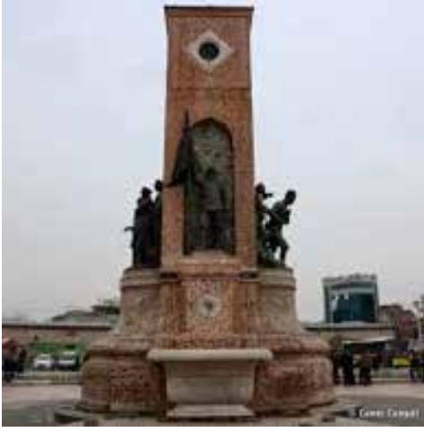
Figür 6. (Doğu cephesindeki asker heykeli.)