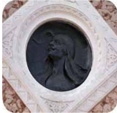
Batı cephesinde bulunan asker heykeli üzerindeki kadın portresi peçesiz ve gökyüzüne bakan mutlu bir yüz ifadesine sahiptir.)