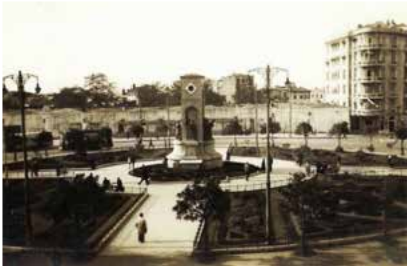
1929 YILINDA TAKSİM MEYDANI