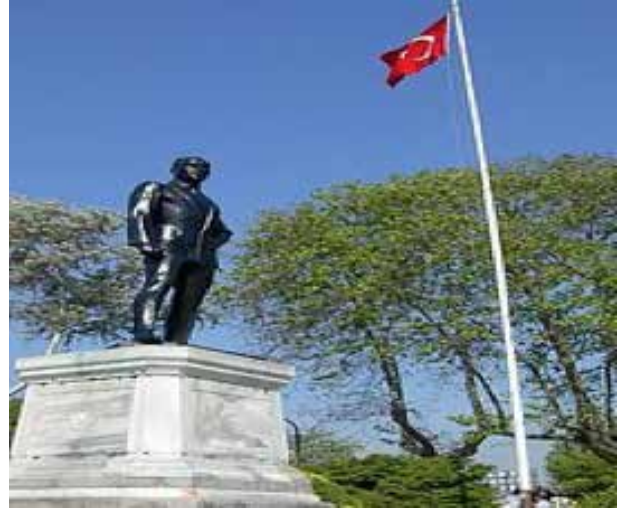
(Sarayburnu'nda Mimar Heinrich Krippel 25 Ağustos 1925'te başlanıp 1926 yılında bitirilen ilk Atatürk heykeli)