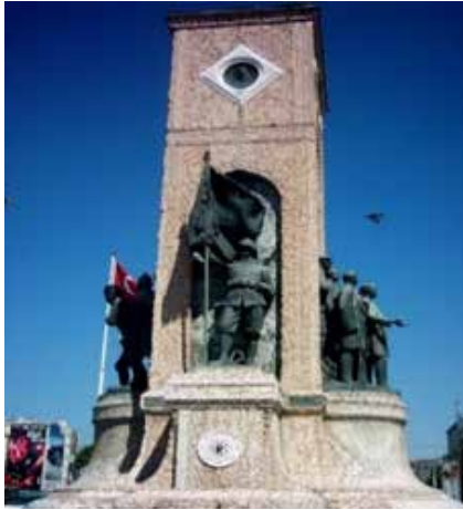
Figür 4. Batı cephesinde bulunan asker heykeli.)

Anıtın yan yüzlerinde kahramanlığın sembolü olan sancak taşıyan birer asker heykeli, üstlerindeki madalyonlarda ise birer kadın portresi yer almaktadır. Doğu cephesindeki kadın portresi peçeli ve mutsuz, batı cephesinde bulunan kadın portresi peçesiz ve gökyüzüne bakan mutlu bir yüz ifadesine sahiptir.