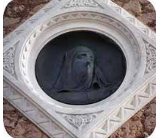
Figür 7. (Doğu cephesindeki asker heykeli üzerindeki kadın portresi peçeli ve mutsuzdur.) 47