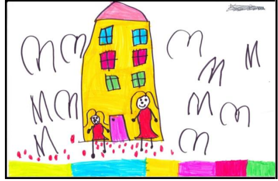
ÇD-77 kodlu çocuğun resmi