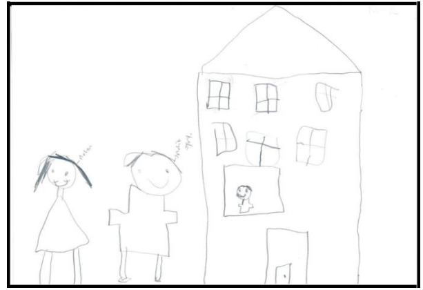
ÇÖ-42 kodlu çocuğun resmi

"Resimde müdür sana ne diyor?" sorusuna çocukların verdikleri cevapların içerik analizi sonucunda 3 alt tema oluşmuştur. Bu alt temalar; olumlu sözlü-sözsüz iletişim kurma, uyarıcı dil kullanma ve nötr alt temalarıdır. Olumlu sözlü-sözsüz iletişim kurma alt teması, okul yöneticisinin olumlu ve uygun bir iletişim içerisinde olduğu belirtilen cevaplardan oluşturulmuştur. Çocukları uyarıcı veya ikaz edici müdür iletişimi cevapları uyarıcı dil kullanma alt temasını oluşturmaktadır. Nötr alt teması ise konu ile ilgili olmayan veya ne olumlu ne de olumsuz ifadeler içeren cevapları içermektedir. Alt temaların yüzde ve frekans analizi incelendiğinde, çocukların %55,45'inin olumlu sözlü-sözsüz iletişim kurma alt temasına, %17,82'sinin uyarıcı dil kullanma alt temasına ve %26,73'ünün ise Nötr alt temasına uygun cevaplar verdiği tespit edilmiştir. "Resimde müdür sana ne diyor?" sorusuna ait çocukların verdikleri cevaplardan bazı ham veriler aşağıda verilmiştir.