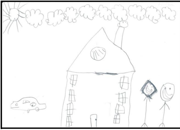
ÇÖ-66 kodlu çocuğun resmi

ÇÖ-42. "Okulun içinde kendi odasında. Telefonla konuşuyor." (İdari Süreçle İlgilenme)