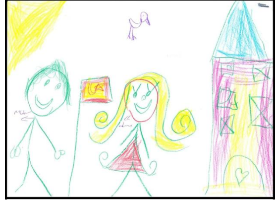
ÇÖ-2 kodlu çocuğun resmi

“Müdürünü bir şeye benzetmek istersen neye benzetirsin? Neden?” sorusuna çocukların vermiş oldukları cevaplar incelenmiş olup, cevaplardan 4 alt tema oluşmuştur. Bu alt temalar; davranışsal özelliklerine göre, fiziksel özelliklerine göre, mesleki hiyerarşi konumuna göre, üretici/yaratıcı olma durumuna göre ve nötr’dür. Araştırmaya katılan çocukların %49,51’i fiziksel özelliklerine göre, %21,78’i davranışsal özelliklerine göre, %6,93’ü mesleki hiyerarşi konumuna göre, %0,99’u üretici/yaratıcı olma durumuna göre cevaplar vermiştir. Çocukların %20,79’u ise nötr özellikte cevaplar verdiği veya cevap vermediği saptanmıştır. Çocukların verdiği cevaplardan oluşturulan alt temalara ait ham verilerden örnekler şu şekildedir: