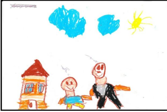
ÇD-28 kodlu çocuğun resmi

ÇÖ- 101. "Başbakana. Çünkü o da okulu yönetiyor." (Mesleki Hiyerarşi Konumuna Göre)