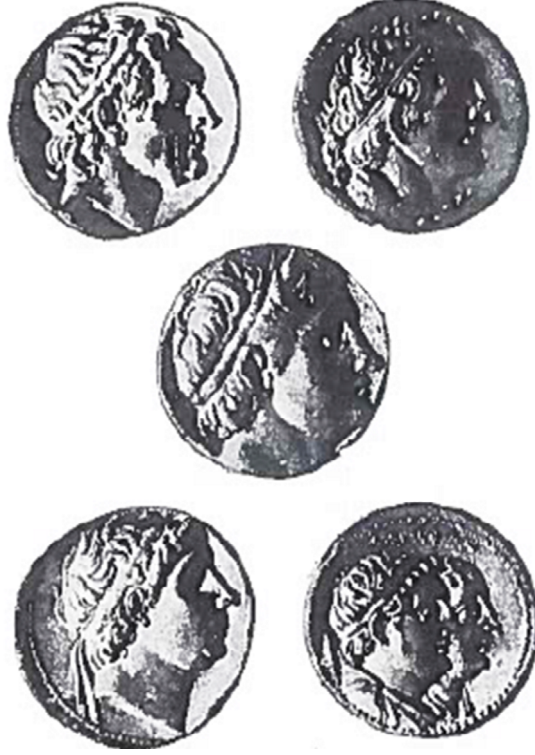
Şekil 2. Hellenizm çağı krallıklarının sikke portreleri. 1. Selevkos I, 2. Ptolemaios I, 3. Demetrios Poliyorketes, 4. Antiyohos I, 5. Ptolemaios II ve Arsinoe. (Arif Müfid Mansel, Ege ve Yunan Tarihi , Ankara, 1995, s. 460.)

Bu döneme genel bir değerlendirme yapacak olursak, Büyük İskender'in ölümünden sonra, Babil'de toplanan ordu meclisinde hem siyaset hem de iktidarı ele alma savaşı vardı. Ptolemaios Lagu'nun haricindeki generallerin hepsi imparatorluğun bir bütün olarak korunmasını düşünüyorlardı. Büyük İskender'in Roxana'dan olan çocuğu IV. Alexander'in Büyük İskender'in varisi ve halefi olması konusunda çıkan tartışmalar, Büyük İskender henüz hayattayken de yapılmıştı. Toplantıda alınan üçlü üst yönetim belirlenirken dikkate alınan tek ölçü kıdemdi. Perdikkas, diğer ikisinden daha fazla ön plana çıktı. Büyük İskender'in halefi olarak kral ilan edilen IV. Alexander ve üvey kardeşi Arrhidaios onun yanındaydı. İmparatorluk, satraplıklar ve Medonya olarak ikiye ayrılmıştı. İmparatorluğun hazinesi ve bütün askeri gücü Asya'daydı. Büyük İskender'in hedefleriyle hiç ilgilenmediler. Satraplıkların dağıtımını konusunda da hiç sorun yaşanmadı. Ortak sorumlulukları sadece Yunanistan'da ve Baktria'daki isyanların bastırılmasıydı. Babil toplantısı yapıldıktan sonra iki yıl içinde bu isyanlar bastırıldı ve Kapadokya ele geçirildi. Olympias (Büyük İskender'in annesi), MÖ 316 yılında Kassandros tarafından öldürüldü. Aynı sene, Argeadlar hanedanı için savaş sürdüren Kardialı Eumenes hayatını kaybetti 67 .