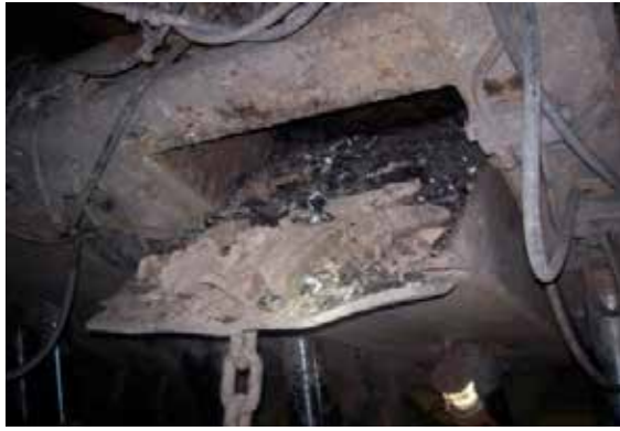
Şekil 4. Tahkimat penceresinden tavan kömürünün alınması