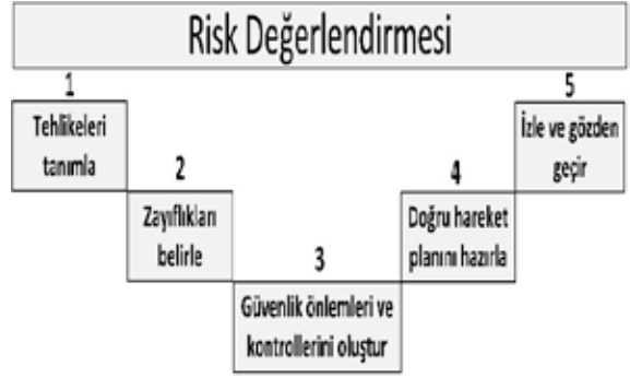
Şekil 5. Risk değerlendirme aşamaları