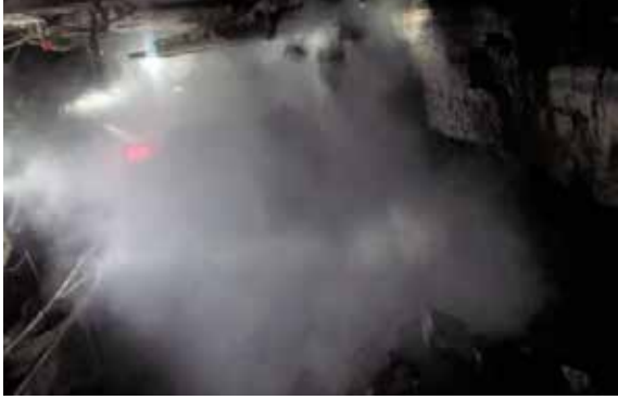
Şekil 3. Üretim sırasında oluşan toz

tahkimat penceresinden tavan kömürünün alınması sırasında) (Şekil 4), delme-patlatma işlemleri (grizu, kömür tozu, yetersiz havalandırma, solunabilir toz), su kontrolünün yapılmaması ve içsel yangın olarak verilebilir (Özfiat vd., 2013).