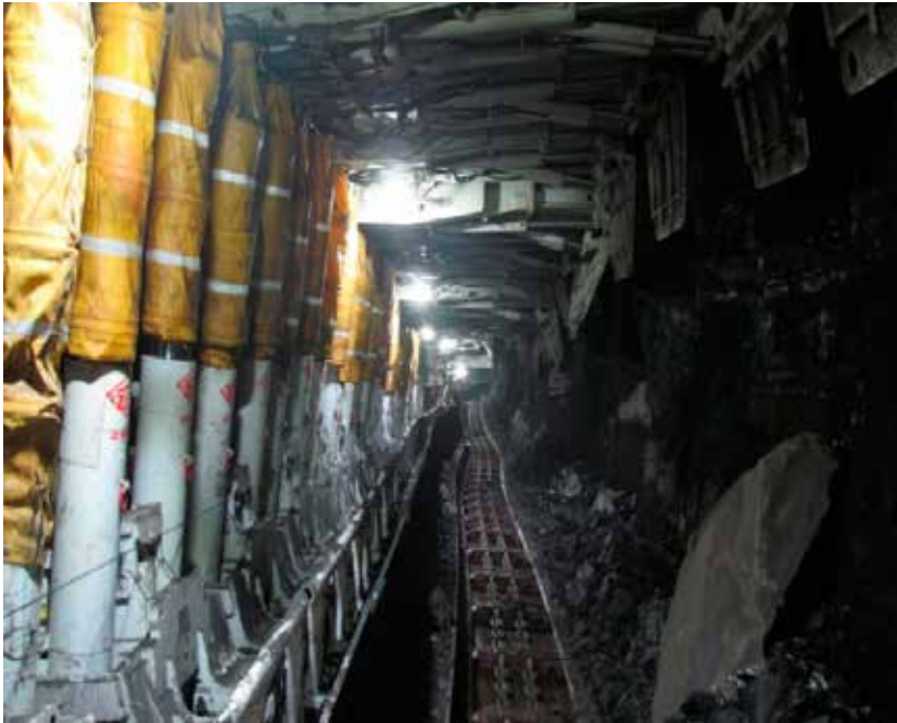
Şekil 2. Tam mekanize bir uzunayaktan görünüm (Yetkin, 2013)