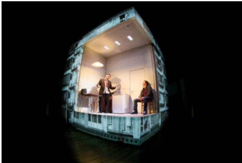
Görsel 5. Es Devlin, 2013, "Chimerica" Sahne Tasarımı, Almeida Theatre, Londra.

Çoğulcu anlayışın öne çıktığı günümüz sanatında, özellikle güzel sanatlarda sanatçılar, bir tek kimlik taşımasından ziyade sentezci bir anlayışla, katılımcı bir performansa dönüşen aynı zamanda, farklı kültür ve teknik bireşimlerini oluşturan sanat eserleri ile karşımıza çıkmaktadır. Eklektik bir yapı içerisinde sunulan Hedi Xandt 'in Koruluk Tanrıçası adlı eserde sanatçı, kendi kültürü dışında farklı bir kültür ve eseri kullanmış; dünya sanatı tarihi içerisinde başyapıt niteliği taşıyan eserleri, özgün sanat nesnesine dönüştürerek melez / sentez bir eser ürettiği gözlemlenmiştir (Şahin, 2015).