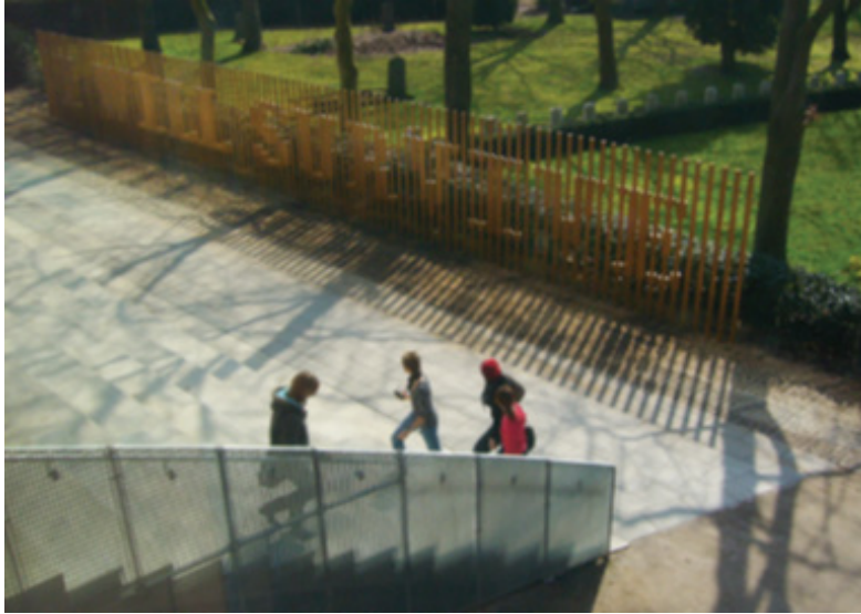
Görsel 3. Martijn Sandberg, "I Will Survive" (Hayatta Kalacağım), 2008, Hardenberg, Hollanda

Hollanda'lı sanatçı Martijn Sandberg'in 2008 yılında "I Will Survive" (Hayatta Kalacağım) isimli çalışması (Görsel 3), yere özel olma özelliğiyle dikkat çeken bir örnektir. Hollanda Hardenberg'de şehrin içinde kalmış eski mezarlığın bir kenarında 25 metre uzunlukta, 3 metre yükseklikte yerleştirilen çitler üzerinde "I Will Survive" cümlesiyle sanatçı, görünürde çiti andırırsa da bunun mezarlığın etrafını saran çit olmadığını ve bunun bir sanat yapıtı olarak tanımlanması gerektiğini belirtir. Bu çitler üzerindeki yazı sadece belirli açılardan net bir şekilde okunabilmektedir. "Sanatçı izleyicinin bakış noktasına göre algılanabilen bu çalışmasıyla; bitişikteki mezarlığın dehşet verici olacağı düşüncesinin aksine, yaşam ve ölüm, eylem ve hareketsizlik arasındaki karşıtlığı belirtir. Burada yaşam ve ölüm arasında birlikte sunulan karşıtlık, izleyenin algısını değiştirmektedir" (Saygı, 2016: 97).