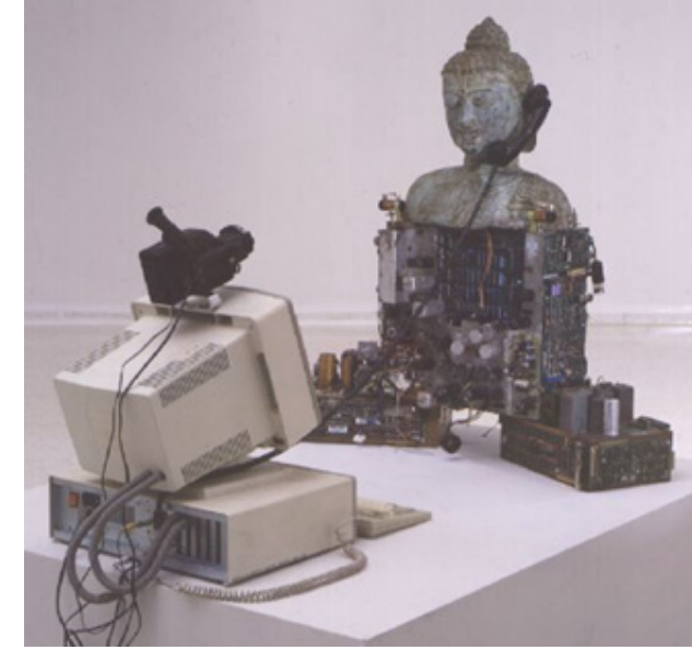
Görsel 1. Nam June Paik, Techno Buddha, 1994, buda kafası, şasi, bilgisayar monitörü, klavye, telefon, yaklaşık 110 x 105 x 40 cm

çeşitli materyallerin kullanımı ve bunların ilişkilendirme biçimi yanında, işin kavramsal boyutu, çok yönlü oluşuyla, tam anlamıyla melez bir yapı olma özelliğine sahiptir.