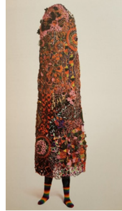
Görsel 6. Nick Cave, Sesiysi (isimsiz), 274,3 x 91,4 x 73,7, sentetik saç (peruk), yün, metal teçhizat, 2009

Çoğulcu anlayışın öne çıktığı günümüz sanatında, özellikle güzel sanatlarda sanatçılar, bir tek kimlik taşımasından ziyade sentezci bir anlayışla, katılımcı bir performansa dönüşen aynı zamanda, farklı kültür ve teknik bireşimlerini oluşturan sanat eserleri ile karşımıza çıkmaktadır. Eklektik bir yapı içerisinde sunulan Hedi Xandt 'in Koruluk Tanrıçası adlı eserde sanatçı, kendi kültürü dışında farklı bir kültür ve eseri kullanmış; dünya sanatı tarihi içerisinde başyapıt niteliği taşıyan eserleri, özgün sanat nesnesine dönüştürerek melez / sentez bir eser ürettiği gözlemlenmiştir (Şahin, 2015).