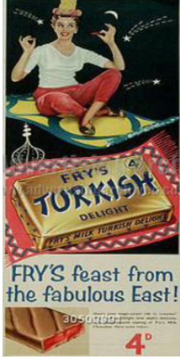
Görsel 4. FRY'S Turkish Delight, Melez Kültürel Reklam İletisi