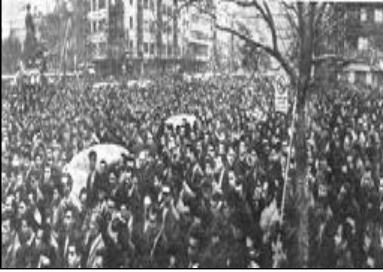
Kızılay'da günlerce süren Celal Bayar karşıtı gösteriler ("27 Mayıs korunacaktır", Kaynak: Ulus, 25. 03. 1963, s. 1-7)