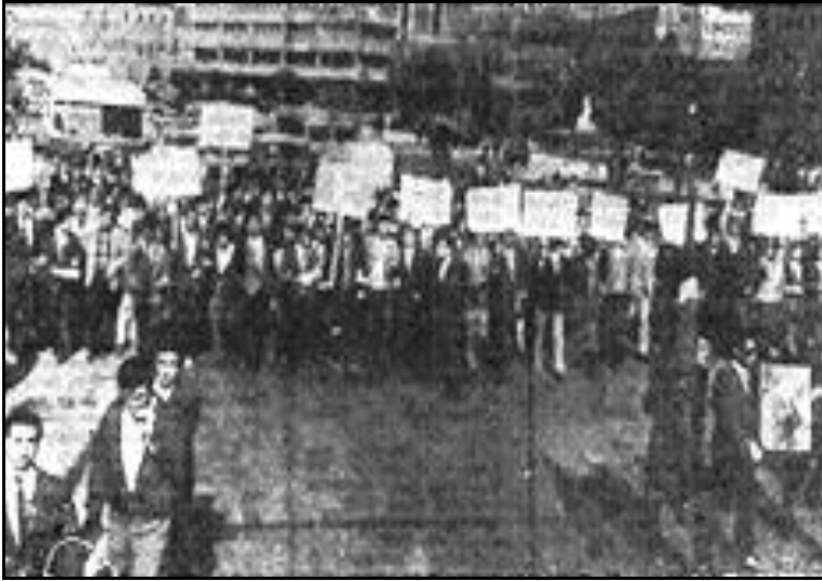
Üniversiteye giremeyen öğrencilerin ek kontenjan gibi hakları talep ettikleri ve sonucunda kontenjan artırımına gidilen yürüyüşler. ("Üniversiteye giremeyenler yürüyüş yaptılar", Kaynak: Ulus, 08. 10. 1962, s. 1-7)