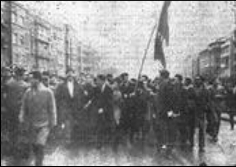
Kızılay'da Celal Bayar karşıtı gösteriler