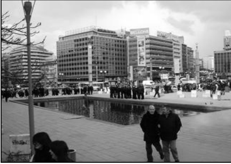
Muhafif hareket ve toplumsal eylem olasılığına karşı Güvenpark'ta sıklıkla konuşlanan kolluk kuvvetleri (Mart, 2009)

lendirildiğinde, semte nadiren giden iki kesim dikkati çeker: 1. Keçiören, Mamak gibi kent çeperlerinde yaşayan yoksullar maddi ulaşılabilirliğe sahip olmadıklarından, 2. Çayyolu, Konutkent gibi kentin güneybatısında yaşayan üst gelir grubu da kendi alt merkezlerinde ticari-kamusal-sosyal gereksinimlerini karşıladıklarından, Kızılay'a yılda bir ya da iki kere inmektedir (İlkay, 2010).