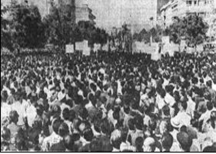
Kıbrıs Mitingi. Onbinlerin katıldığı Kıbrıs Mitingi'ne Sunay'ın mesajı: Hükümete ve orduya güveniniz