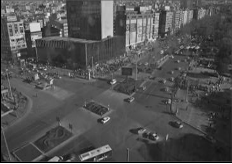
Kızılay Meydanı (Kızılay AVM'den)

Atatürk Bulvarı boyunca sıkıştırılmış doğrusal hareket, ana arterlerin parçaladığı yaya bölgeleri ve semtin açık yeşil alanı Güvenpark ile karşısında aynalı cephesiyle yükselen devasa Kızılay AVM, Kızılay'ın odağına hâkim ana mekânsal çelişkileri imler. Bitişik-nizam yapılaşma, hızlı-yoğun yaya trafiğine dar gelen kaldırımlar, taşıt trafiğinin akması için yıllar içinde genişletilmiş ve (Kesim, 2010)'e göre iki yakası arasındaki ilişki zayıflatılmış bulvar ve Metro-Ankaray çıkışları da mekânsal forma hükmeder. Ayrıca, Akay ve daha ötede Kuğulu katlı kavşakları, yoğun trafiğin olduğu Meşrutiyet Caddesi ve Atatürk Bulvarı üzerindeki üst yaya geçitleri de buna eklenebilir. Tüm bunlar, Kızılay'ın merkezi bir semt olmasına karşın, mekânsal olarak yaya mekânı olmaktan çıktığını göstermektedir (İlkay, 2010).