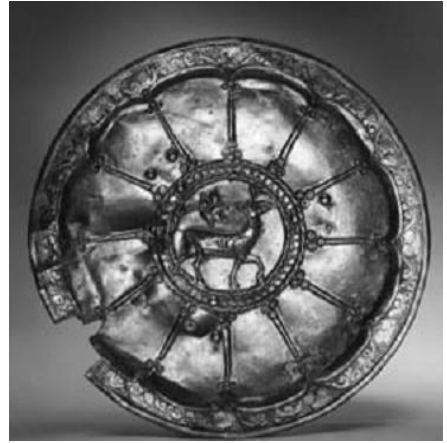
Resim 29. Soğd yapımı başka bir gümüş tabak. VIII. yüzyılın ikinci yarısında imal edilmiştir. (Marshak, 1996: 255)