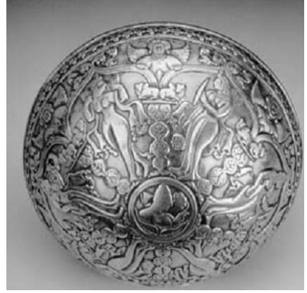
Resim 24. Başka bir gümüş kap örneği. (Litvinsky, 1996: 164)