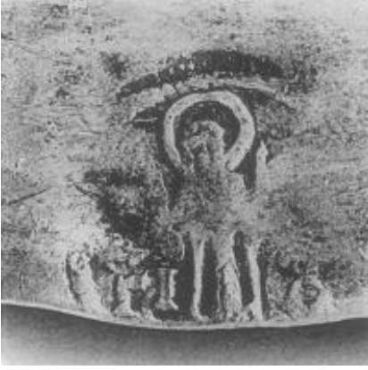
Resim 3. Resim 3'te bulunan tabağın üzerindeki resimlerden bir tanesi. (Alföldi, Cruikshank, 1957: 238, 239)