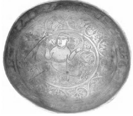
Resim 32. Maveraünnehir coğrafyasına ait Soğd yapımı gümüş bir tabak. X. yüzyıla aittir. (Hakimov, Novgorodova, Dani, 2000: 440)