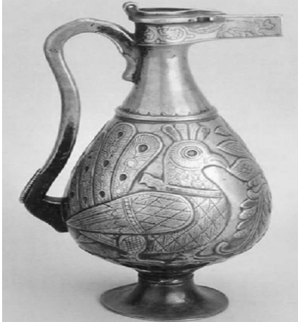
Resim 31. X. yüzyıla ait başka bir gümüş sürahi örneği. (Hakimov, Novgorodova, Dani, 2000: 439)