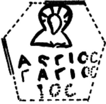
Resim 10. Resim 3'te bulunan tabağın üzerindeki mühürlerden bir tanesi. bu mühürler kıymetli metalin ticari faaliyetlerde mübadele aracı olarak kullanıldığını belirtmek amacıyla kullanılırdı. (Alföldi, Cruikshank, 1957: 238, 239)