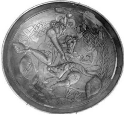
Resim 23. St Petersburg Hermitage Müzesinde bulunan bir gümüş tabak. Üzerinde mitolojik bir ejderhayı avlayan hükümdar resmi yer almaktadır. (Dani, Litvinsky, 1996: 120)