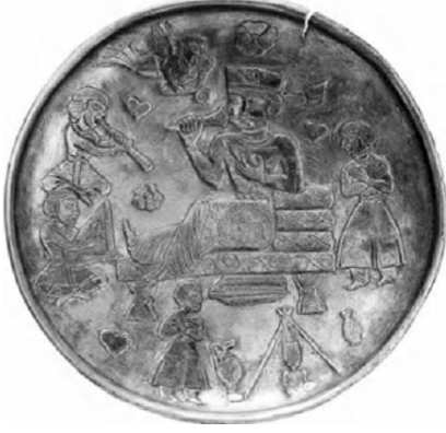
Resim 30. Horasan'da bulunan VIII. yüzyıla ait bir gümüş tabak. Sâsânîler döneminin sanat sevkine göre tasarlanmıştır. Tabakın üzerindeki motifler dönemin günlük yaşam ve inanç öğelerine ait bilgiler vermektedir. (Hakimov, Novgorodova, Dani, 2000: 438)