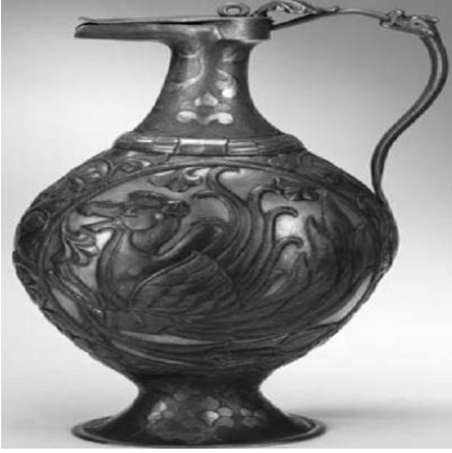
Resim 26. VII. yüzyılın sonlarında imâl edilmiş, Semerkand yapımı bir Soğd sürahisi. (Marshak, 1996: 255)