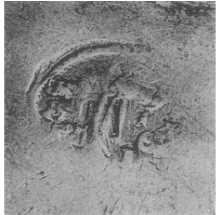
Resim 6. Resim 3'te bulunan tabağın üzerindeki resimlerden bir diğeri. (Alföldi, Cruikshank, 1957: 238, 239)