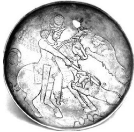
Resim 21. Gümüş tabaklar üzerinde en çok dikkat çeken resim hükümdarları aslan avlarken gösteren motiflerdir. (Chegini, Nikitin, 1996: 76)