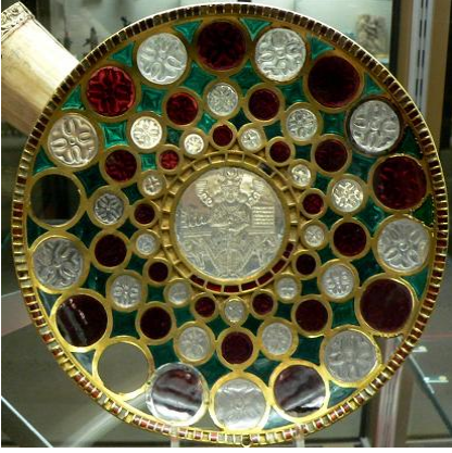
Resim 14. İran hükümdarlarından I. Hüsrev'e ait altın, gümüş ve cam motifli bir tabak. (Feltham, 2010: 24)