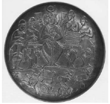
Resim 16. Hermitage, I. Hüsrev dönemine ait gümüş tabak. (Garthwaite, 2005: 106)