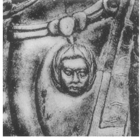
Resim 5. Resim 3'te bulunan tabağın üzerindeki resimlerden bir diğeri. (Alföldi, Cruikshank, 1957: 238, 239)