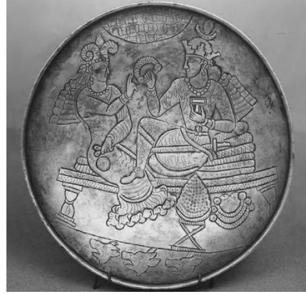
Resim 12. Baltimor, Walter Sanat Galerisinde sergilenen İran yapımı gümüş bir tabak üzerinde kraliyet ailesinin verdiği bir ziyafet resmedilmiş. (Brosius, 2006: 165)