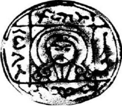
Resim 27. Kocho'da bulunan bir gümüş tabak. Üzerine Mani'nin portresi kazınmıştır. (Zhang Guang-da, 1996: 308)