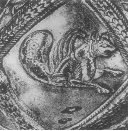
Resim 4. Aynı vazo üzerinde yer alan mitolojik kanatlı hayvan motifi. İran yapımı gümüş eşyalar üzerinde dört ayaklı iki kanatlı mitolojik hayvan resimleri oldukça sık kullanılan görsellerden bir tanesidir. (Alföldi, Cruikshank, 1957: 238, 239)