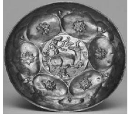
Resim 28. Yine VII. yüzyılın sonlarında yapılmış Soğd yapımı gümüş bir tabak. (Marshak, 1996: 256)