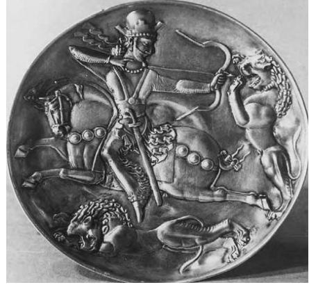
Resim 13. St Petersburg'daki Hermitage Museum'da sergilenen II. Şapur'a ait bir kraliyet av merasimini gösteren gümüş tabak ve yine hükümdarın bir aslan avı sahnesi. (Brosius, 2006: 166)