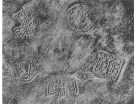
Resim 9. Leningrad, Hermitage, gümüş bir tencere üzerine vurulmuş damgalar. Sasaniler dönemi İran yapımı bir ürün olan bu tencere mübadele aracı olarak kullanıldığı için üzerinde Bizanslı tüccarlar tarafından satın alındığını gösteren Bizans mühürleri bulunmaktadır. (Alföldi, Cruikshank, 1957: 238, 239)