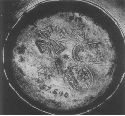
Resim 11. Baltimor, Walter Sanat Galerisinde sergilenen gümüşten yapılmış asma lamba üzerindeki mühürler. (Alföldi, Cruikshank, 1957: 238, 239)