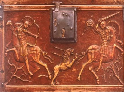
Resim 19. Üzerinde Aslan avını gösteren Avrupa kökenli fildişi sandık. Görüntü renklendirilmiş ve gümüş metal plaklar kullanılmış. (Feltham, 2010: 37)