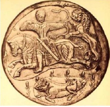
Resim 18. VII. yüzyıla ait Soğdiana yapımı gümüş bir tabak. Aslan avlayan hükümdar sahnesini gösteren İran taklidi bir tabak. (Feltham, 2010: 27)