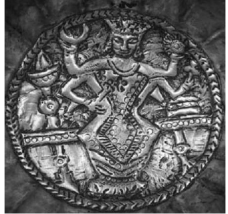
Resim 25. Harzem bölgesine ait gümüş tabak ve üzerinde Buda'ya ait resim. (Nerazik, 1996: 225)