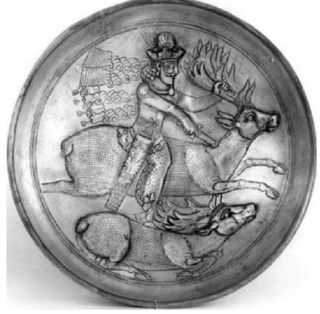
Resim 20. İran hükümdarlarından birine ait av sahnesinin üzerinde resmedildiği gümüş bir tabak (Chegini, Nikitin, 1996: 61)