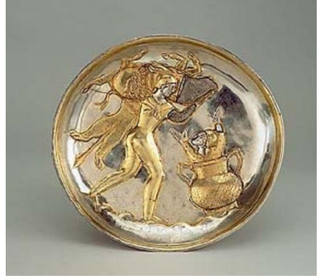
Resim 17. Heracles'in aslan postu giymesini tasvir eden altın işlemeli gümüş bir tabak. (Feltham, 2010: 25)