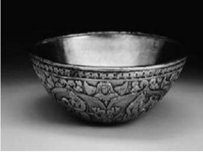
Resim 22. Akhunlar dönemine ait gümüş bir tencere ve bu tencereye ait kapak. (Litvinsky, 1996: 164)