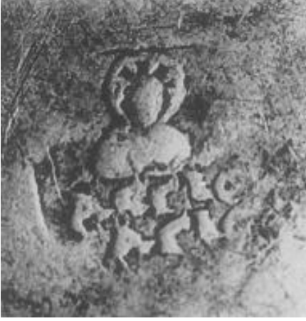
Resim 7. Resim 3'te bulunan tabağın üzerindeki resimlerden bir diğeri. Bir Hıristiyan azizeye ait resim olduğu düşünülmekle beraber, bu ürünün bir kiliseye hediye edildiği ve bundan dolayı bu şekilde mühürlendiği tahmin edilmektedir. (Alföldi, Cruikshank, 1957: 238, 239)