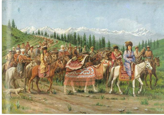
Resim 1: Bogatoye Koçevye (Zengin Obanın Göçü) (N. Hludov, 1885)

Göç düzeni içinde, kervanın başını çeken kızın hemen arkasında, süslü bir deveye binmiş çon ene (büyükanne) veyâ evdeki hanımların en büyüğü olan baybiçe bulunur ve kucağına sevdiği küçük oğlunu veyâ torunlarından birisini alırdı 10 . Baybiçe , bâzen yüklü hayvanlar çok olduğu takdirde, bunların en süslü olanını yularından tutarak berâberinde götürürdü. Baybiçenin arkasında, yine süslü atlara veyâ develere binmiş, tokol adı verilen oba başkanının ikinci, üçüncü hanımları yer alırlar; onları ise kıdemlerine göre dizilmiş yine süslü atlar üzerindeki gelinler tâkip ederlerdi (Aytmambetov, 1987: 49). Hanımların her biri, ya kucaklarına küçük bir çocuk alırlar veyâ yüklü bir hayvanı ipinden çekerek giderlerdi. Oba reisinin ve grubun diğer kızları ise, göç kervanı içinde süslü atlarıyla, fakat belirli bir yer işgal etmeden bulunur, başka bir ifâdeyle daha rahat hareket ederlerdi. Böylece güzel kız , büyükanne , baybiçe , tokollar , gelinler ve diğer kadınlardan oluşan kadınlar, göçün ön kısmında ana grubu oluşturur, diğer îtibarlı kimselerin âileleri de hemen hemen aynı diziliş içerisinde arkadan gelirlerdi. Arkadan gelen obalar, önde giden grubun devâmı veyâ göç kâfilesinin art kısımları olarak kabûl edildikleri için, arkadaki grupların başını çeken bir kız bulunmaz, ancak bunlar arasında da ilk grupta olduğu gibi baybiçe , tokol ve gelinler sıralamasına riâyet edilirdi. Kervanın en arkasında ise hayvan sürüleri, hizmetkârlar ve fakirler yer alırlardı (Şenol, 2003: 55) (Resim 1).