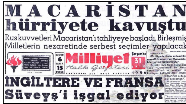
Şekil 3: İlk Sürmanşet Uygulaması

Öte yandan Abdi İpekçi yönetimindeki Milliyet Gazetesi'nde SSCB'ye yönelik antikomünist tavır da söz konusudur. 2 Bu durum gazetenin içeriğine olduğu kadar biçimsel özelliklerine de yansımıştır. Örneğin Doğu Avrupa ülkelerinden Macaristan'ın bağımsızlığını ilan etmesi (Şekil 3) ve sonrasında SSCB'nin Macaristan'ı işgal etmesi (Şekil 4) haberleri, Milliyet'te önemli bir mizanpaj yeniliğine yol açmıştır. Kitlemel gazeteciliğe özgü biçimsel unsurlardan biri olan "sürmanşet" Milliyet'te ilk defa bu haberlerde uygulanmıştır.