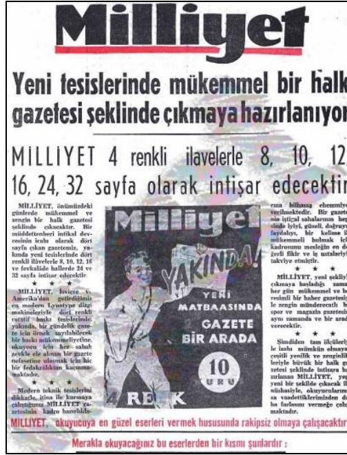
Şekil 1: 1 Eylül 1954 Tarihli Duyuru

Bu tarihten sonra Milliyet, yazı dizileri, spor ve magazin ekleri, promosyon kampanyaları gibi yeniliklerle okuyucularının karşısına çıkmıştır (Karaca, 1995: 21-36). 1954 Mayıs ayında yeni binasına taşınan ve kendi matbaasına sahip olan Milliyet, 1 Ekim 1954'ten itibaren yeni kadrosuyla birlikte büyük bir atılım gerçekleştireceğini 1 Eylül 1954 tarihli nüshasının birinci sayfasında duyurmuştur (Şekil 1).