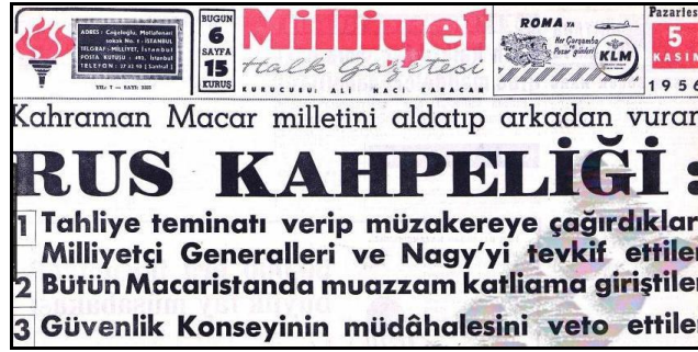
Şekil 5: 5 Kasım 1956 tarihli Milliyet'in Manşeti

Milliyet Gazetesi'nin SSCB'ye yönelik kullandığı dil ve üslup da kimi zaman oldukça sert olmuştur. Örneğin 5 Kasım 1956 tarihli Milliyet'in manşeti büyük puntolarla "Rus Kahpeliği" şeklinde atılmıştır (Şekil 5).