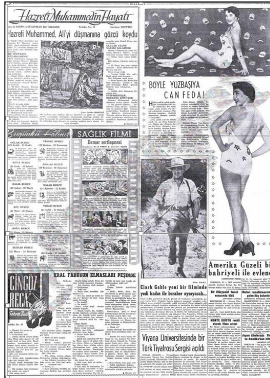
Şekil 6: 16 Kasım 1954 Tarihli Milliyet Gazetesi'nin Dördüncü Sayfası

Öte yandan Amerikan hegemonyasının kültürel/ideolojik/entelektüel boyutları, Abdi İpekçi yönetimindeki Milliyet Gazetesi'nde yansıma bulmuştur. Hollywood yıldızlarının yaşamları, Amerikan gündelik yaşamına ilişkin bilgiler, ABD'li bilim adamlarının başarıları gibi pek çok farklı konuya Milliyet'te geniş yer ayrılmıştır (Şekil 6).