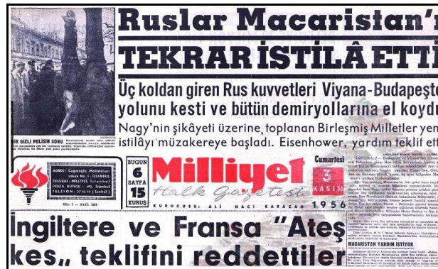
Şekil 4: Diğer Sürmanşet Uygulaması