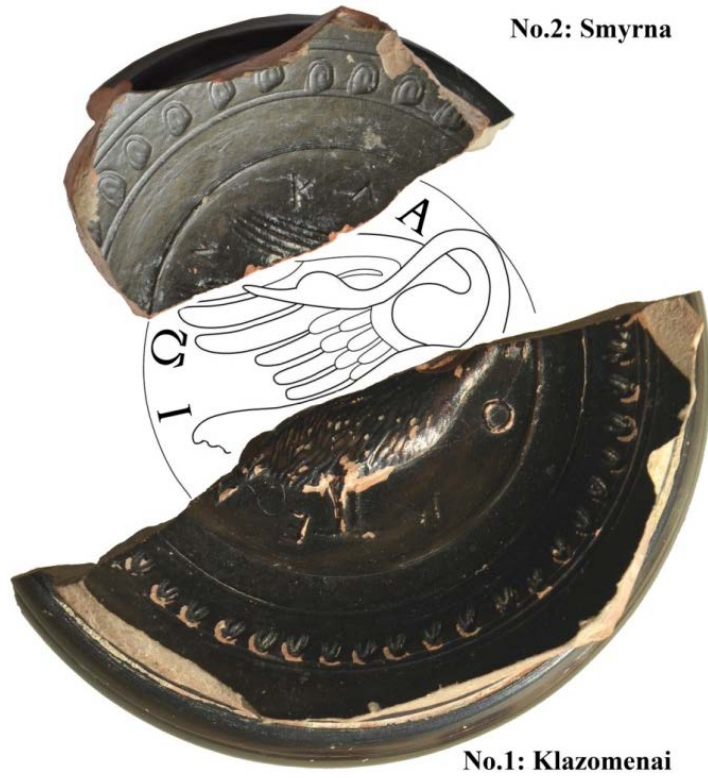
Resim 5: Cup-Skyphos Kaide Parçalarının Birleştirilmiş Çizimi