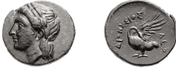
Resim 3: Leukai 4. Yüzyıl Bronz Sikkesi

Head, B. V., Catalogue of the Greek Coins of Ionia , London, 1892, 18. p 19 (Pl.VI:8)