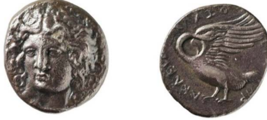
Resim 2 Resim 2: Klazomenai 4. Yüzyıl Gümüş Sikkesi

Head, B. V., Catalogue of the Greek Coins of Ionia , London, 1892, 18. p 19 (Pl.VI:8)