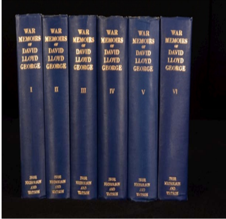
EK 2: Lloyd George'un 1933-36 yılları arasında yazılmış 6 ciltlik Savaş Anıları