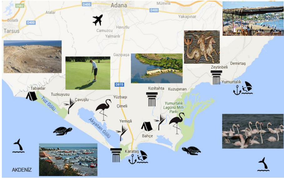
Şekil2. Karataş, Yumurtalık Turizm Gelişim Koridoru ve Bölgesi (Adana Turizm Master Planı, 2016)

Tapınağı, Amfi tiyatro vb. tarihi değerleri barındırmaktadır ( www.karatas.bel.tr ). Yılda yaklaşık olarak 90 bin adeti flamingo olmak üzere 300 bin göçmen kuşun göç yeri olan, pek çok endemik bitki ve hayvana ev sahipliği yapan, ayrıca Caretta caretta'ların yumurtlama alanı olan Türkiye'deki en büyük lagün ve kuş cenneti Akyatan Lagünü Karataş sınırlarında yer almaktadır. Akyatan Lagünü'nün yanı sıra Ağyatan ve Tuzla Lagünleri de ilçenin önemli sayılabilecek turizm değerleridir. Aynı zamanda Harbiş plajı, Tuzla plajı ve Ormanaltı plajı gibi ülkenin en uzun kumsallarını içeren Karataş ilçesi, deniz turizmi açısından da bölge için oldukça önemli bir destinasyondur (Demir ve Gündüz, 2016).