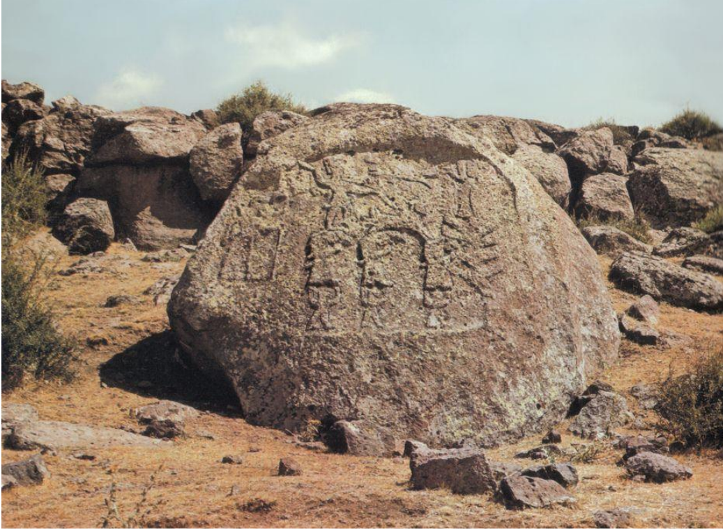
Resim: 1 İmamkulu Kaya Kabartmasının Karşıdan Görünümü (Kurt Bittel: 1976, https://www.hittitemonuments.com/imamkulu/imamkulu01.jpg )