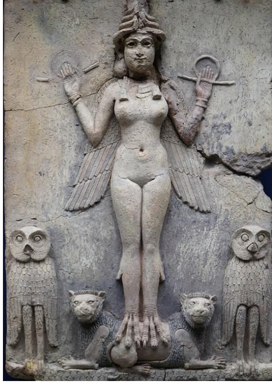
Resim 3: İřtar ( http://ozhanozturk.com/2018/03/29/istar/ )