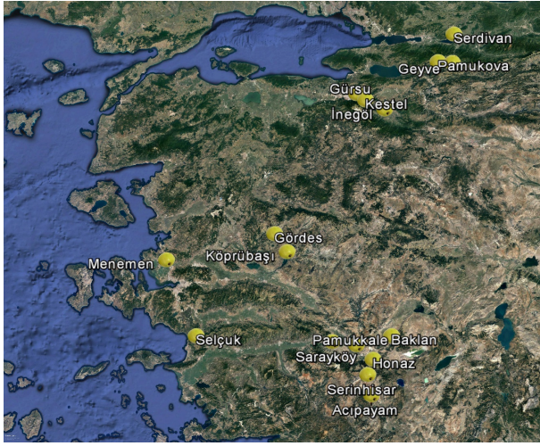
Şekil 2. Survey alanı. Figure 2. Survey area.

Surveyler, Doğu Marmara ve Ege Bölgesi'nde ayva üretiminin yoğun olarak yapıldığı; İzmir (Menemen, Selçuk), Manisa (Köprübaşı, Gördes), Bursa (Gürsu, Kestel, İnegöl), Sakarya (Geyve, Serdivan, Pamukova) ve Denizli (Sarayköy, Pamukkale, Baklan, Acıpayam, Serinhisar, Honaz) illerini kapsayacak şekilde gerçekleştirilmiştir (Şekil 2).