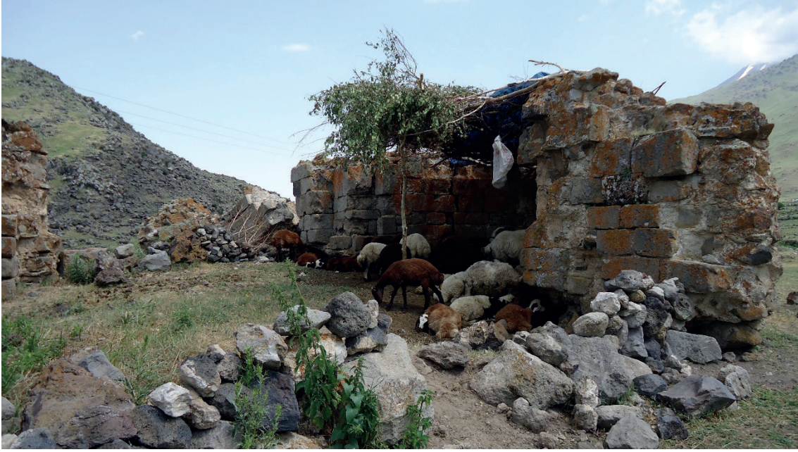
Foto 5: Parrot, Ağrı Dağı'na Yolculuk kitabında Korhan Kalesi'nde de bahsetmiştir. Photograph 5: Korhan Castle, also mentioned by Parrot in his book "Journey to Ararat".

bilimsel amaçlı olurken 13 , bir kısmı macera gezilerinin 14 parçası şeklinde gerçekleşmiştir.