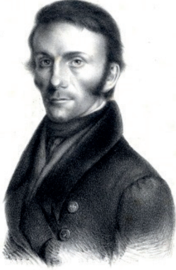
Foto 1: Friedrich Wilhelm Parrot. Photograph 1: Friedrich Wilhelm Parrot.

1811’de Moritz von Engelhardt ile birlikte yaptığı Kırım ve Kafkasya’ya yaptığı seyahat sırasında barometre kullanarak Hazar Denizi ile Karadeniz arasındaki deniz seviyesi farkını ölçtü. Dönüşünde Rus ordusuna cerrah olarak katıldı. 1816 ve 1817’de Alpler ve Pirenelere gitti. 1821’de Dorpat Üniversitesi’nde fizyoloji ve patoloji, 1826’da ise fizik alanlarında profesör unvanını elde etti. 1826-1829 yılları arasında Rusların Kafkasya’yı ele geçirmesiyle Ermenistan’a seyahat etti.