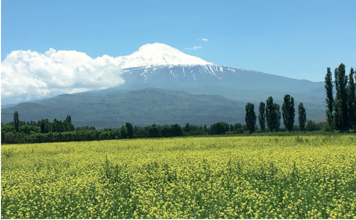
Foto 2: Ağrı Dağı'ndan bir görünüm. Photograph 2: A view from Mount Ararat.

verilmektedir. Bu tür tarihi araştırma kaynakları; Ağrı Dağı'nın flora ve faunasında daha önceleri var olan ilkel uyumun sonraki yüzyıllarda bozulduğuna ve bölgede ekolojik yıkımların yaşandığına dair önemli ipuçlarını da içermektedir 7 .