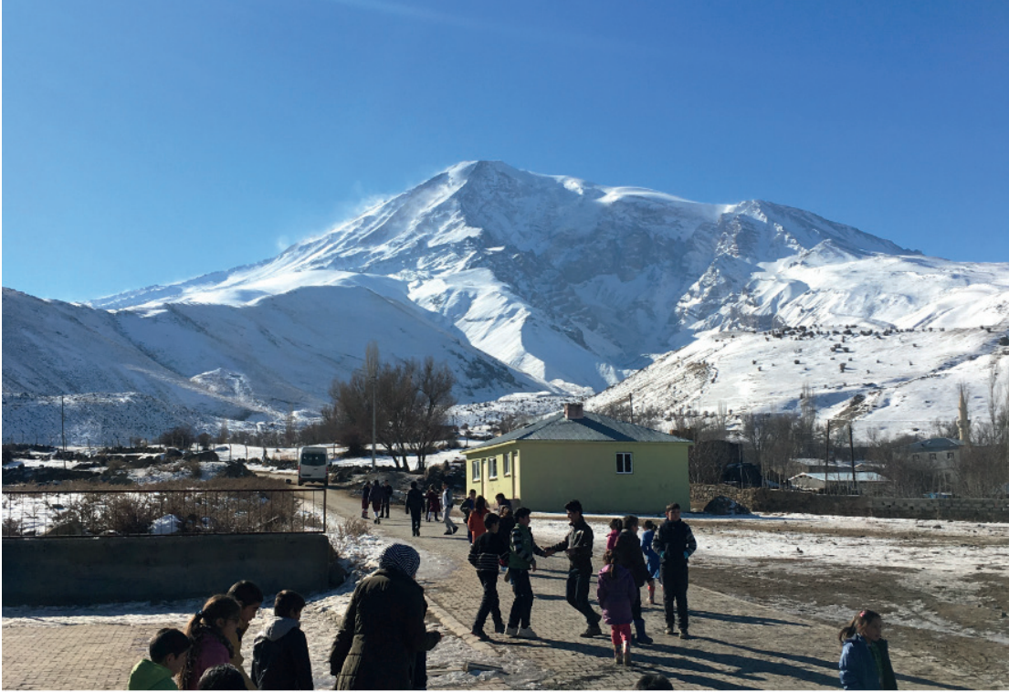
Foto 4: Yenidoğan Köyü, Ağrı Dağı'nın kuzeyinde kurulmuştur. Photograph 4: Yenidoğan Village was founded in the north of Mount Ararat.

Ahura Köyü'nün yok olmasından sonra bölgeyi ziyaret eden Batılı gezginlerden eski köyün biraz aşağısında köyün yeniden inşa edildiğini öğreniyoruz (Theilman, 1875, s. 197). Iğdır'da eski yerel isimlerin yerine Türkçe isimler verildiği 1960'lı yıllarda, Ahura'nın adı da Yenidoğan (1965) olarak değiştirilmiştir ( Foto 4 ).