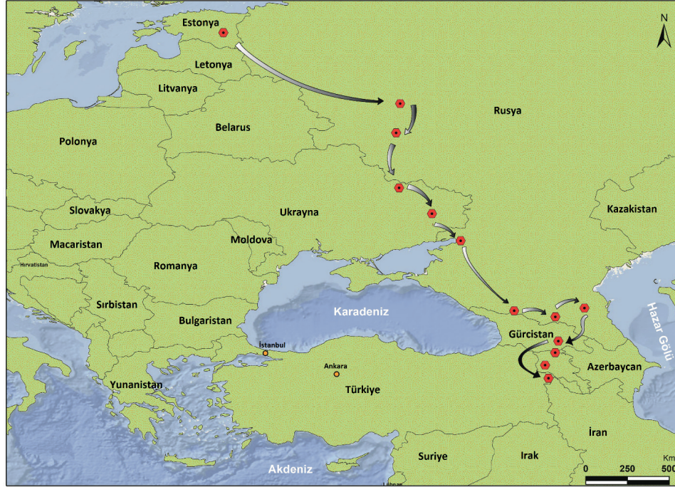
Şekil 1: Friedrich W. Parrot'un Ağrı Dağı araştırma keşif gezisinin rotası. Figure 1: The route of Friedrich W. Parrot's research trip to Mount Ararat.

uzaklaştırılmalarıdır 8 . Bu durum, Batılı bilim adamlarının, seyyahların ve misyonerlerin daha güvenli bir şekilde bölgeyi ziyaret etmelerini ve bunların Rus egemenliği altındaki yerel otoritelerden (bilhassa Ermenilerden) daha kolay lojistik destek almalarını sağlamıştır.